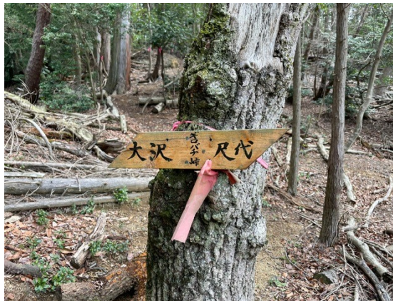
5. ギロバチ峠 スズメバチが飛んでそう