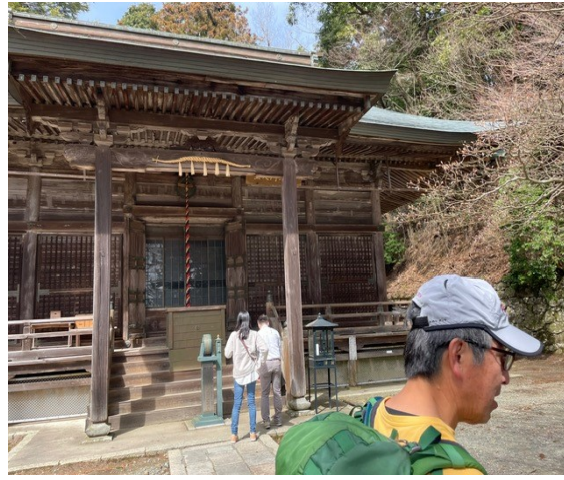
11. 本山時 (ホンザンジ)