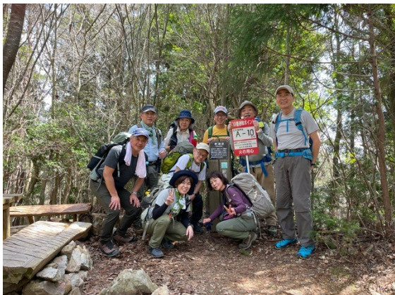
7. 釈迦岳 写真集合