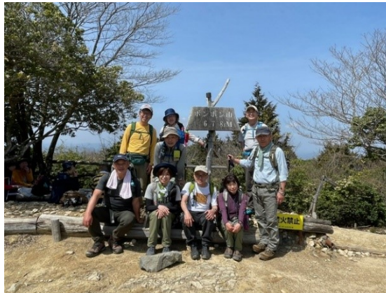
8. ポンポン山 678m 快晴の空