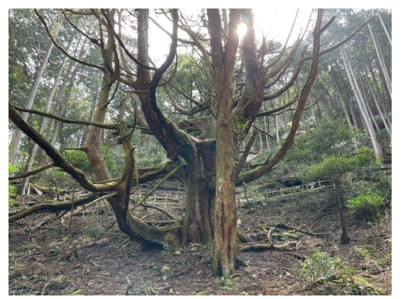
6. 大沢の杉 樹齢800年 特別天然記念物