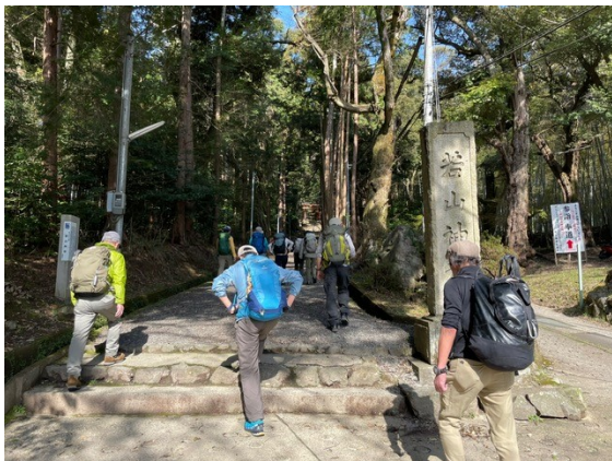
4. 若山神社 素戔鳴尊を祀っている