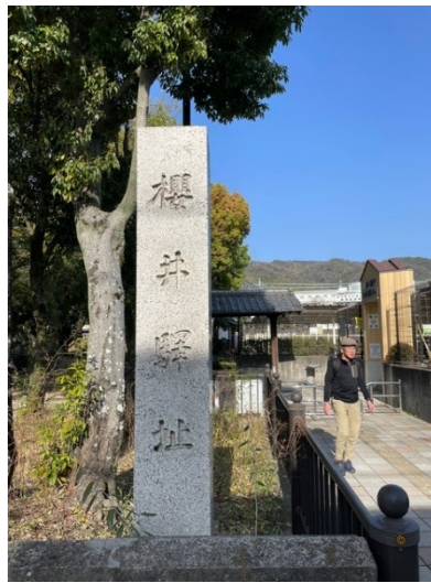
2. 桜井の駅 楠公親子決別の所