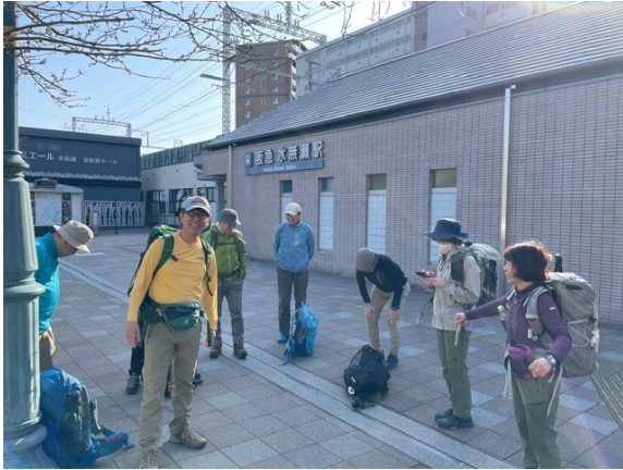
1. 阪急水無瀬駅 8時集合

北摂トレイル出発点阪急水無瀬駅より上の口バス停までの18.1kmを歩きました。所要時間は休憩を入れて7時間40分。 雲一つない晴天でした。