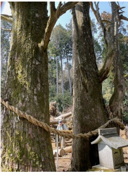
10. 天狗杉 天狗の休息地らしい