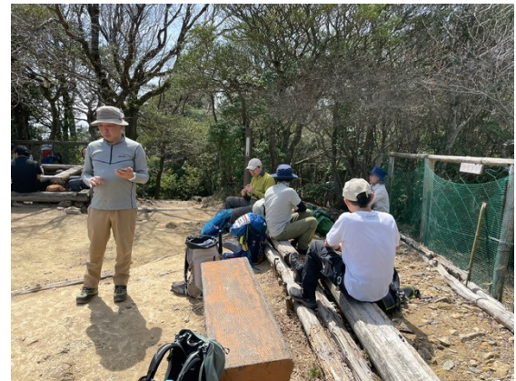
9. 昼食 他の登山グループ5組くらいだった