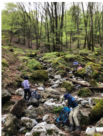
五合目近く正面の木の根っこにリス