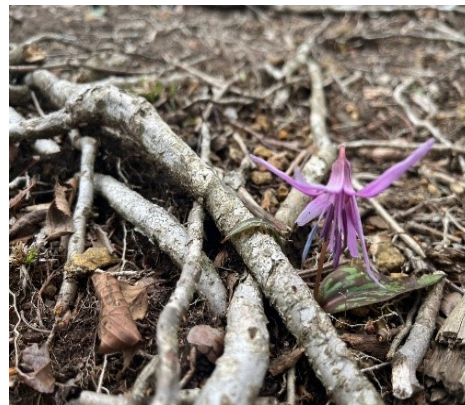
カタクリの花が可憐に咲いてます