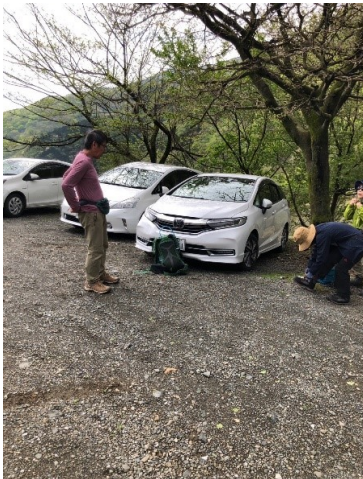
最後の一台の駐車場