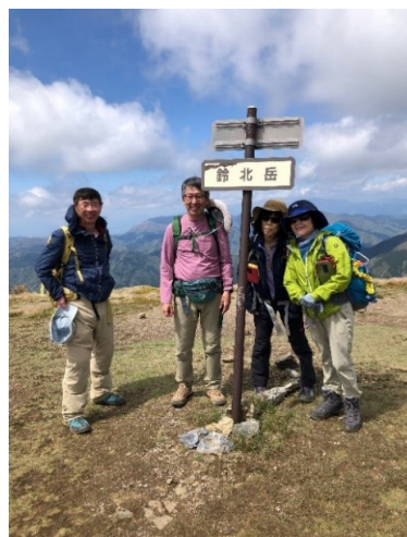
鈴北岳 1182m 360度の展望 後は下り1時間