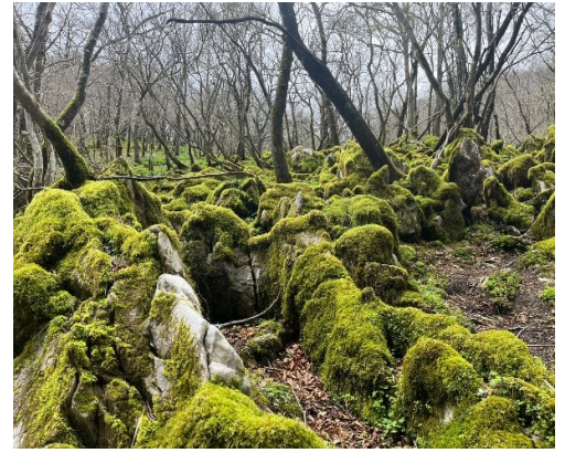
岩と苔が日本庭園の趣がある