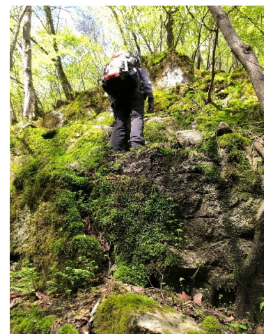
岩場の急斜面もあり変化が良い