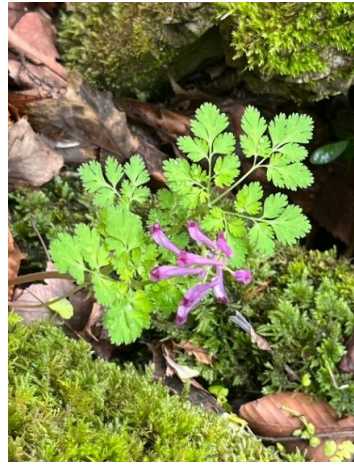
何の花でしょうか？③