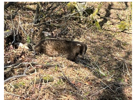
丸々と太ったタヌキと遭遇