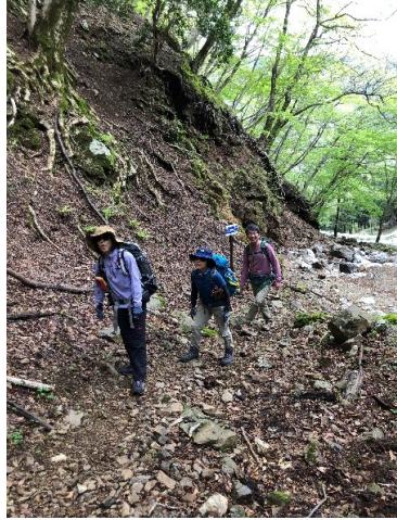
コクルミ登山口からの沢沿いの