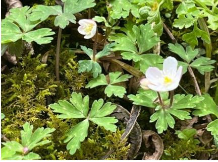
イチリンソウ 色々な花が咲いています。