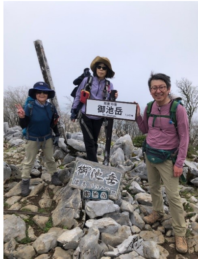
御池岳 1247m 視界無し