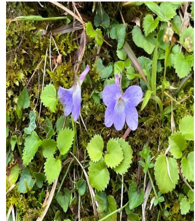
何の花でしょうか？①