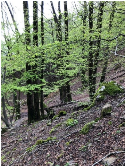
リスのねぐら。みどりの樹木がきれい