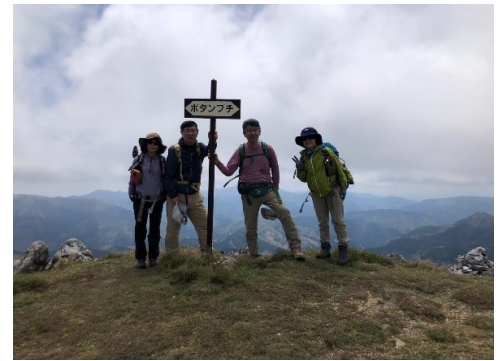
展望良好なボタンブチ 風も強い 奥は切れ落ちた岩峰