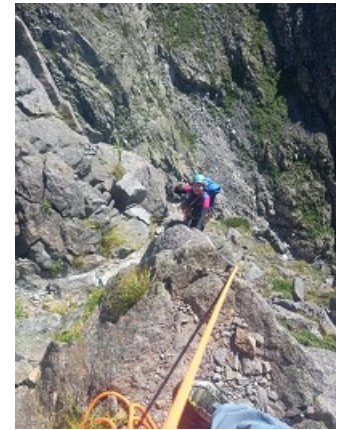
フォローで登るKちゃん