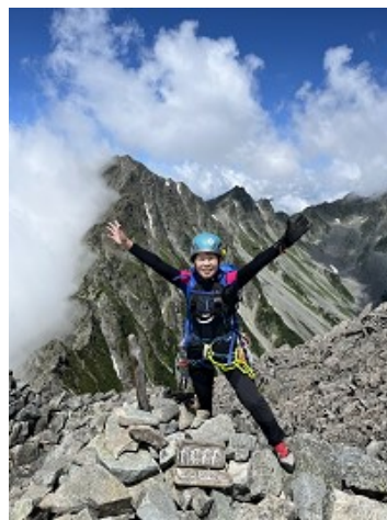
前穂高山頂に到着！