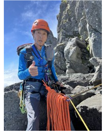
こんな感じでやっています