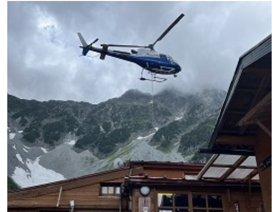
涸沢ヒュッテの荷揚げヘリ