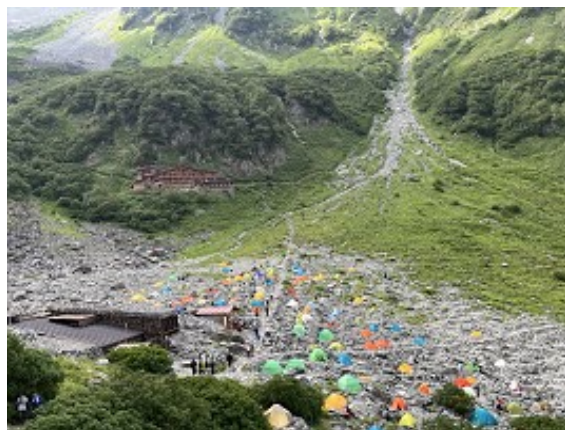
涸沢の賑やかなテント場