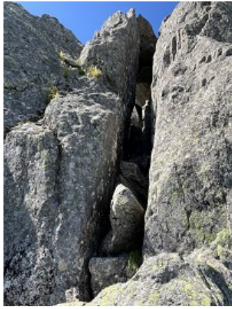
Kリードで左のチムニーを進みます