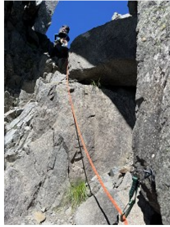
チムニーの後、右上