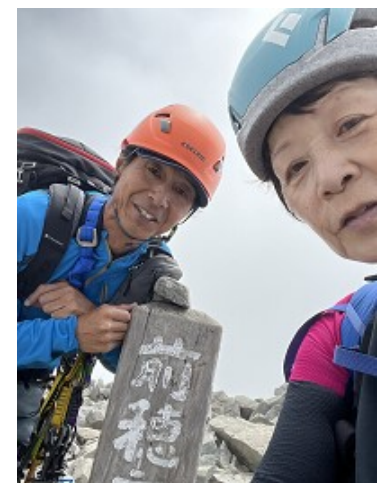
山頂、誰もいなかった