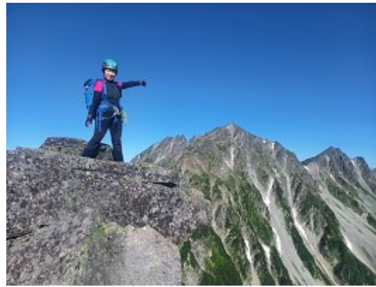
あっちが奥穂です