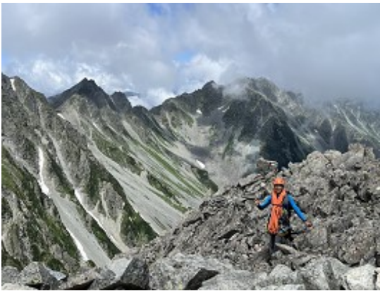
2峰から1峰への歩き