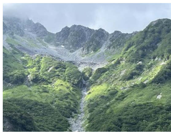
昨年登った北穂東稜