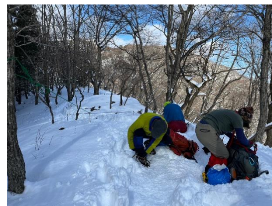
念のため、アイゼン装着