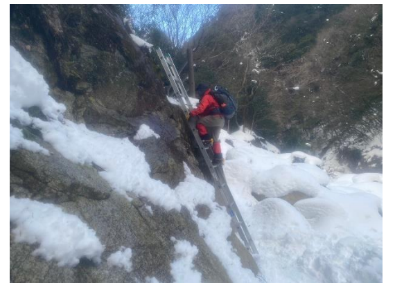
はしごの1か所 ここから林道を経て、 駐車場へ