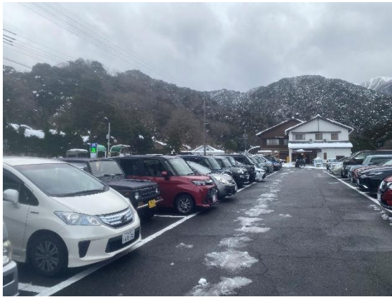
駐車場到着。なんとほぼ満車。

HP担当は下山時に足にトラブルが発生しつらい山行になったが、今シーズン初の雪山は楽しい山行になった。