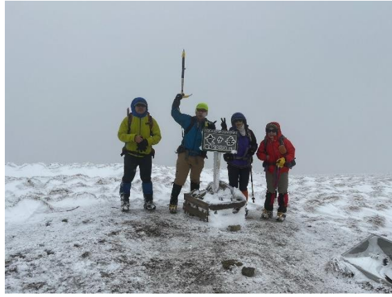
山頂ゲッツ！なんも見えん。