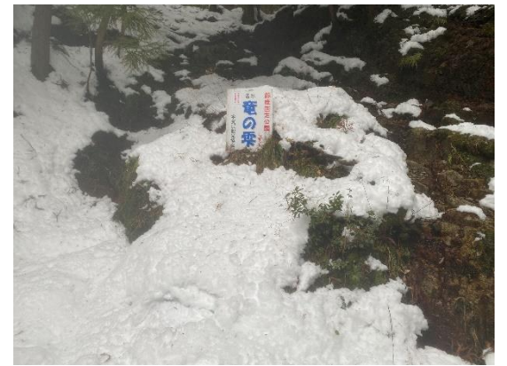
林道途中に名水 竜の雫 飲まずに通過