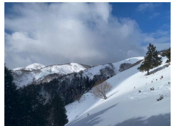
一番左が竜ヶ岳。まだまだあるやん。