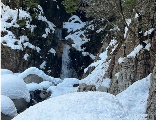
途中 白滝 二筋の滝