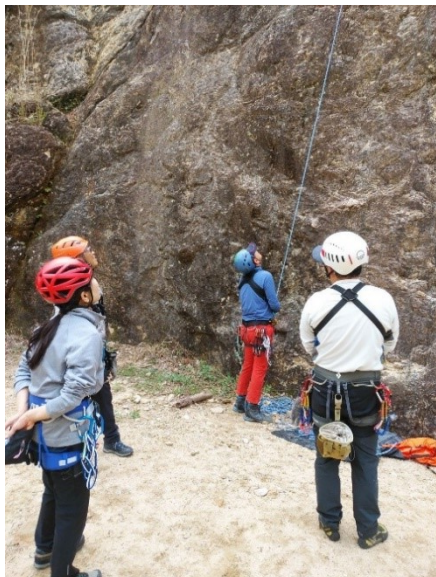
まずはルートを観察

今回は久しぶりの人もいるので小屏風3ルートにロープを張り、易～まずまず難な練習を行った。