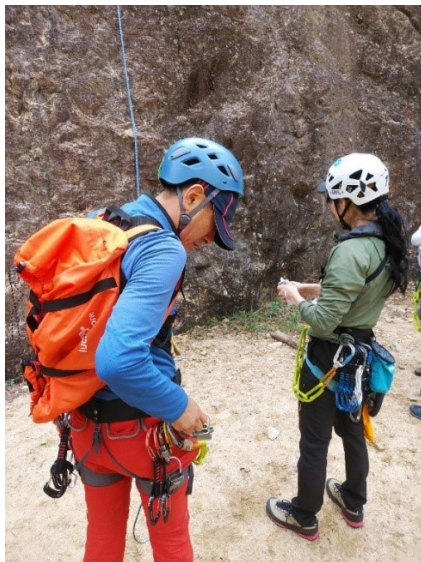
次に作戦を立てます。