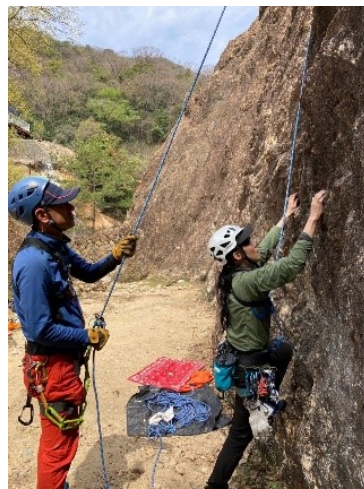
気合いを入れます。