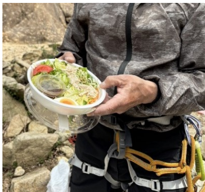
健康にも気を遣います。