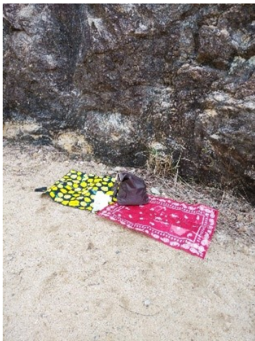
きちんとシートを使います。