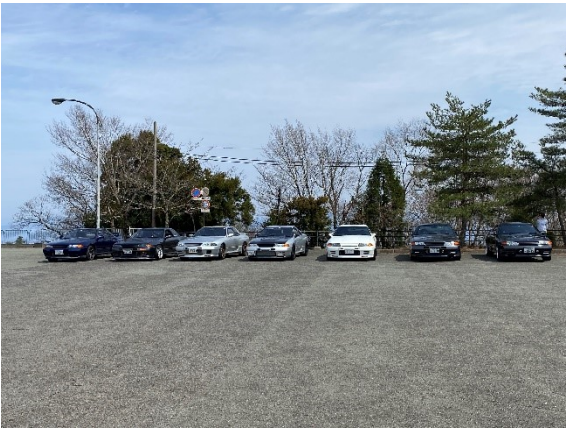
駐車場で R32 GT-R 軍団に遭遇