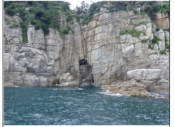
2019年の遊覧船からの写真です