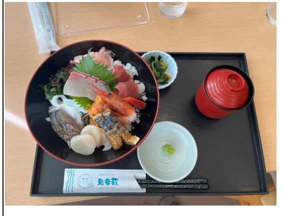
海鮮丼うまかったです！