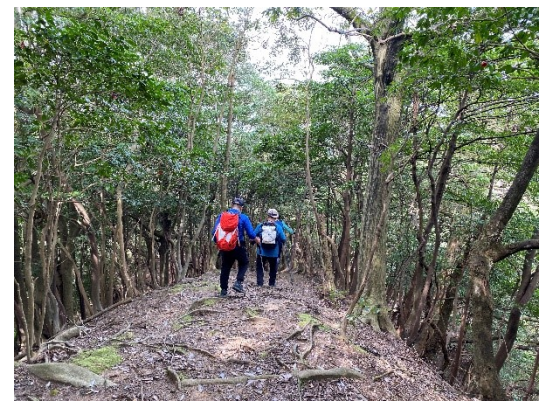
どんどん下ります