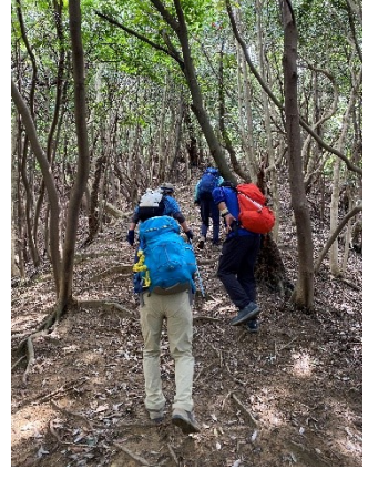
帰るために上がります。いつもと逆！