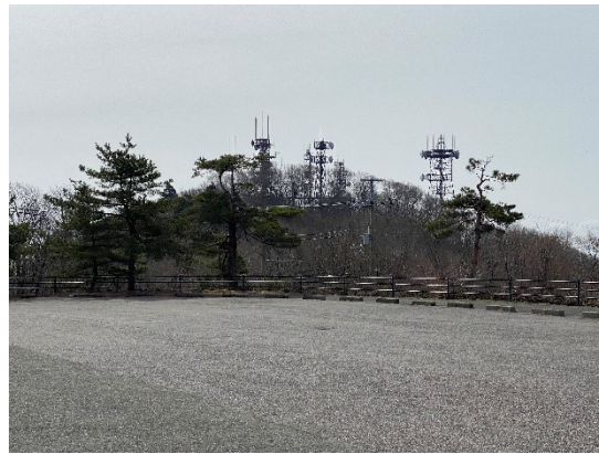
山頂は駐車場からすぐそこ