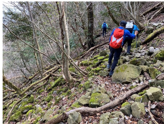
道はメッチャ歩きにくい