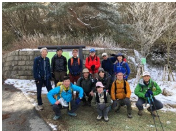
8. このうち7名全縦、1名東半縦、1名アンカーが大会に参加します