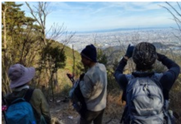
11. 生駒、金剛山系まで見渡せます