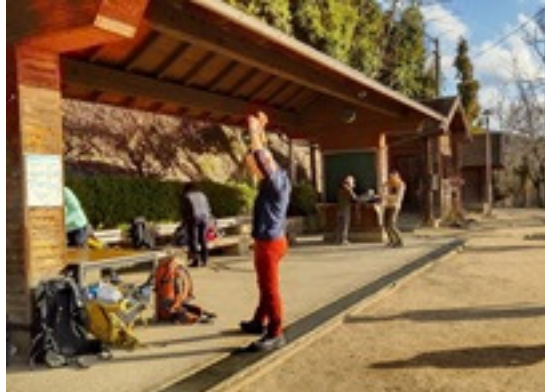
2. 見晴らし台で体操