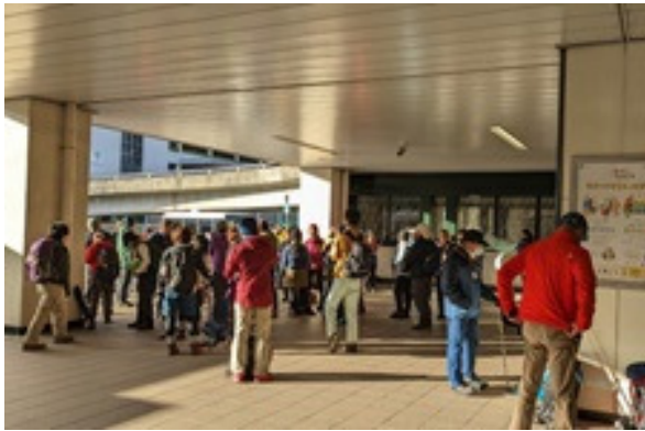
1. 新神戸駅集合、他にも50名の同ルートパーティーあり。