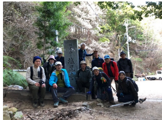
12. 塩尾寺にゴール、お疲れ様でした！