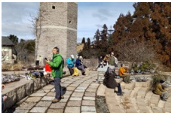
5. 六甲ガーデンテラス