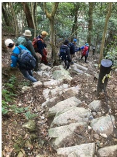
10. 急な階段を降りて・・・