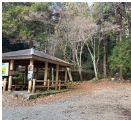
筏見四十八滝入口の東屋