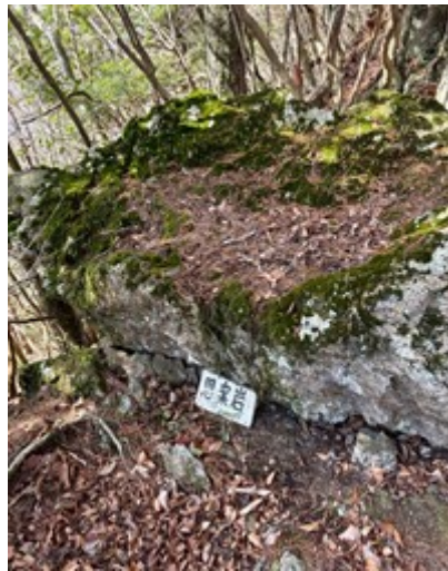
下りにあった 思案岩