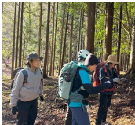
進む方向を考える