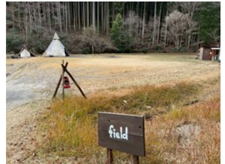
林道を歩くとキャンプ場