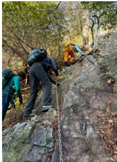
鎖場を頑張って登る