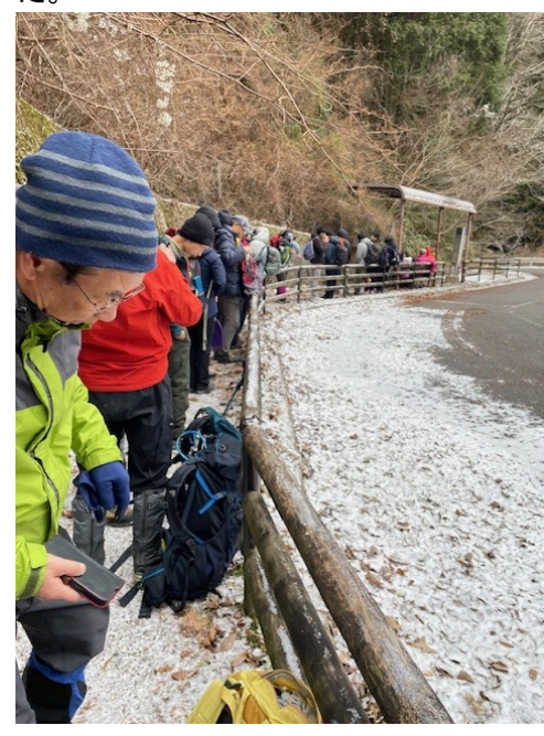
15. 下山後のバス停にて。大変な混雑。