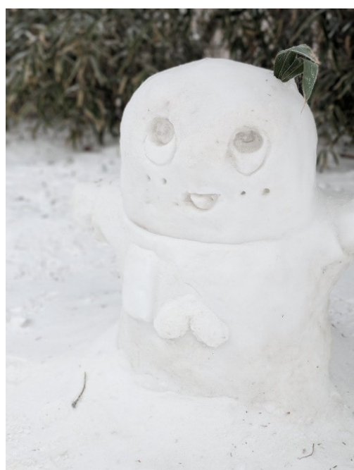
13. SNS で話題のアニメの雪像の一つ。アーティストが毎日登って制作しているとか。