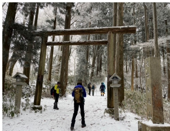
5. 葛木神社一の鳥居通過。