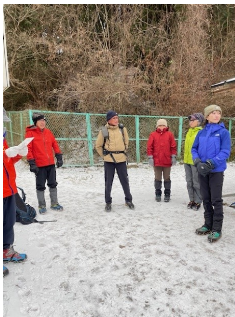
2. アイゼン装着、班分け確認後出発。