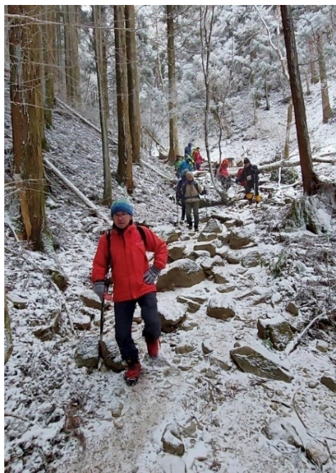
14. 下山風景。「ビールより熱燗が呑みたい」