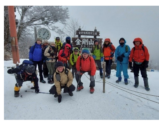
12. 寒い中、優しい方が撮ってくださいました。