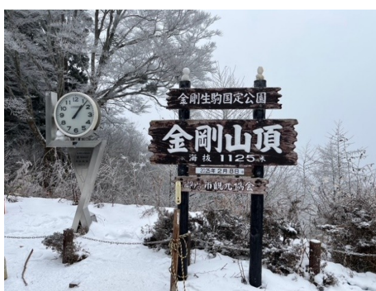
11. 山頂。下界が見えない天候。