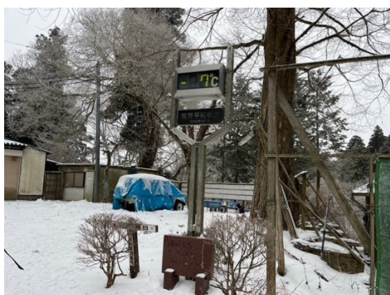
10. 山頂広場の気温はマイナス7度！極寒！