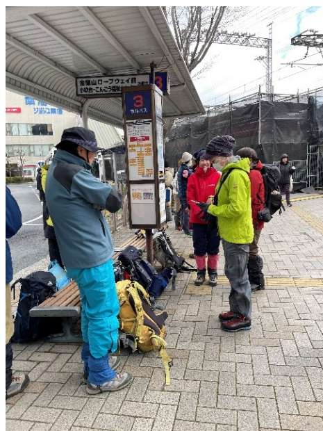
1. 河内長野駅バス停 長蛇の列