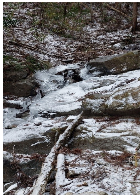
4. 小川が凍っています。