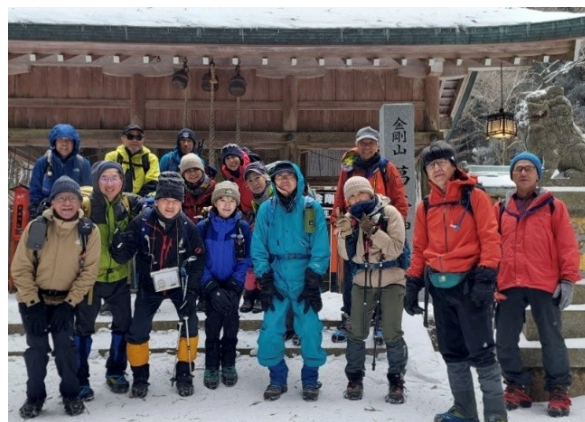
8. 集合写真をパチリ。