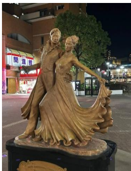
宝塚駅前歌劇像(おまけ)