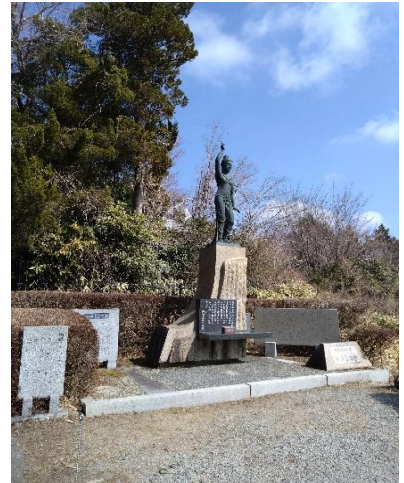
みよし観音横通過