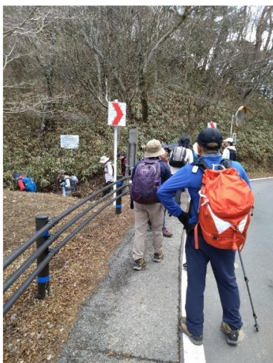
最高峰から東縦走路へ