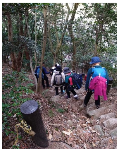
急階段を下り大谷乗越へ