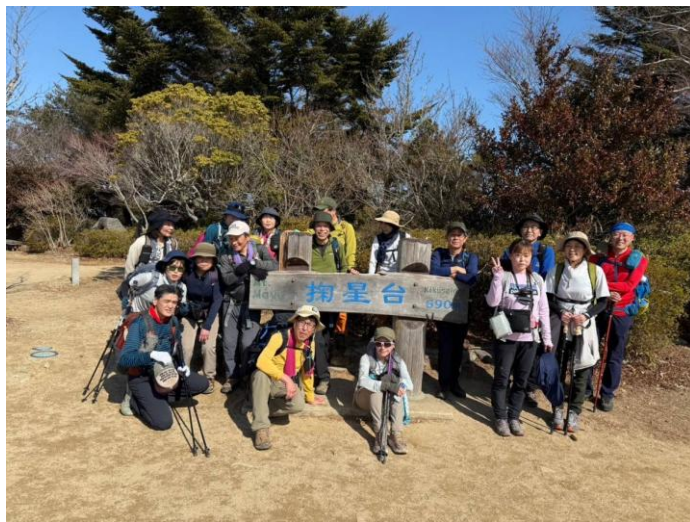
摩耶山掬星台全員集合写真