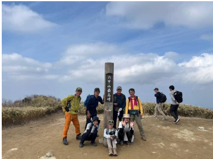
最高峰登頂メンバー