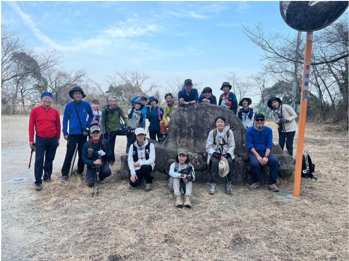
全員記念写真(ゴール地点)