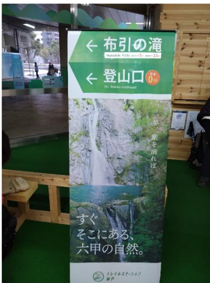
新神戸駅中トレイルステーション (集合・スタート地点)

天気は曇り、気温はこの時期にしては暖かめ。 9日本番の全縦・半縦に向けての先々週の西半縦トレーニングに続き出発。 摩耶山上掬星台では珍しく雲海に覆われた神戸市街を見る。 スタートから順調に進み20名の集団のペースとしてはかなりハイペースのままゴール。 本番ではそれぞれの目標に向け頑張っていたいものです。