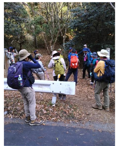
大谷乗越車道横断