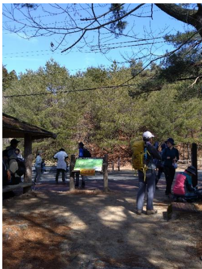
三国池手前車道出会い