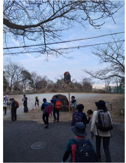
塩尾寺駐車場到着(ゴール)