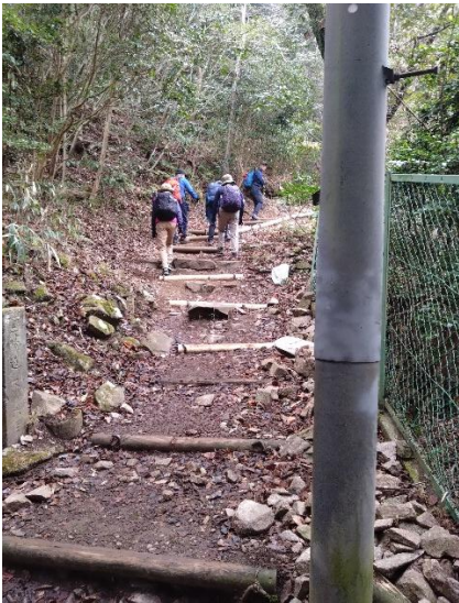
摩耶山に向い天狗道を登り始める