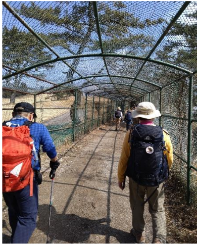
ゴルフ場ネットトンネル通過