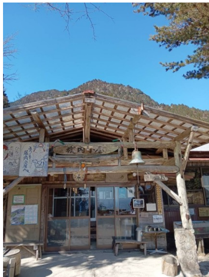
藤内小屋は古き良き山小屋。ファン多し。