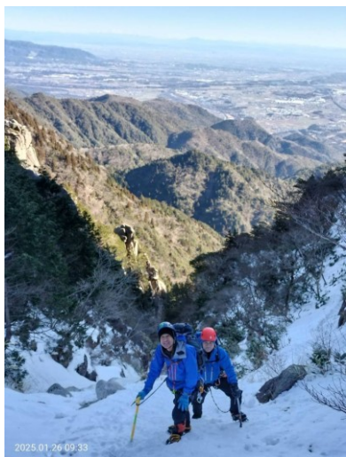
藤内沢を遡行します。なかなかの急斜面と氷。