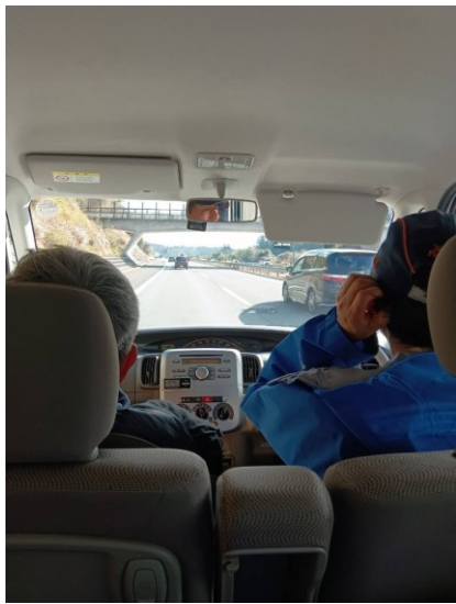
今回はO氏の愛車TANTO号で。ンターボながらよく走ります。

雪山の基本技能習得のために御在所岳藤内沢登攀に行った。心配していた雪や氷も徐々に多くなり有意義な活動ができたと思う。今回は蝙蝠滝は迂回したが次回は攀じりたい。御在所はまずまず近く、また積雪期、無積雪期通じ良いトレーニングの場を提供してくれる。今後も通いたい。(T.N)