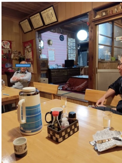
小屋主のK氏とはたいへん話が合いました。(^^)