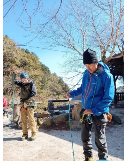
藤内小屋前でロープワーク予習。