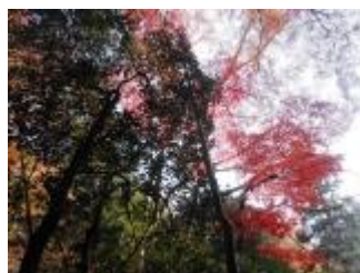
大滝を後にして、駅の方面に向かって進みます。みごとな紅葉が続きます。