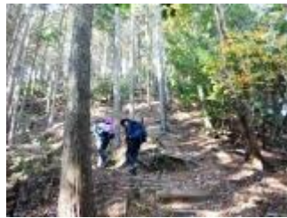
ここから、ちょっと急斜面に。