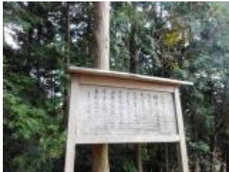
頂上につきました。