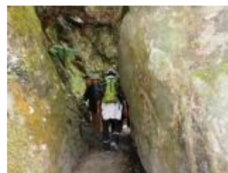
姫岩の間をくぐり抜けます。