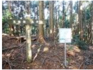
ほどなく分岐点。五月山方面に向かいます。