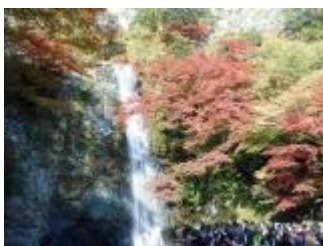
滝の前も人でいっぱい。記念撮影も一苦労でした。でも、さすがにきれい。