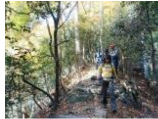
滝に向かってどんどん下ると・・・