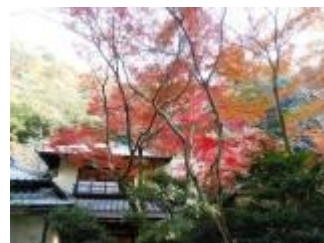
滝安寺の紅葉も見事。 1