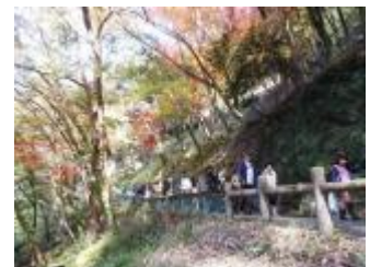
人人人の滝道。進むのも一苦労。