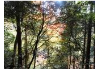
木漏れ日の間から、きれいな紅葉がのぞいています。