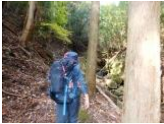
よく整備された溪流沿いの林道を進みます。