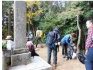
役行者のお墓と仏像が祭られていました。