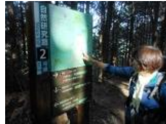
頂上をあとにして、箕面大滝に向かいます。この辺は分岐が多くややこしいのですが、道標がしっかりしているので迷うことはありません。