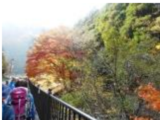
道路の脇を滝道に向かって進みます。道路は大渋滞中。