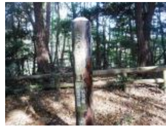
登りきったところがようやく台園地。ベンチがたくさんありました。