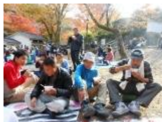
甘くて暖かいぜんざいに、みな大喜び。