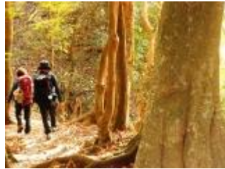
黄金色に染まる登山道。