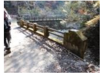
百年橋に出ました。いっきに人が増えました。