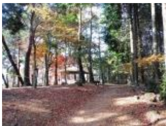
紅葉の先に、きれいな東屋がありました。