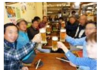
最後は、かいちょ〜が、きれいなおねえさんの呼び込みに負けて、反省会で乾杯！お疲れ様でした〜