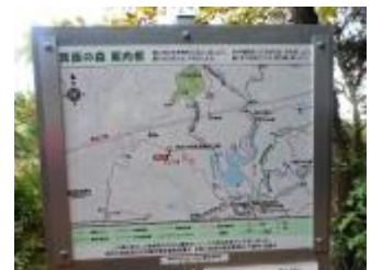
位置を確認して、天上ヶ岳方面へピストン。