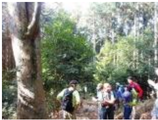
ケヤキの下で、小休止。