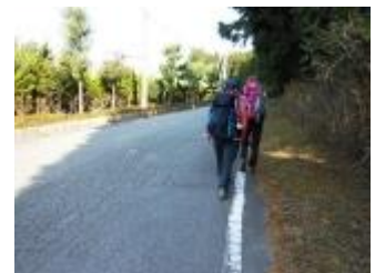
しばらく下って、車道に出ました。