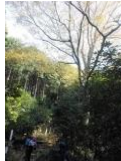
目の前にとても大きな木が見えてきました。