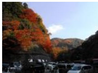
駐車場もご覧のとおり、満車状態。