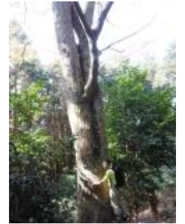
大きなケヤキの木です。