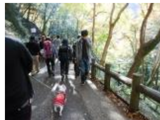
滝道に入りました。犬も一緒に紅葉見物です。