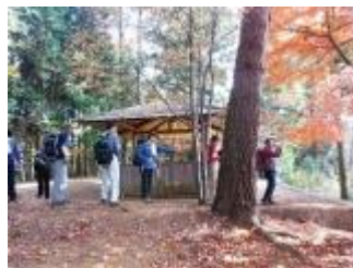
ちょっと早いけど、ここで昼食タイム。昼食のあと、ミニハイキング講座がありました。今日のお題は、「ひざ痛の原因と予防」でした。