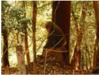
群れからはぐれた大きな猿に遭遇。