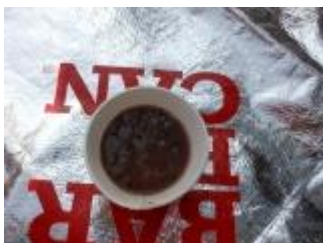
桜広場で、リーダーからぜんざいの振る舞いがありました。