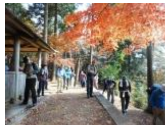
ゆっくりと昼食を済ませた後、本日のピークハント、天上ヶ岳に向かって出発です。