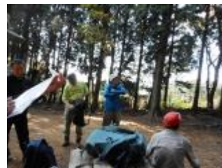
小ピークでしばし休憩。