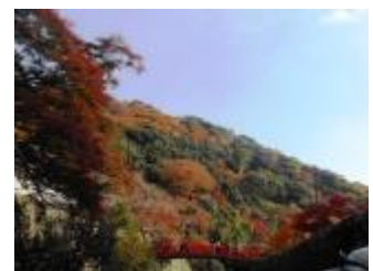
ときどき渋滞しながらも、橋のところまで戻ってきました。