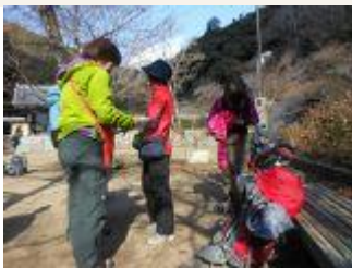
1. いつもの広場で出発準備。今日は、総勢20人。初めて顔を合わせたメンバーも多く、体操と、自己紹介