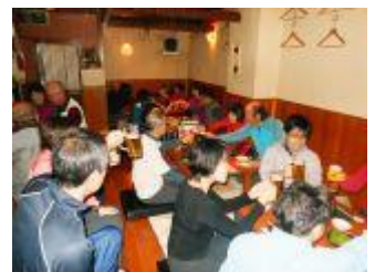
24. 納山会会場で。お疲れ様でした～