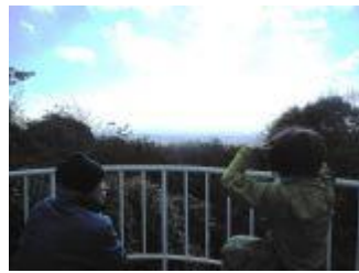
10. 展望台から、遠く大阪の都心部が見えた