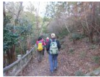
11. 展望台を後にして再び山道へ