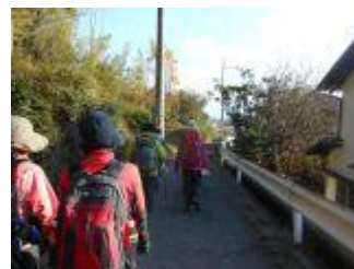
23. 平坦な森を抜けると、いきなり市街地に飛び出した。ここから、宴会場に向かう