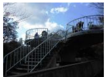
8. 展望台に到着。ここで小休止