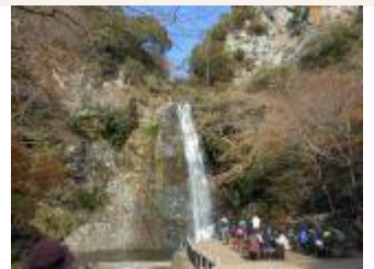
4. 30分ほどで、箕面大滝に到着。紅葉も盛りを過ぎたというのに、結構な賑わい