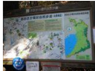
15. 昼食も終わったので、後半のコースを確認。現在位置は東海自然歩道の西の端