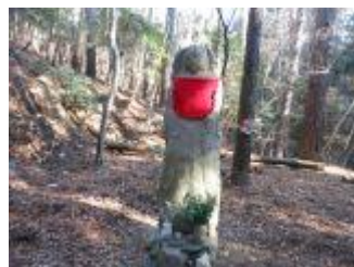
22. しらみ地藏というのだそう。近くには西国札所の勝尾寺がある