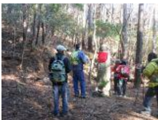
21. 森の中に背の高いお地藏様が