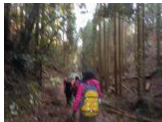
18. 平らな所に出てきた。よく手入れされた植林が続く