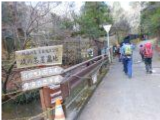
13. お昼休憩の地、政の茶屋園地に到着