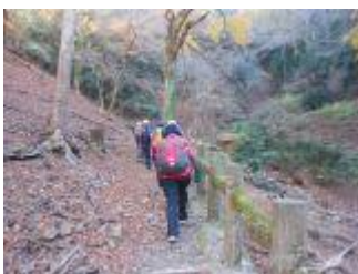
5. 滝を後にして、本格的な山道に入る