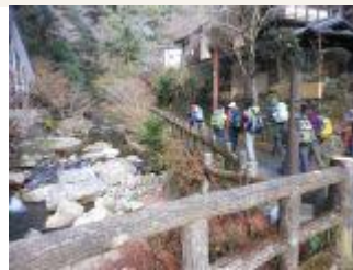
3. 川の横の遊歩道を進む