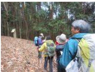
17. 今度は急下降。お腹いっぱい身体にこたえる～