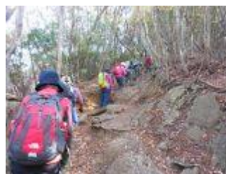
7. けっこうな急登りが続く