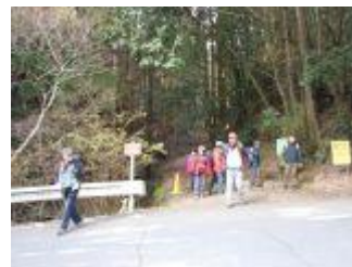
19. また、県道を横断。けっこう車の行き来が激しくて、渡るとき危なかった