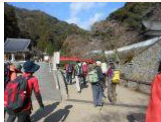
2. いよいよ出発。箕面大滝をめざして