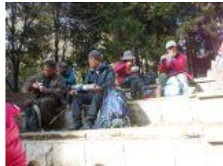
14. ここで昼食休憩。風が冷たい。テルモスの温かい飲み物は、必携