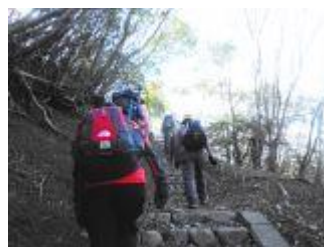
6. 急な階段を上っていく