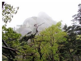
16. ガスの合間に見えた大きな岩