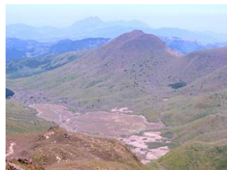
6. はるか下に、今日泊まる法華院温泉がある坊ガツルが見える。