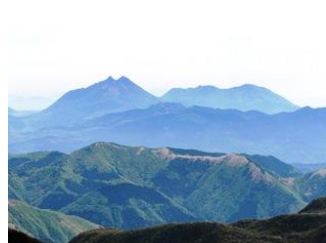
10. かなたに双耳峰の由布岳が。