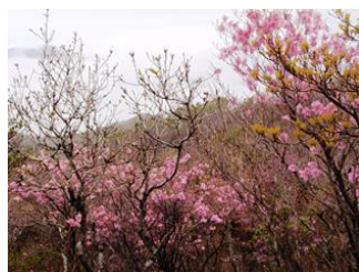
19. 頂上付近は満開でした。