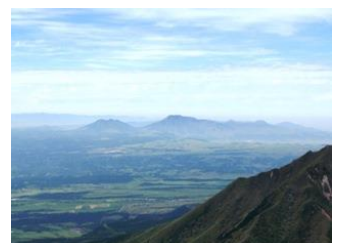
12. 涅槃像にたとえられる阿蘇の外輪山。