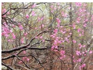
17.ほとんど展望がない中、アケボノツツジに癒されました。