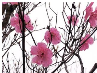
18. なんともかわいいアケボノツツジ