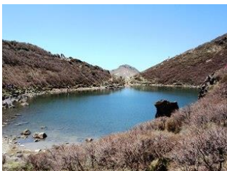
5. 久住山から中岳に向かう途中。水がきれい。