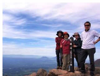
11. 大船山に到着。景色、最高!