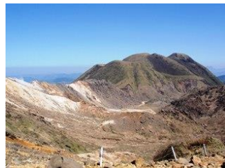
2. 水蒸気を上げている硫黄山と三俣山