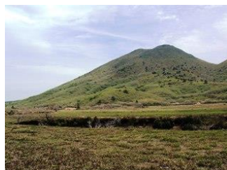
15. 坊ガツルから見た大船山