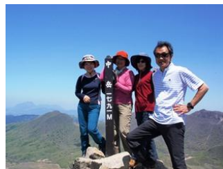
7. 最高峰の中岳に到着。