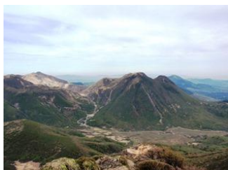
13. 昨日登った久住山や、中岳。