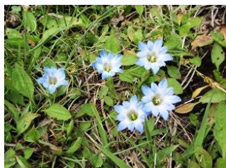
14. 花が少ない坊ガツルにたくさん咲いていた春リンドウ。可愛い