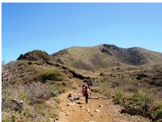
1. 久住山に向け快晴の中のおんびり進んでいく