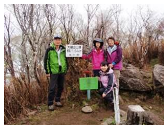
20. 無事到大崩山に着き、ほっと一息。下山もなかなかのものでした。