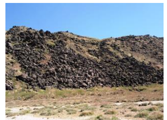
8. 法華院にむかう途中。噴火による大きな岩がごろごろ。