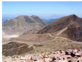
3. 明日登る大船山(右)