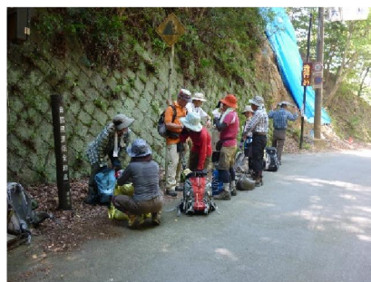
六丁峠にて休憩中