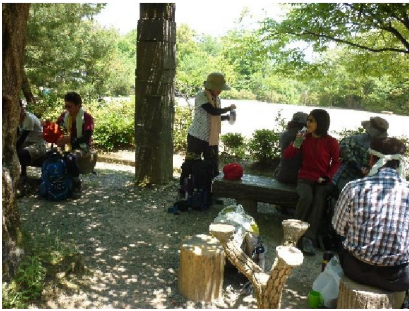
嵐山公園（亀山地区）昼食中