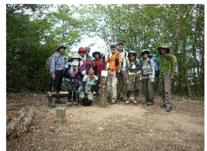
松尾山山頂（275.8m）集合写真