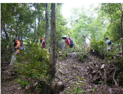
ゴールに向け下山中