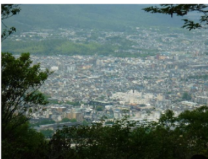
山頂よりの京都市内遠景