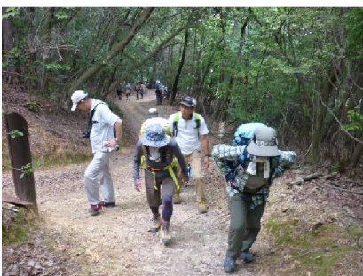
山頂に向け急坂歩行中