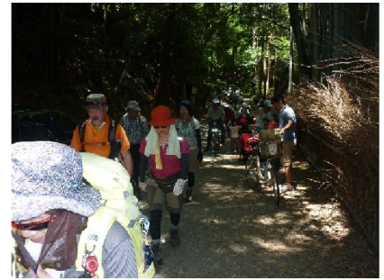
大河内山荘前附近