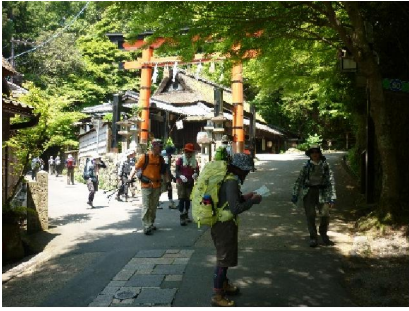
六丁峠より鳥居本まで下る