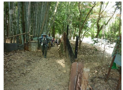
山頂に向け竹林歩行中