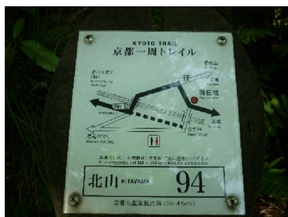
北山コースの最終 94 番標識