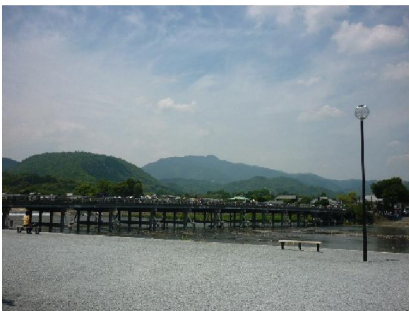
渡月橋越しに愛宕山遠景