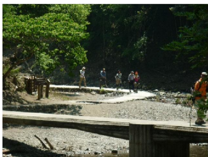
落合手前の清滝川沿い歩行中