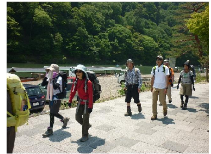
保津川川岸を渡月橋に向かって