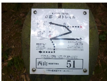
西山コース最終標識 51 番