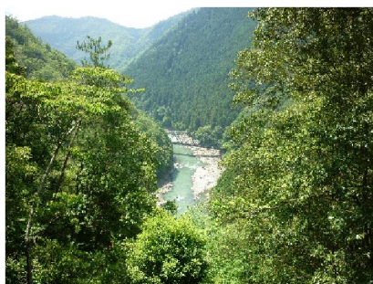
六丁峠手前よりトロッコ鉄橋遠望