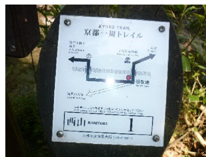
西山コース 1 番標識