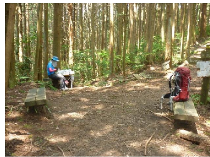
14.→ 西の行者堂 一寸休憩