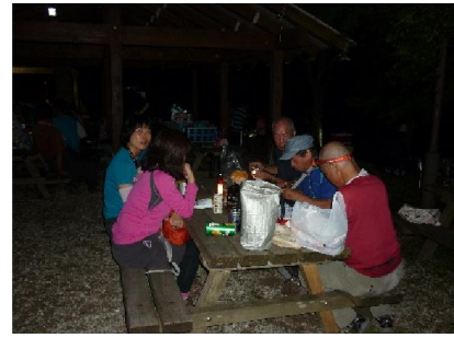
8. 花火見物後の宴会