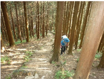
10. 久留野峠からの階段 階段を避けて隣の斜面を登ってま-す