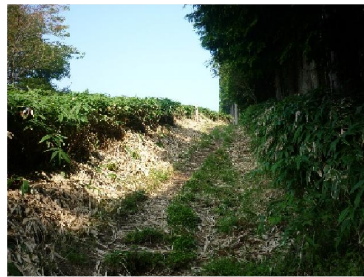
11. 中葛城山頂上付近の笹原