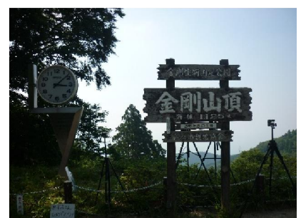
・ 山頂広場 既に場所取りのカメラ脚立数台あり