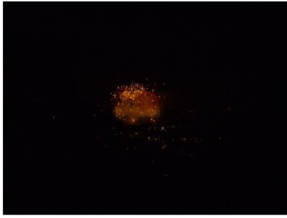
7. デジカメで撮った花火 こんなレベルにしか写りませんネ