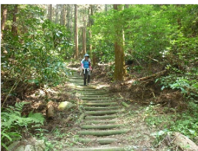
←15. 終盤の長い階段 結構足に来ました