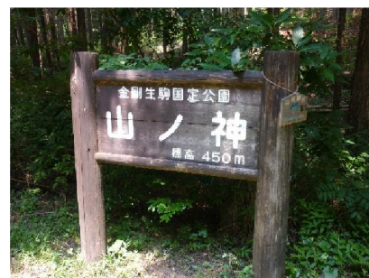
16.→ 山ノ神 ここから紀見峠を経由し ゴールの紀見峠駅へ