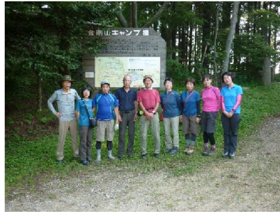
9. キャンプ場での集合写真