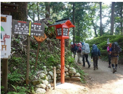
4. 山頂広場からテント場へ