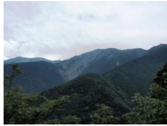
2. 見晴台から荒川三山、赤石岳