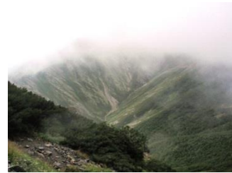
14. 少しガスが切れてきた。