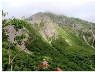
18. たどってきた山が見えてきた。