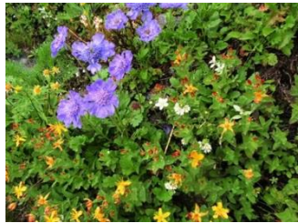
13. 雨の中お花に癒されました。