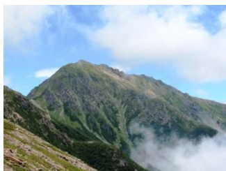
21. 振り返ると荒川岳が