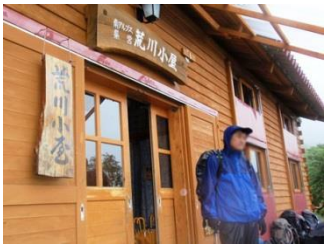
17. 荒川小屋で一服。どの小屋も綺麗で対応が良かったです