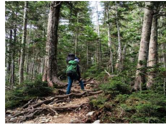
3. 千枚小屋近くまで林が続く。