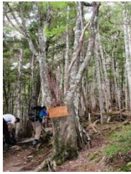
1. 幹回り2mを越えるナナカマドの大木。