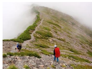
24. ガスが流れる中、小赤石岳を下 っていく。