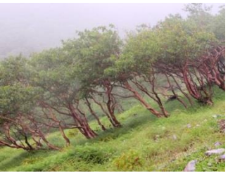
16. ダケカンバがきれい。