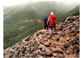
15. 荒川小屋が見えてきた。