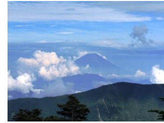
4. 千枚小屋では富士山が迎えてくれた。