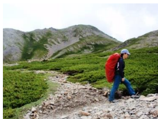
23. 小赤石岳に向かって登って いく。