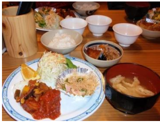
6. ボリューム満点の夕食。