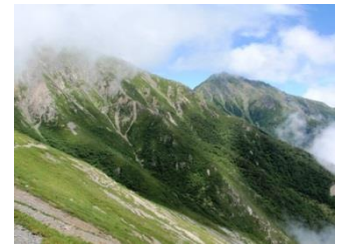
20. 朝は期待していなかった青空も見える。