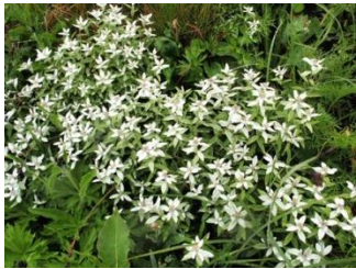
11. お花畑がたくさんありました。