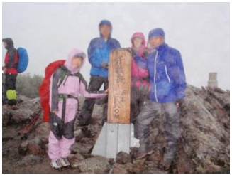
7. 雨の中、千枚岳に到着。