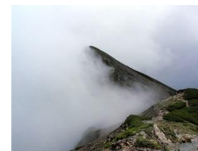
25.一瞬、赤石岳が見えた。