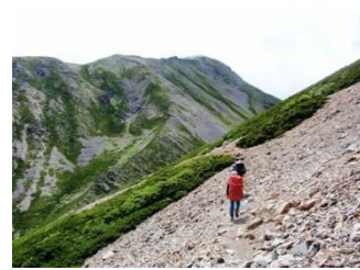
19. 赤石に向かって気持ちのいいトラバース道を進んでゆく。