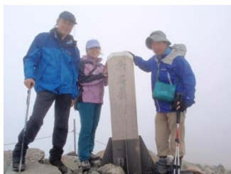
26. 赤石岳に登頂。遠かった～