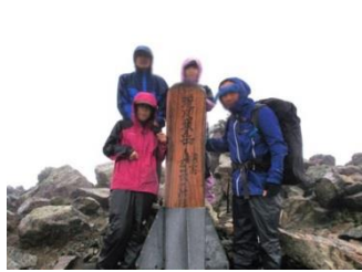
8. 荒川東岳。千枚岳からここまでが雨がいちばんきつかった。