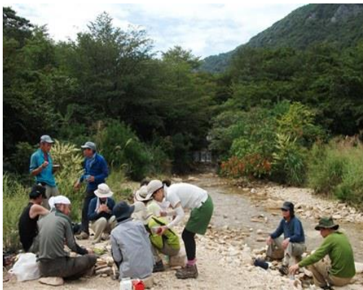
5. あっという間に時間がたってしまった