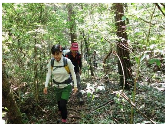
1. 白瀬川源流コースへ