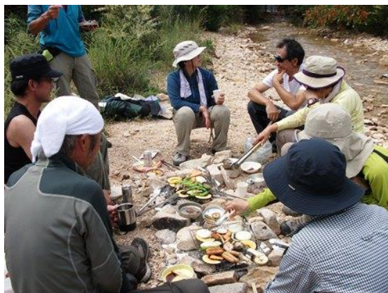
4. BBQを囲んで、語らい合う