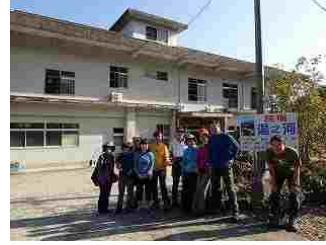
83. 民宿前で、別れを惜しむ人達