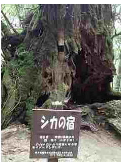
69.小学生が名付けた杉