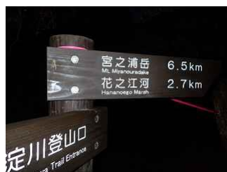
15.6時に宮之浦岳に向けスタート