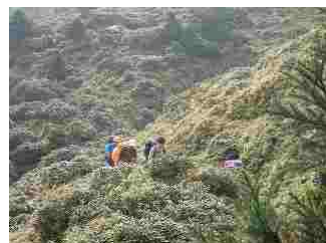
28.屋久笹がいっぱい