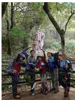
49.千葉からバイクで来た青年と大阪のおばちゃん達