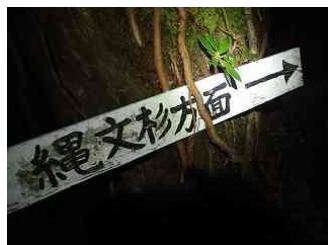
46.縄文杉に向かいます。6時