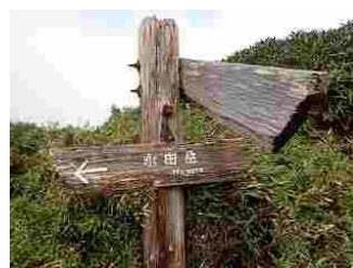
36.荷物をデポして永田岳へ。往復2時間