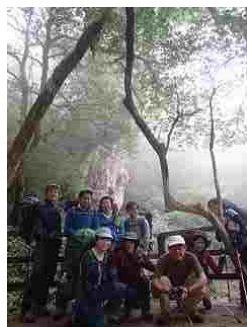
50.待ちに待った縄文杉とご対面