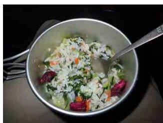
14.朝食の野菜入り雑炊と漬物