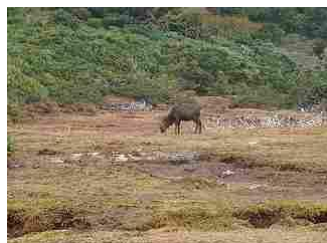
22.湿地帯の中でのんびりとした、屋久鹿