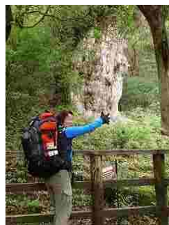
51.朝早かったので、私達だけで縄文杉ひとり占め