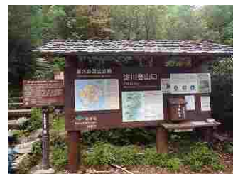
4.淀川登山口で協力金500円を支払い、淀川小屋に向かう