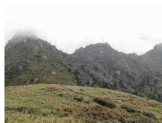
32.右から、投石岳・安房岳・翁岳。