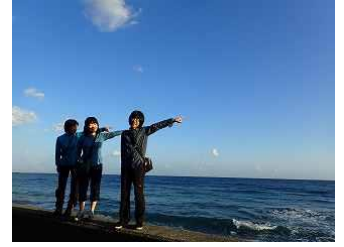
80. 朝の散歩で種子島をさしています。