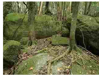
63.根が石を覆っています。