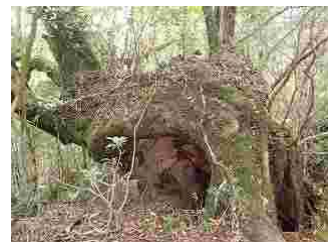
8・見事な苔、伝わりますでしょうか？