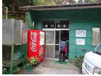
77. 近くの楠川温泉で疲れを落とす。小さな温泉です。