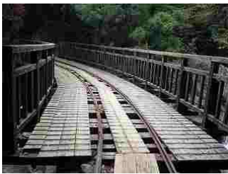
57.大株歩道と別れトロッコ道に入ります。