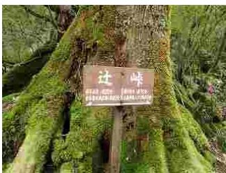
65.登りがきつかった峠。ここから太鼓岩に登ると3月の桜が最高らしいです。