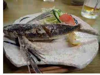
79. トビウオのから揚げ