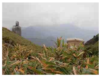
31.環境を保護するためにトイレブースがあります。