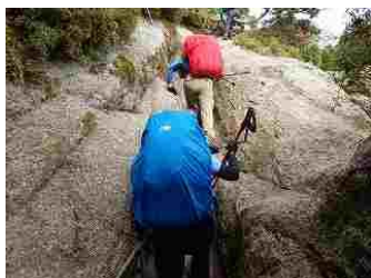
25.細い岩の間を登りました。