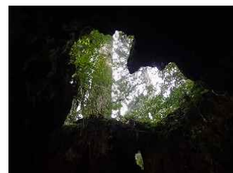
56.ウイルソン株の中から空を見上げるとハートに見えます。