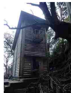
48.新しくなった高塚小屋。