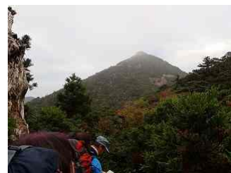
20.展望所から見た高盤岳