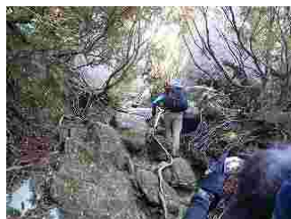
43.疲れてからの岩場はこたえます。