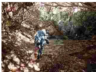
41.石楠花の森を下って行きます。