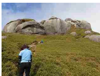
37.屋久笹道の前の巨岩