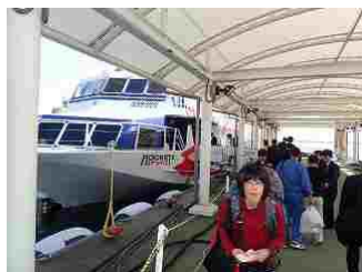
2.高速船ロケットで屋久島に