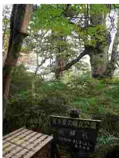
53.夫婦杉・仲良く手をつないでますよ。