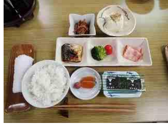
82. 朝食。後お味噌汁があります。