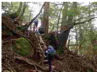
5.平成9年に整備された階段です。