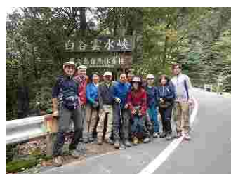
74.偶然岡さんと出会う。