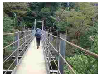
70.さつき橋を渡ります。