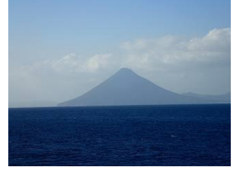
84. フェリーから見た開聞岳