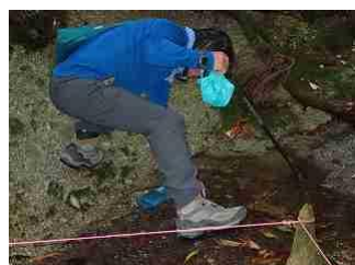
11.水を汲んでいます。