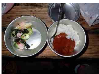
13.夕食メニュー、デミグラスハンバーグ丼と海藻サラダ