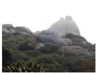
30.頂上が岩2つの翁岳