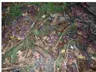
17.張り出した根っこ