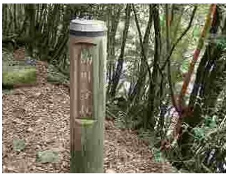
61.トロッコ道と分かれ楠川歩道に入ります。