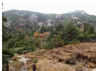
26.投石湿原からの黒味岳