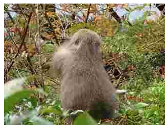
19.美味しそうに食べる屋久猿