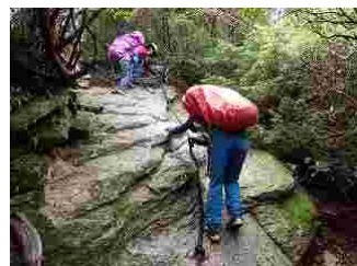
24.こんな岩場もありました。