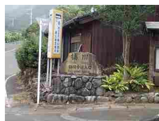
75.バスに乗ってしまったが、楠川歩道に下りる予定でした。