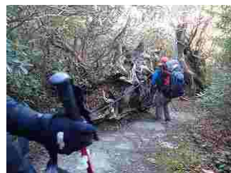
44.ロープがありましたが、滑りました！