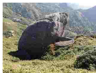
40.これも何かに見えませんか？