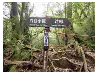
67.白谷雲水狭苔むすの森