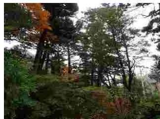
7.紅葉もしています。