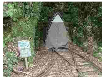
58.これもトイレブースです。