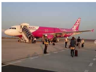
1.7時05分のピーチで鹿児島まで