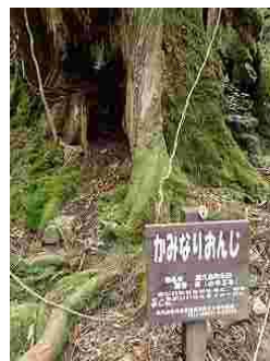
66.小学生が名付けた杉