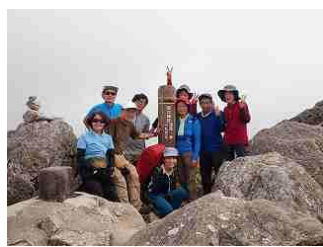
35.宮之浦岳、360度の展望