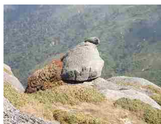
39.丘にあがったアザラシ？にみえたのですが・・・