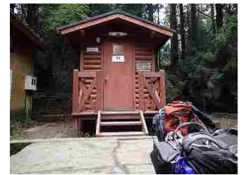
60.小林製薬寄贈のバイオトイレ・左のトイレは阪急交通社寄贈