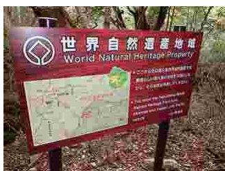
9.この辺りから世界自然遺産地域になります。