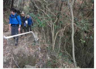
16. 切れ立ったゴルジュ帯の上を進む。