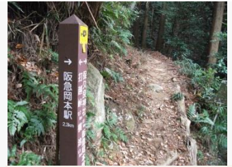
12. 岡本駅まであと 2.5 キロ。