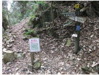
11. 水平管理道は崖崩れで通行止め。六甲山は、まだまだ通れない箇所がたくさんある。