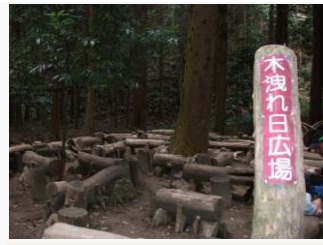
10. 途中の広場も、山頂を手入れしている方が、作ってくださったもの。