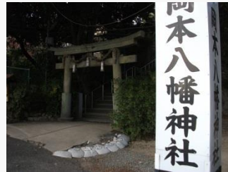
18. 岡本八幡神社前を通過。このあと、納山会場へ。