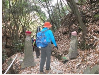
15. かわいいお地藏様の門。