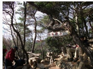
8. 山頂休憩所。いつもきれいに手入れされている