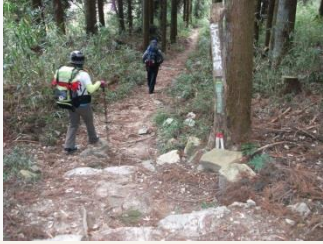
13. このへんは分岐が多い。リーダーの的確な指示で迷わず進む。