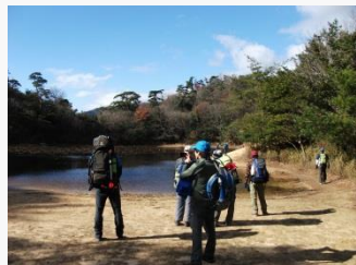
5. 横池到着。ここで昼食休憩