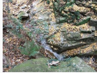
14. 八幡谷を進む。深い溪谷が続く。