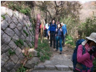
17. 八幡谷の入り口へ。