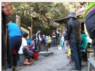
2. 滝の茶屋前。今日もにぎわっている。