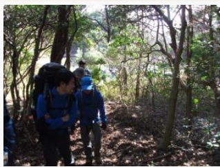
6. 昼食後、打越峠から七兵衛山に向かう。