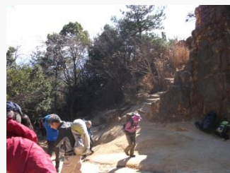
4. 風吹岩到着。暖かい。