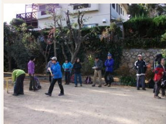
1. 阪急芦屋川から、芦屋川公園へ。総勢30名の参加者でにぎわう。