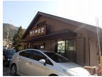
58.時間調整で寄った、かどや食堂