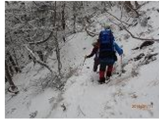
51.Fさん以外アイゼンを付けてます。