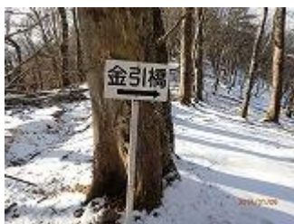
13.金引き橋の分岐今回はここから頂仙岳を巻いて行きます。