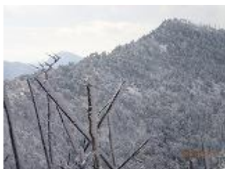
29.奥宮からみた八経ヶ岳