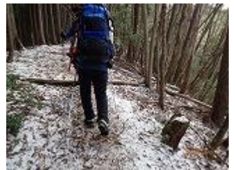
4.樹林帯を登って行きます。