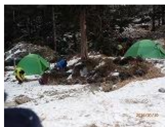
19.右が男性、左が女性用テント