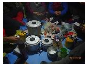
16.夕食の準備。蟹鍋&雑炊