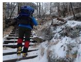
20.朝一は階段からです。