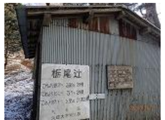
8.栃尾辻の避難小屋ですが、最近は使ってないようです。