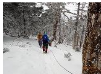
40.弥山辻からコンパスを見 ながら