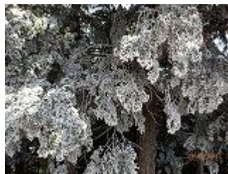
7.大きな木はこんな感じです。