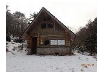
48.ゆっくり休んだ避難小屋。