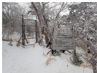
34.オオヤマレンゲを鹿から 守るための柵とネット