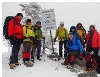
35.八経ヶ岳でパート1