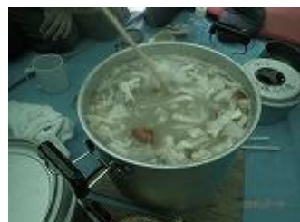
44.豚汁+カレーうどん