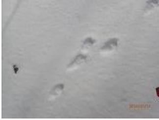
53.ウサギの足跡です