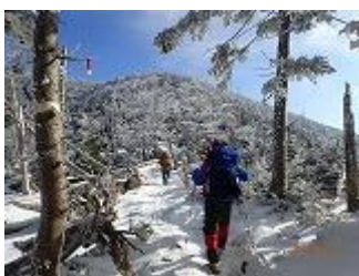
22.雪山らしくなって来ました。