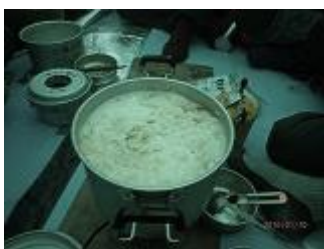
18. 朝食の蟹みそラーメン