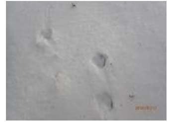
52.可愛い鹿の足跡です。