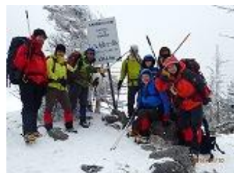
36. 八経ヶ岳でパート2