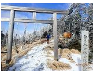
26.天河奥宮。雪の多いときは鳥居もうまるそうです。