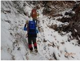
49.来た道を帰ります。