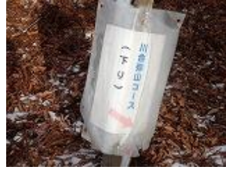
54.杉尾辻まで下って来ました。ここからは来た道を降ります。