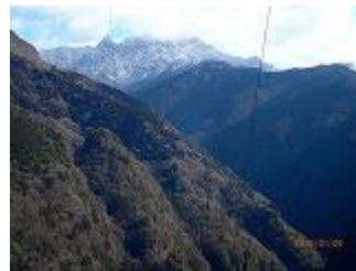
3.第一鉄塔からみた左が稲村ヶ岳と右が大普賢岳