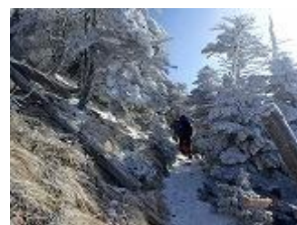
24.もうすぐ弥山です。