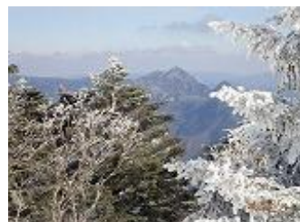
32.弥山から見た大普賢