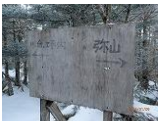
14.高崎横手出合。ここから狼平に下ります。