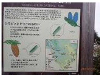
41.日裏山でシラピソとトウ ヒの違いを習う。