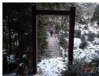
15.吊橋を渡りテント場へ