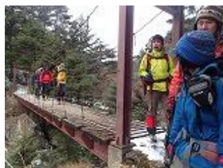
42.橋を渡りテント場に帰っ て来ました。