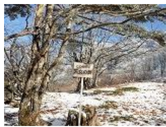
10.天女の舞。この辺りから雪山らしくなって来ました。