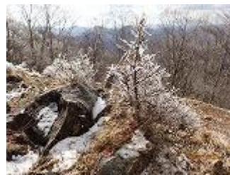
6.林道脇の小さな木にも樹氷です。