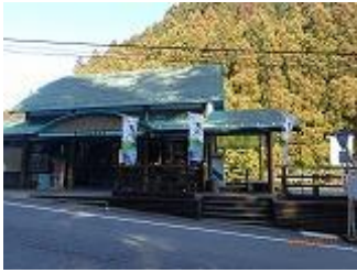
57.天川川合のバス停