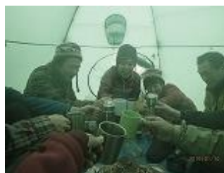
43.お疲れさまでした。今日は 女性とNさんは避難小屋で寝 ます。