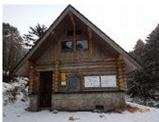
17.狼平避難小屋9日は満員だったようです。