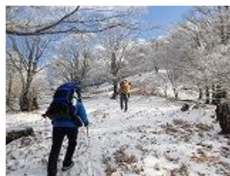
11.頑張ってるってます。