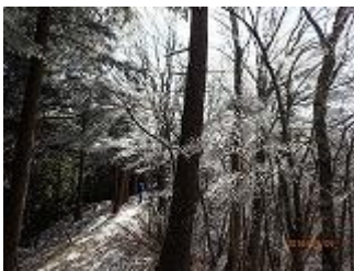
5.樹氷が綺麗でした。