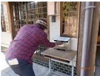
1.天川川合で登山届け