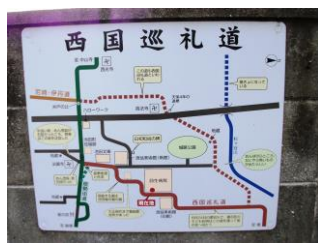
19.このあと、西国巡礼道を通って阪急池田駅へ。