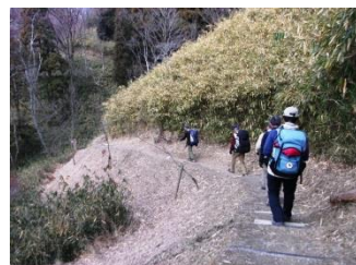
12. 都会の公園とは思えないような、広々とした高原を進む。