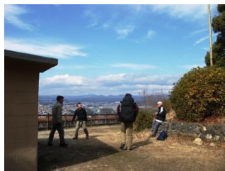
14. 五月台園地に到着。なんと、H氏と出会う?!