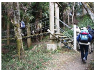
13.ちょっとスリリングな吊り橋を渡る。