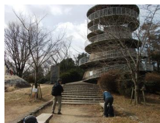
8.ほどなく日の丸展望台に到着。