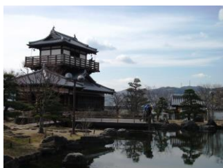
17.復元された城跡と、園庭は、市民の憩いの場所のよう