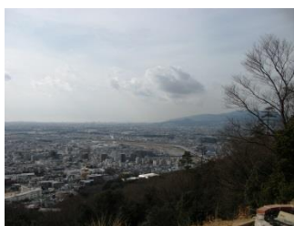
5.途中のがんがら祭りの火床のある展望台から甲山が見えた