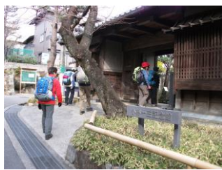
18.小林一三記念館をちょっと覗き見