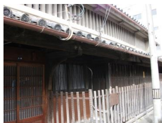
2.歴史ある清酒の町並み