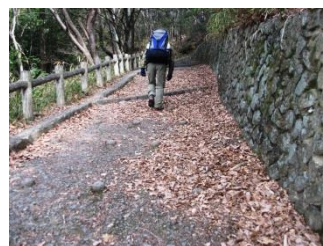
4.登山道に入ると急登が...