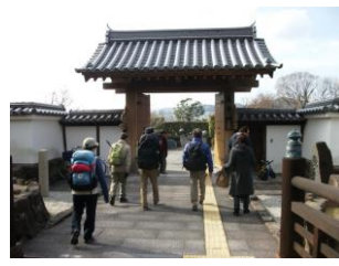
16.昼食後は、池田城跡へ。