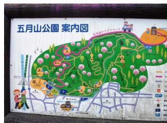
10.結構広い、五月山公園。