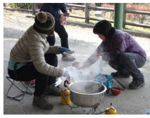
15. U氏・O氏渾身の豚汁に皆、大喜び。材料や大なべの歩荷、お疲れ様でした。