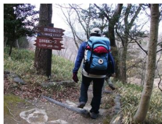
11. 五月山高原コースに入る