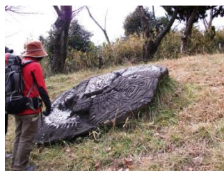
3.五月山公園の謎の石板?!