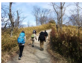
7.なだらかな高原に出た。