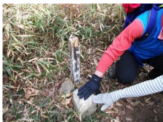
9.展望台の裏にひっそりと三角点があった