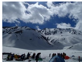
15.2日目、明け方までの暴風雨が去り、青空が出てきた