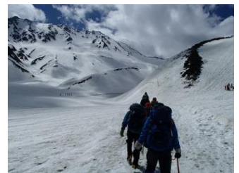
16.天候の回復を待って雷鳥沢を出発