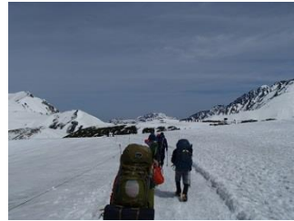
7.雷鳥沢に向けて出発！