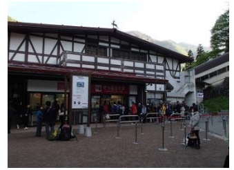
4.立山駅で室堂行の直通バスに乗換