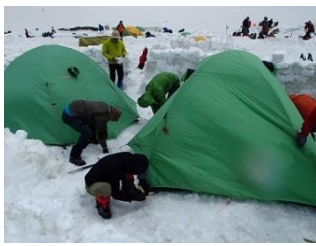
10.テント組は雷鳥沢でテント設営