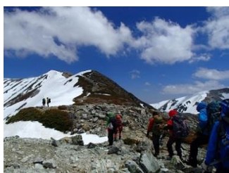
25.アイゼンを外して別山へ登ることに