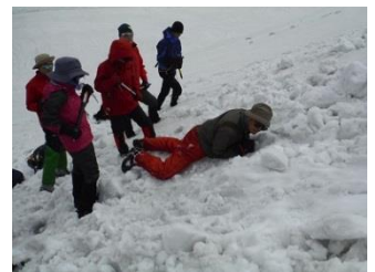
12.滑落停止のお手本