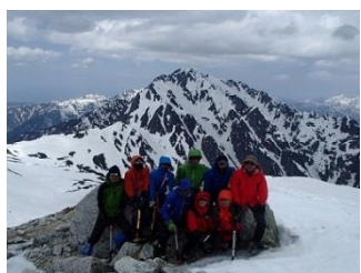
30.別山北峰で記念撮影。この後、暴風が吹き荒れる…