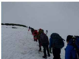
17.まずは剣御前を目指して登っていく