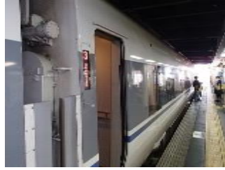
38.サンダーバードで大阪へ