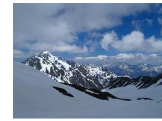
24.劔岳・後立山連峰が姿を現した!