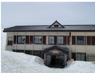
9.小屋組は雷鳥荘へ