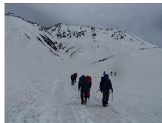
11.1日目は強風で登山中止、雪上訓練へ