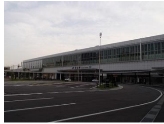
2.早朝、富山駅に到着