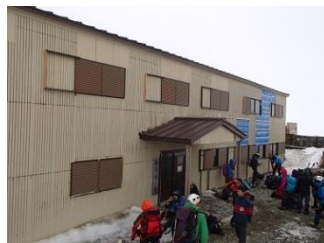
23.剣御前小屋に到着