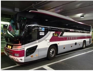
1.梅田から高速バス