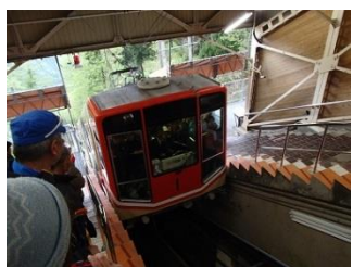
34.最終日はケーブルに乗った