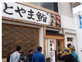
35.富山で美味しいお寿司を堪能