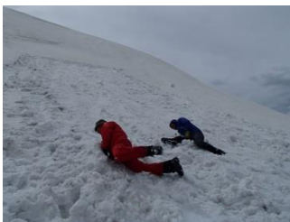
13.滑落停止訓練を何度も繰り返す