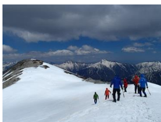
29.ピッケルだけ持って別山北峰へ