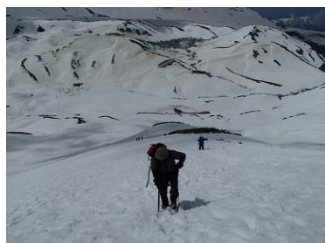
18.雷鳥沢のテント場が遥か下に