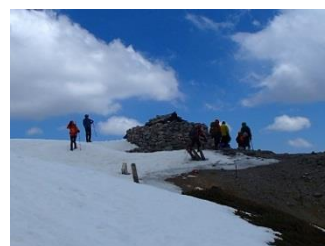
28.別山に到着。風が強い!