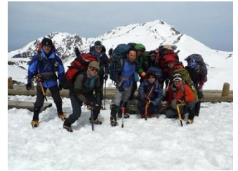
8.途中のエンマ台で記念撮影