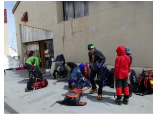
6.室堂に到着して、早速アイゼン装着