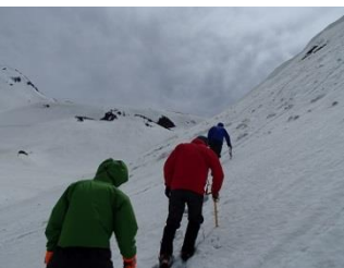
14.急斜面で雪上歩行の練習