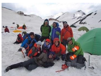
33.無事に雷鳥沢へ帰ってきた