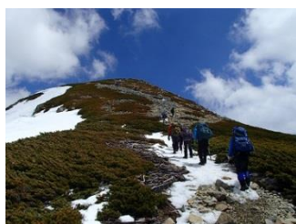
26.まるで夏山のように