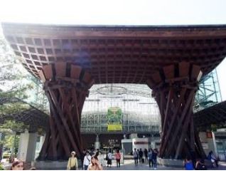
37.各々金沢でお茶したり、観 光したり…