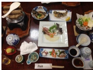
21.民宿の夕食は超豪華！オコゼが美味！