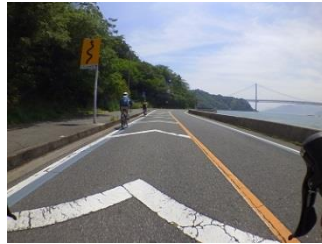
7.因島大橋が見えてきた