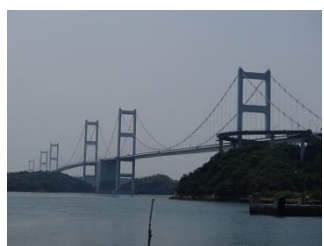
31.しまなみ海道最後の橋は来島海峡大橋