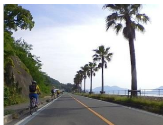
15.海沿いの道が気持ちいい