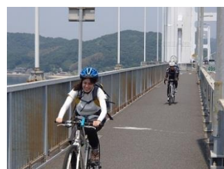
32.長い橋を渡り切ると、いよいよ四国・今治へ