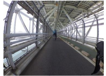
8.因島大橋は車道の下を走る