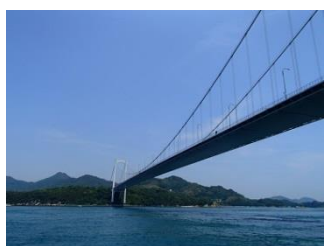
30.伯方・大島大橋を渡って大島に