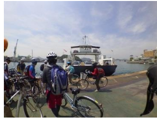
2.尾道から向島へは渡船で渡る