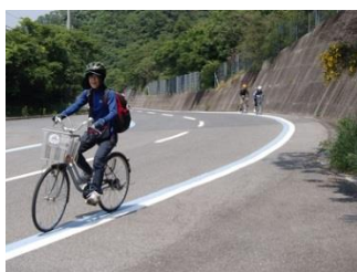
25.ママチャリで坂道を頑張って登っています