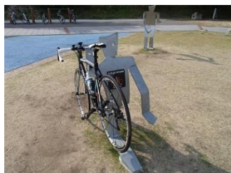
18.アートなサイクルスタンド