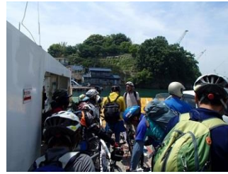
3.一瞬で向島が目の前に