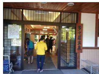
20.多々羅温泉で汗を流す