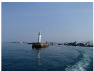
37.今治港から船に乗って三原 に向かう