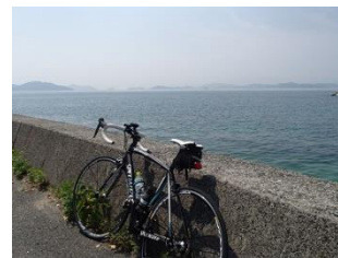
24.瀬戸内の多島美を眺めながら大三島外周道路を走る