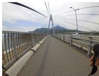
11.生口橋を渡って生口島へ