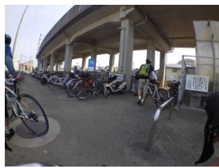
35.レンタル自転車を返却