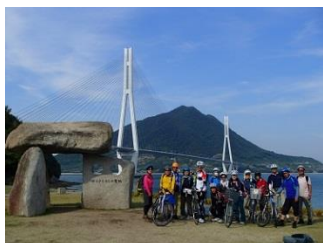
17.多々羅大橋をバックに記念撮影