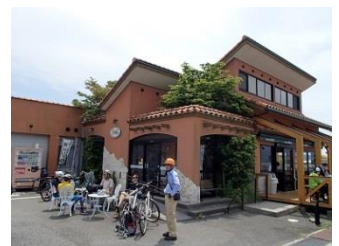
12.サイクリストが集まる有名店「ドルチェ瀬戸田本店」