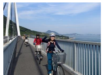
16.多々羅大橋を渡って大三島へ