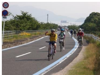
22.2日目も朝からいい天気