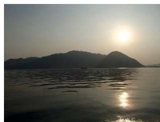
38.瀬戸内海の夕暮れ