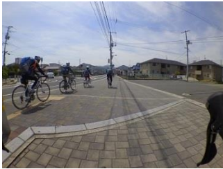
5.一列になって走る