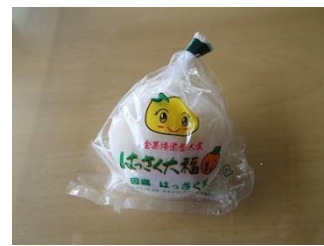
10.名物「はっさく屋のはっさく大福」旨い！