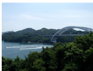
26.坂が多く長かった大三島外周も終わり、大三島橋を渡って伯方島へ