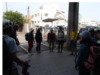
36 しまなみ海道走破お疲れ様 でした