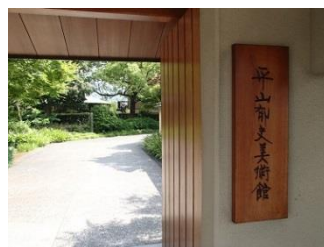
14.平山郁夫美術館で絵画鑑賞