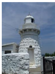
9.因島の大浜崎灯台