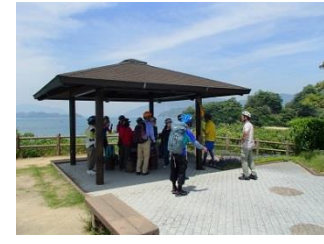
6.眺めのいい所で休憩