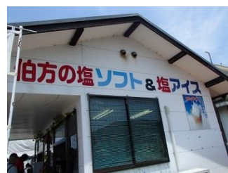
28.は・か・た・の・塩っ！