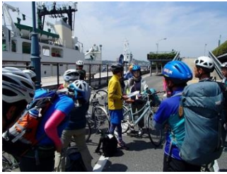
1.尾道からスタート