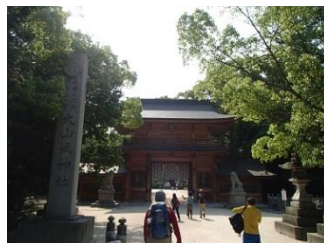
23.大山祇神社を参拝