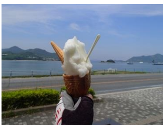
13.ドルチェのジェラート旨い！