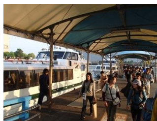
39.無事に三原港に着きまし た