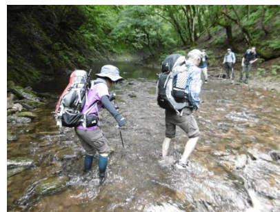
⑨ いよいよ沢登り開始