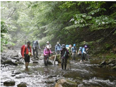
⑰ 登山口に向け下流へ