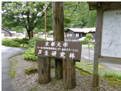
② 京都大学芦生研究林看板