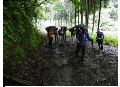
⑲ 登山口に向け下山