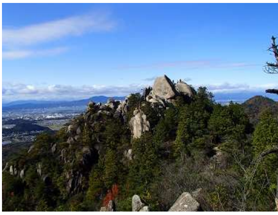
25. さっき登った天狗岩を振り返る