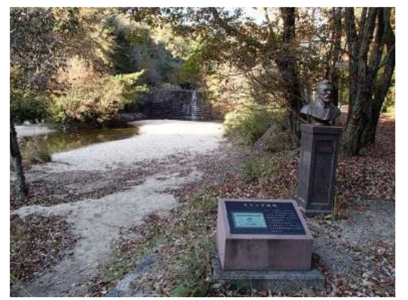
33. オランダ堰堤を通過