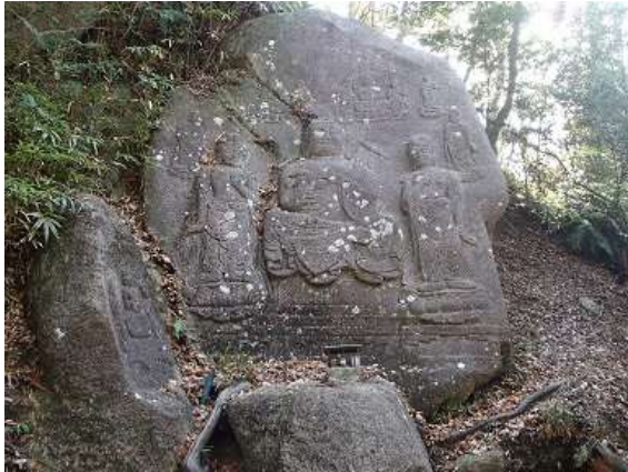
31. 奈良時代の作と言われる狛坂磨崖仏