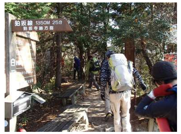
27. 白石峰から竜王山ピストン