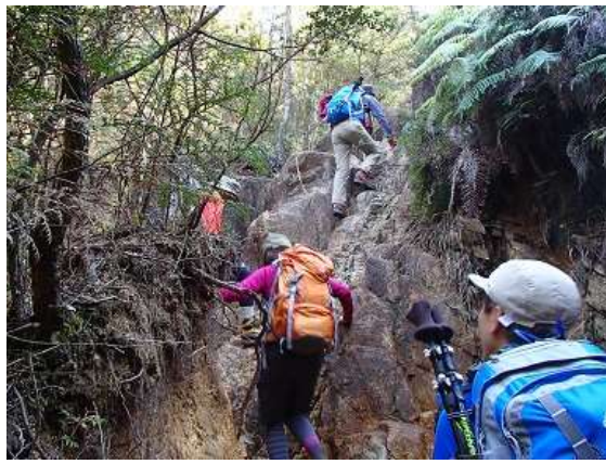
20.アスレチックのよう part II