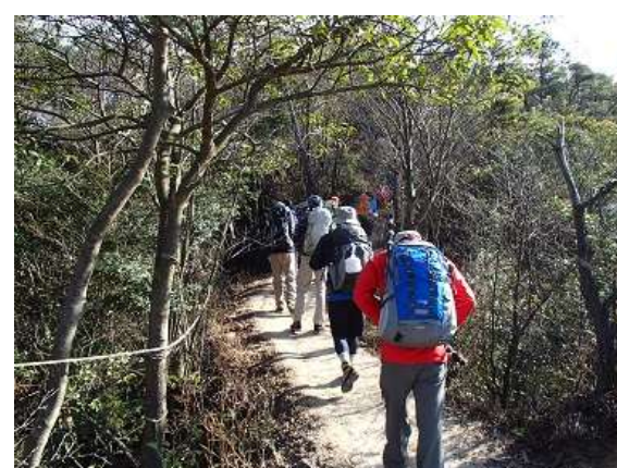
24.昼食後は竜王山を目指す