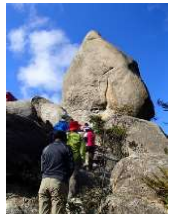
21.皆で天狗岩クライミング