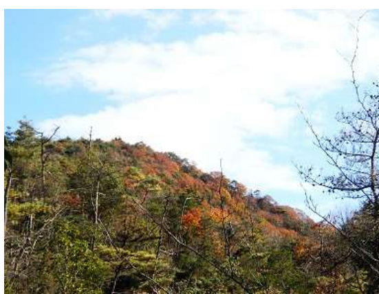
8.紅葉に彩られた山