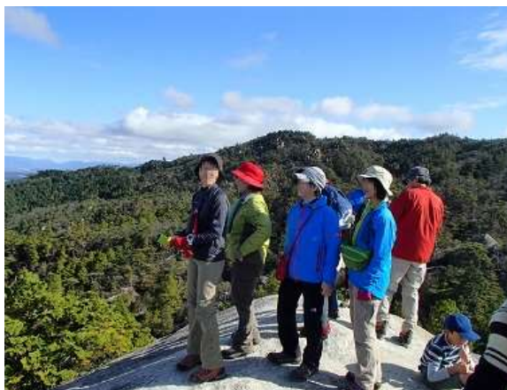
22.天狗岩の上から絶景を楽しむ