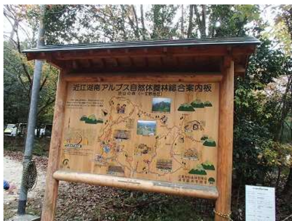
1.上桐生バス停近くの登山口に到着

風がやや強くて少し肌寒かったですが、天候に恵まれ気持ちの良い山行が出来ました。稜線や天狗岩の上からは琵琶湖や遠くの山々の壮大な景色が楽しめました。登山道はバリエーションに富んでいて最後まで飽きることは無く、楽しい山行となりました。帰りに JR 草津駅前の居酒屋に立ち寄り、皆で美味しい料理と生ビールを堪能して大満足の1日となりました。