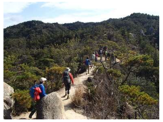
18.眺望が楽しめる稜線歩き