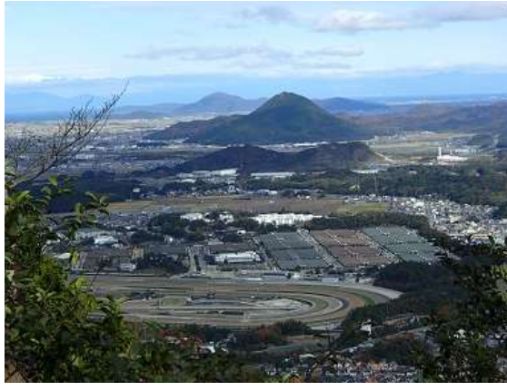
14.三上山と JRA 栗東トレセン