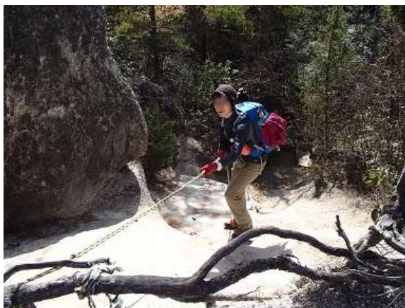
19.アスレチックのよう