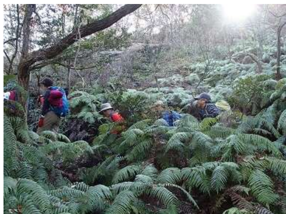
7.シダが生い茂る中を進む