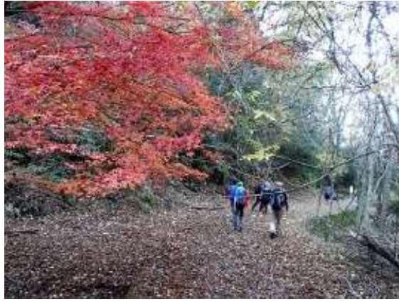
32. 落ち葉の積もった林道歩き