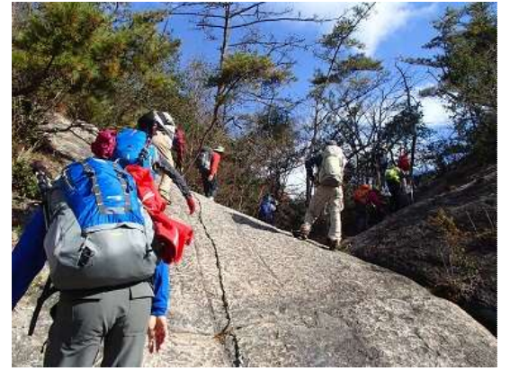
12.ちょっとした岩登りも