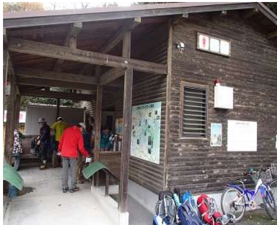
2.登山口駐車場のトイレで登山届を提出