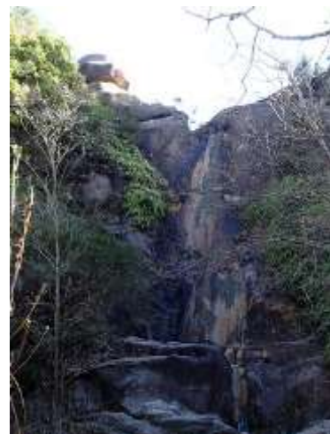
9.落ヶ滝に立ち寄った