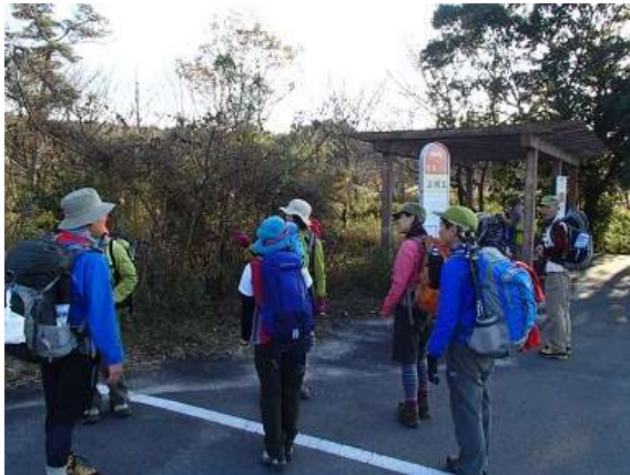
34. 無事にバス停へと戻ってきました