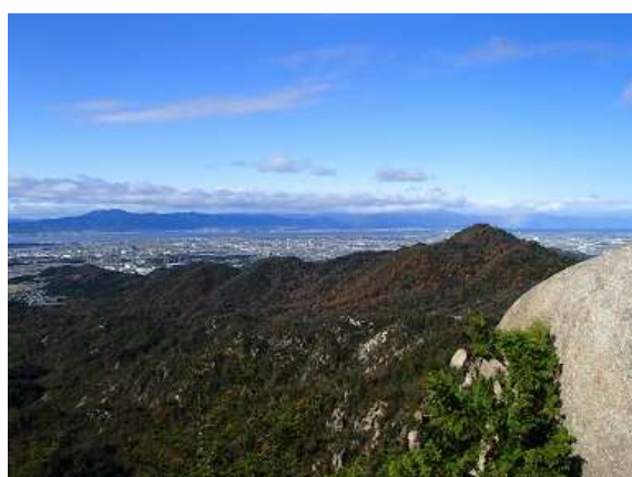
23.琵琶湖と虹が見えました