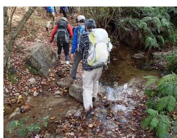
6.小さな渡渉もあり