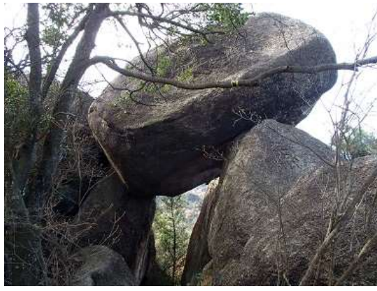
17.どうやってこうなったのか？