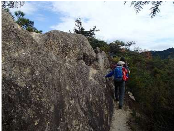
16.稜線には大きな岩が沢山あった