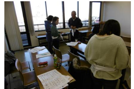
三角巾の本結び実践