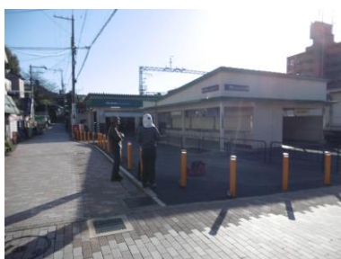
① 後発組を後に清荒神駅を出発