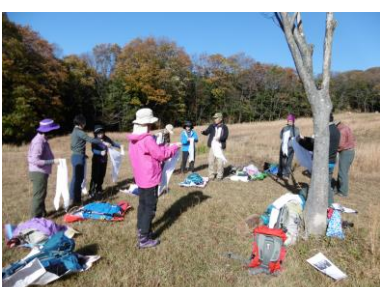
⑤ 作り方と本結び等基本