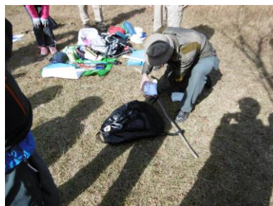
23 枝とザックで作成