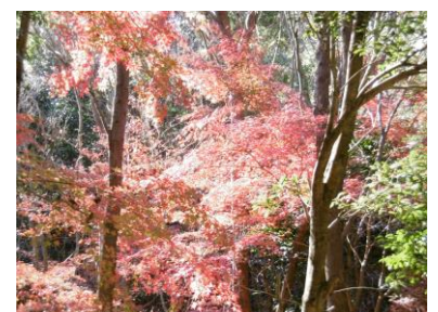
④ 登山道を彩る紅葉