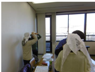
三角巾の使用方法 頭