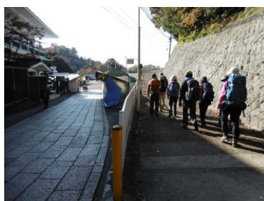
② 清荒神参道より登山道へ