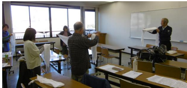
空中での三角巾の作り方の練習