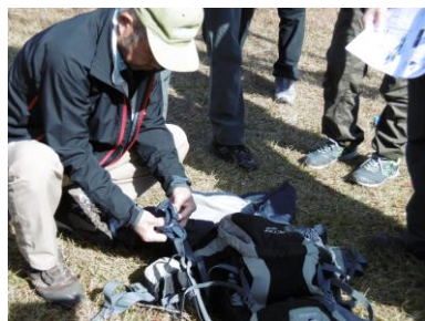
17 雨具とザックで作成