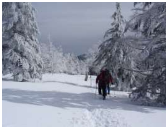
5. 乾いた雪で快適に進みます