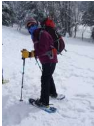
2. 歩き出してすぐにスノーシューをつける