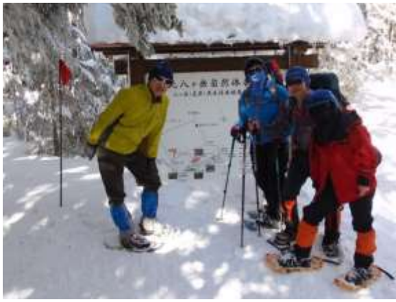
10. 男性2人と謎の覆面女性2人