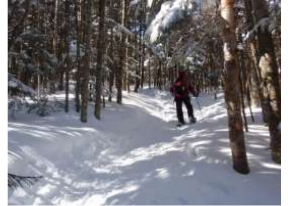
30. 雨池峠まで今回最大の登り