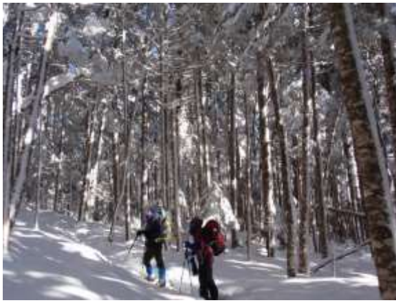
25. 茶臼山、縞枯山の裾を巻いて樹林帯を行く