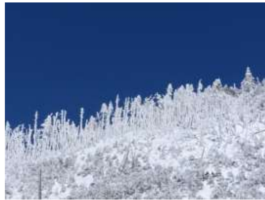
35. 見上げた稜線で青空にはえる樹氷