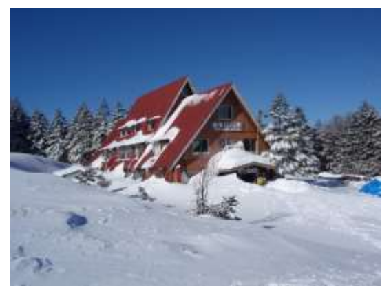
24. 赤い三角屋根がかわいい麦草ヒュッテ