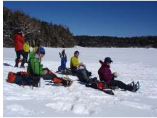
29. 湖畔でくつろいでいます