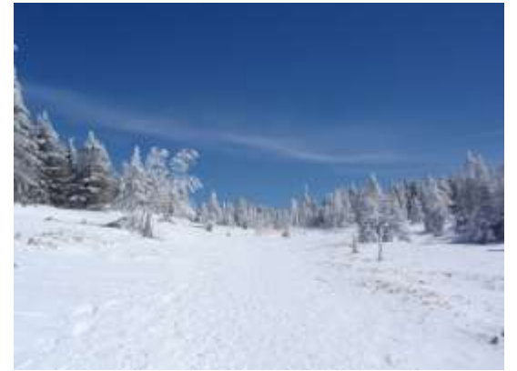
33. 雨池峠方面を振り返る