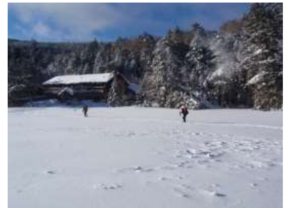
21. 翌19日凍った白駒池を横断