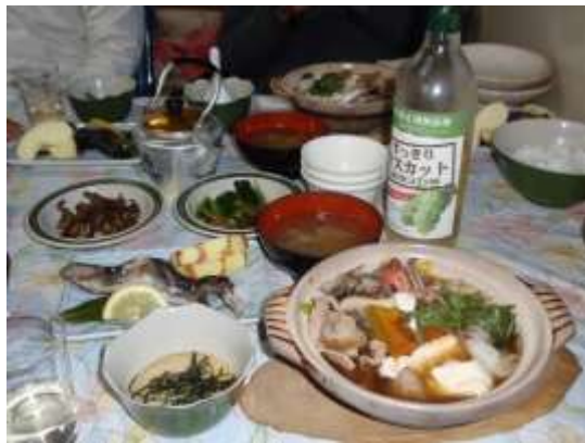
20. 食べきれないほどのご馳走