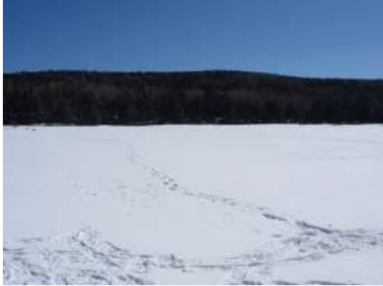
28. 完全に凍っている雨池