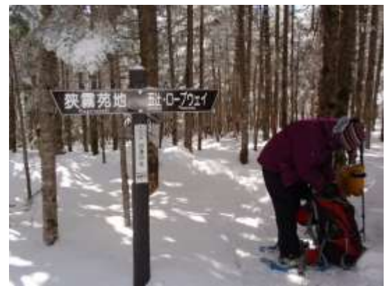
9. 出逢いの辻で休憩