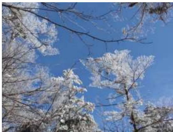
8. 見上げると青空と樹氷が綺麗でした