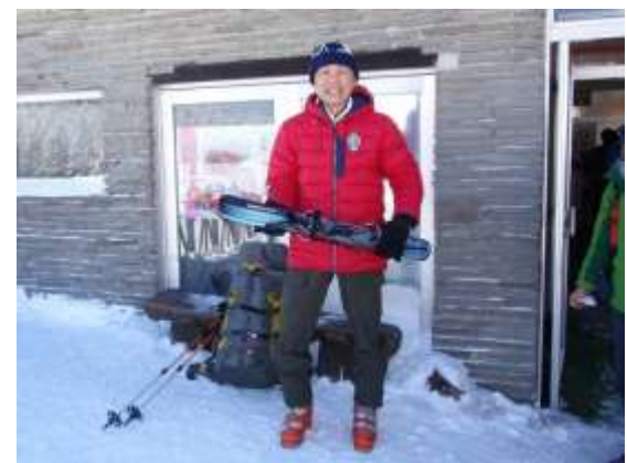
39. Nさんはスキーで下山。ロープウェイとどっちが早いでしょう？