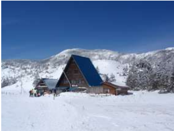
34. 青い三角屋根が印象的な縞枯山荘