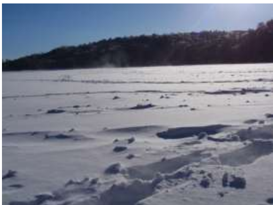
22. 強い風に湖上の雪が舞い上がります