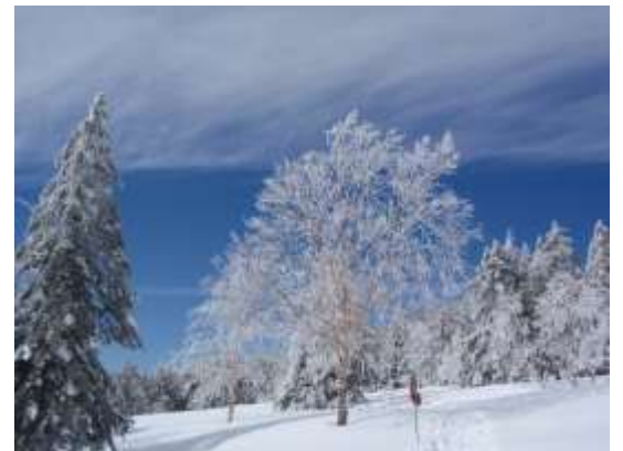
6. だんだんと青空が広がってきた