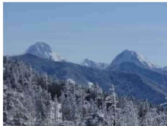
38. 最後に赤岳が見送ってくれました