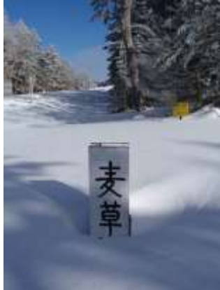
13. 車道も雪に埋もれています