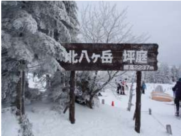
1. 18日 ロープウェイを降りて坪庭を出発

小屋の宿泊客も少なく、2日目に雨池に着くまでは会う人もあまりいなかったため、静かで山を独り占めしているような気分でした。1日目はアルプスが2日目は上信越の山々が綺麗に見えました。雪を頂き白く輝く峰は本当に素敵です。今回の一番の目的はスノーシューハイク。乾いた雪は快適に歩いて満喫しました。