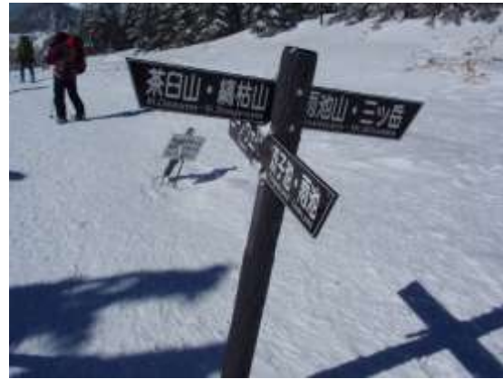
32. 風がとても強かった雨池峠