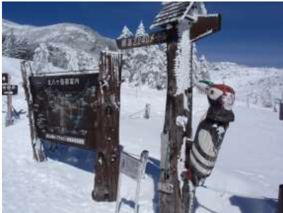
37. ロープウェイ乗り場に帰って来ました