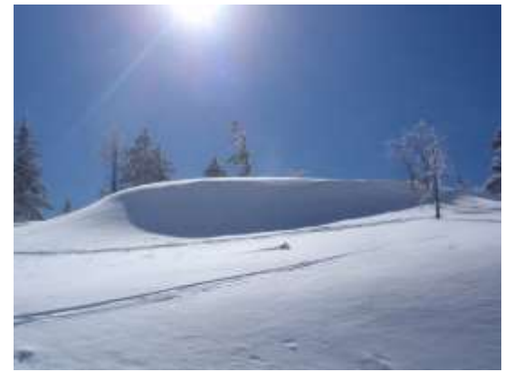
36. 雪庇ができていました