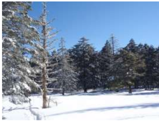
26. 時々開けた所があります