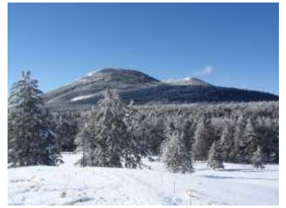
15. 茶臼山と縞枯山がくっきり