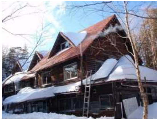
17. 今日宿泊する青苔荘