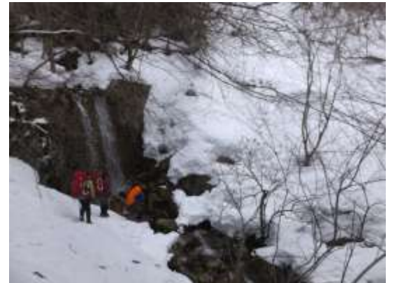
6. 青ガレ手前の沢を渡る