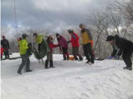
13. 雪面を平らにしていよいよテント設営