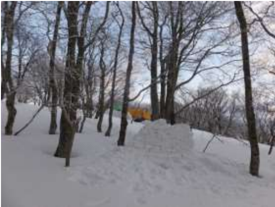
16. 雪のブロックで目隠して、雪のトイレも完成