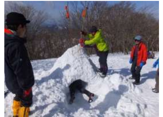
30. BCに到着後、ビーコン操作とゾンディングの実技 雪の中の人間をゾンデで突くとこんな感触やで