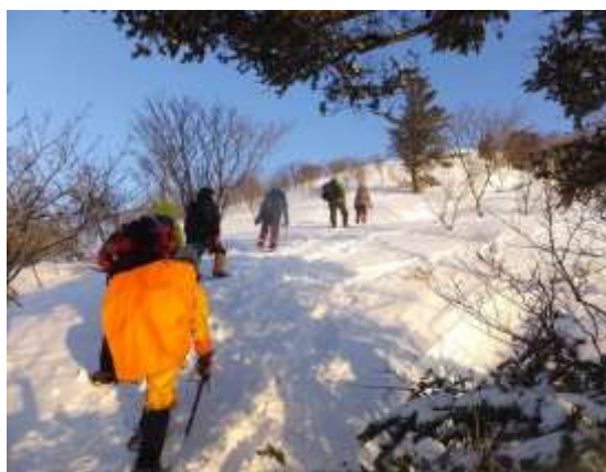
20. 武奈ヶ岳への雪面をひたすら登る