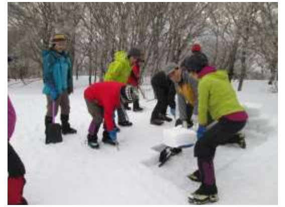
12. スノーノコとスコップで雪のブロックを切り出しては積んでいく