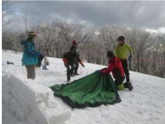
14. テント設営 その2