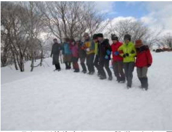
10. 頂上に到着後すぐにテント設営のため圧雪作業をラインダンスもどきで行った