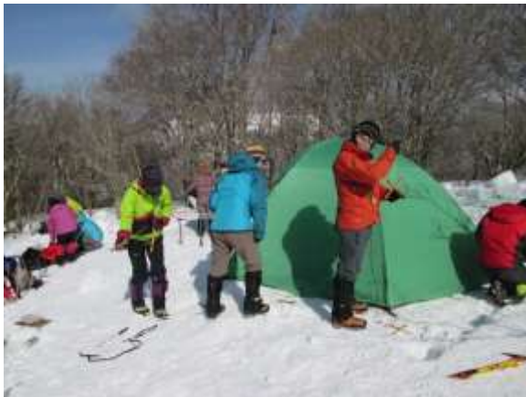
31. すべてのメニューを終了してテントの撤収を開始