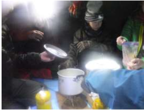
17. 雪を融かして水を作り、さあ晩飯だ！