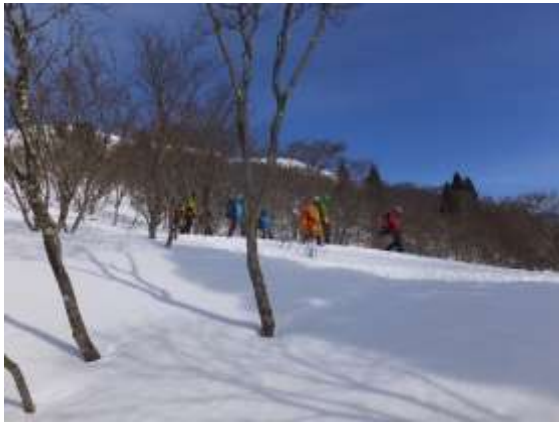
28. 訓練を終えてBCへと下山開始