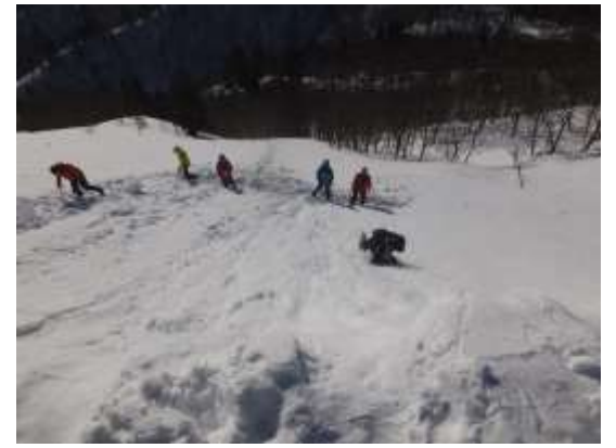
27. 下降点でストッパー役のスタッフが制止体制をとる