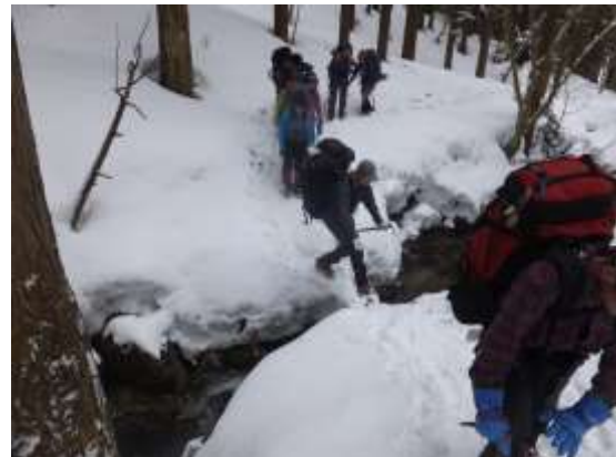
8. コヤマノ岳取り付きまで3回徒渉する