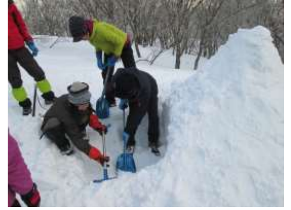
15. 今度は、スノーマウント(簡易雪洞)造りの実習