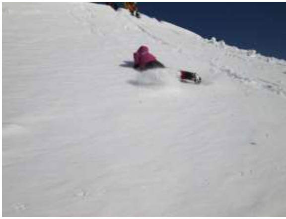
25. 滑落停止訓練を開始