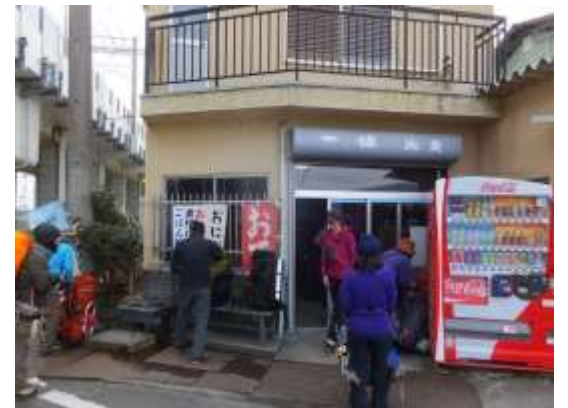
33. 一気に比良駅へと下山。いつもの”一休”で乾杯と共に楽しい反省会となりました。参加のメンバー、お疲れ様でした。