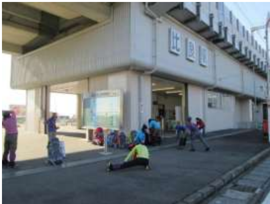
1. いつもの比良駅でストレッチして、さあ出発

テント泊の経験のない受講生もいたが、計画どおりコヤマノ岳頂上でBCを張ることができ、天気に恵まれたこともあったが滑落停止訓練をはじめアイゼン及びワカン歩行他、写真のようにほぼ予定のメニューを実施することができた。いつも頂上東側の急斜面を利用して滑落停止訓練を行っているが、今年は雪がよくしまっていてよく滑り、実践的な訓練が行えた。同じ山でも毎年違う姿を見せてくれる。