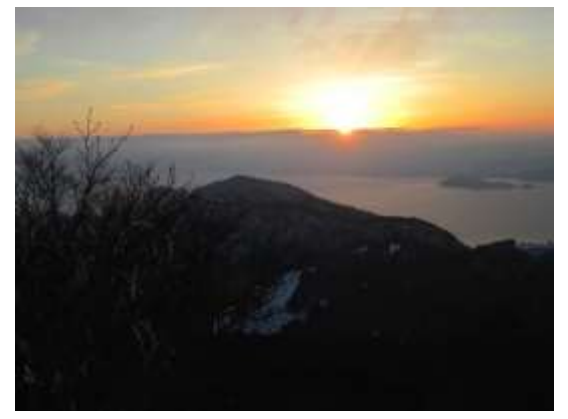
18. 翌朝のご来光 幻想的だ