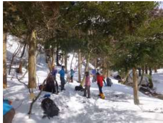
32. 下山途中、金糞峠手前の奥ノ深谷源流部でまったりと休憩する