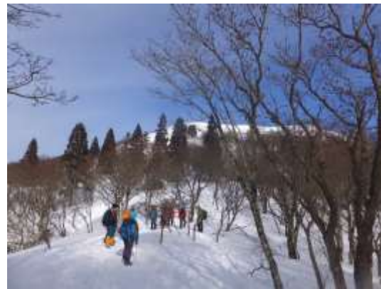
29. 雪のブナ林の中をBCへ