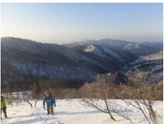
22. 振り返るとBCのあるコヤマノ岳と琵琶湖が見える