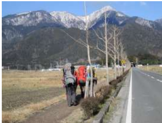
2. 比良・武奈ヶ岳目指して歩き出す