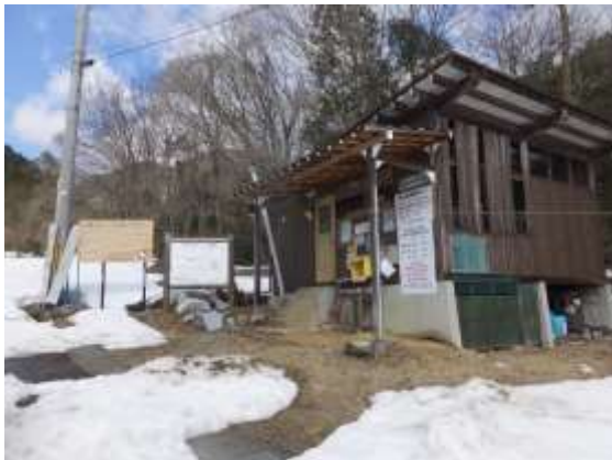
4. イン谷の比良管理事務所で登山届けを投函