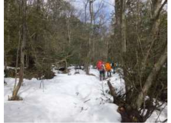
3. イン谷の手前からもう雪道となる