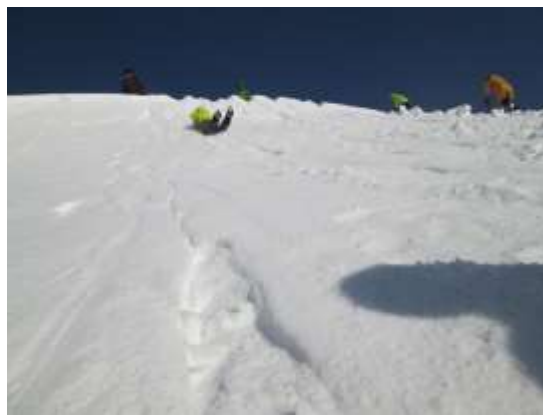
26. 今年の雪はしまっており、よく滑る、滑る