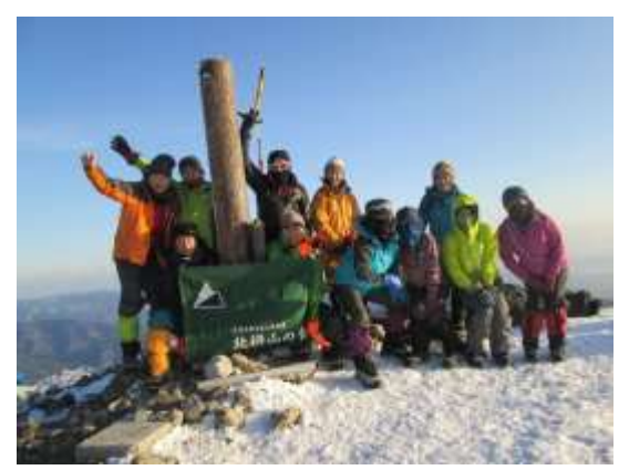
24. 武奈ヶ岳頂上で集合写真をパチリ