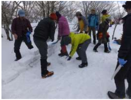
11. 今回は防風ブロック造りをしっかり実習した