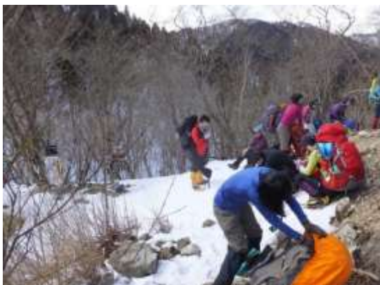
7. 金糞峠に到着 しばし休憩