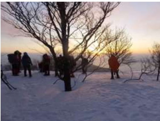
19. 武奈ヶ岳目指してさあ出発 気温マイナス8℃