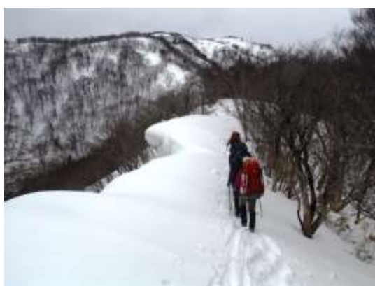
5. 東尾根までの急峻ルートを経て東尾根を歩く。雪庇が結構発達している。