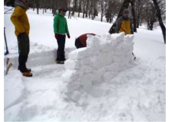
15.今度はトイレ造り。目隠しのブロックも完成