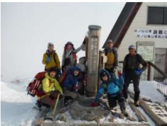
22.頂上に到着 ガスが少し晴れて集合写真