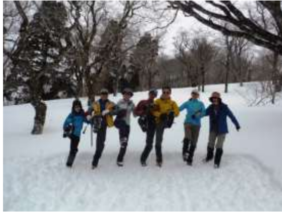
14.ラインダンスも楽しむぞ！