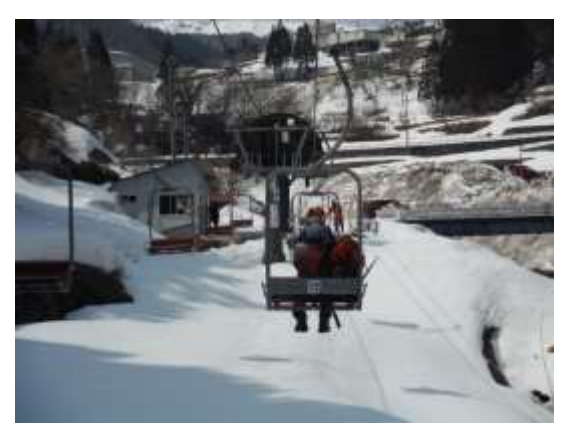
36. リフトに乗って下山 ここで山行は終了。お疲れ様でした。