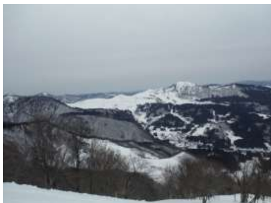
8. 鉢伏山とハチ高原スキー場が見える。