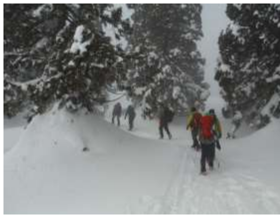
26. 今度は二ノ丸に向け歩き出す