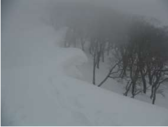
28. 雪が多く、雪庇が発達している