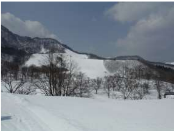
34. 一気に下山 氷ノ山国際スキー場が見えてくる