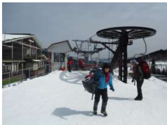
1. 駐車場からリフトを乗り継ぎ、スキー場に到着

スキー場から東尾根への取り付きは今回、先行者のトレースを利用したが、とんでもないショートカットルートで急峻な登りが続き、下山時は東尾根避難小屋からのルートに変えて下山した。