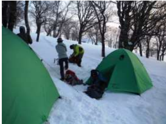
17.翌早朝、出発の準備をする