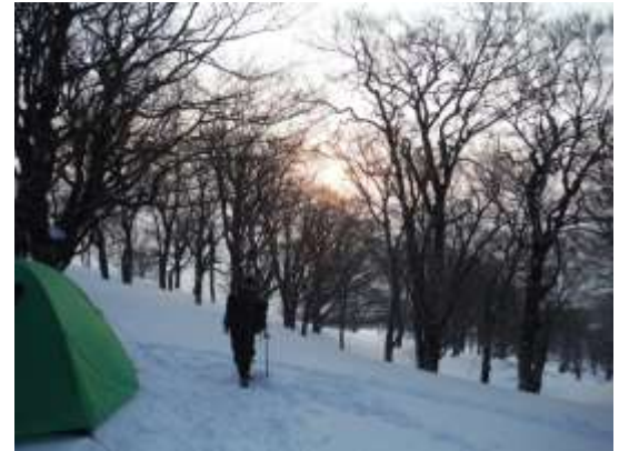
18.氷ノ山頂上目指して出発する