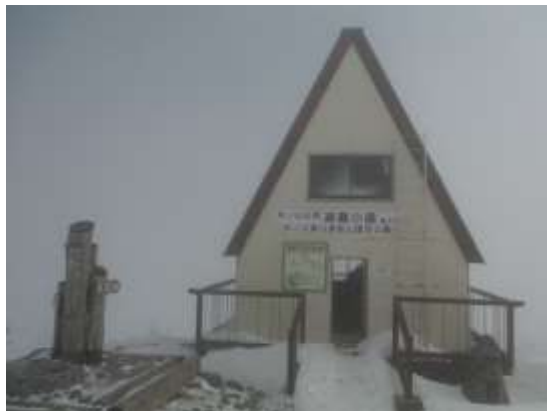
23.雪の中の避難小屋