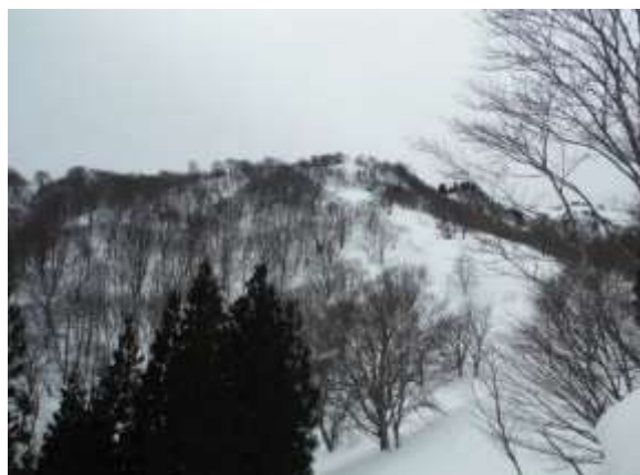
7. 今日のテン場とする千本杉あたりが見えてきた