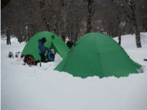
16.テントの設営を完了し、テントの中へ入る