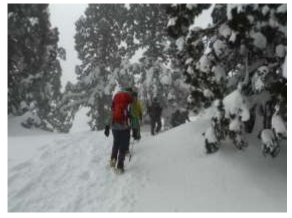
27. 樹氷の杉の樹林の中を歩く