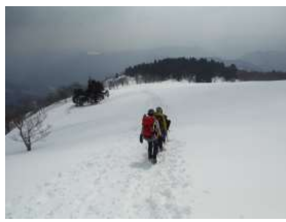
32. 頂上から千本杉目指して下山する