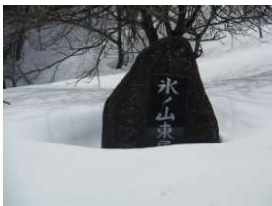
4. 東尾根登山口を通過