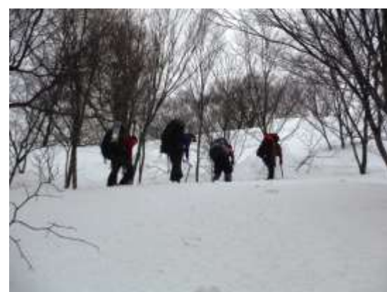
9. ブナの樹林の中を歩く