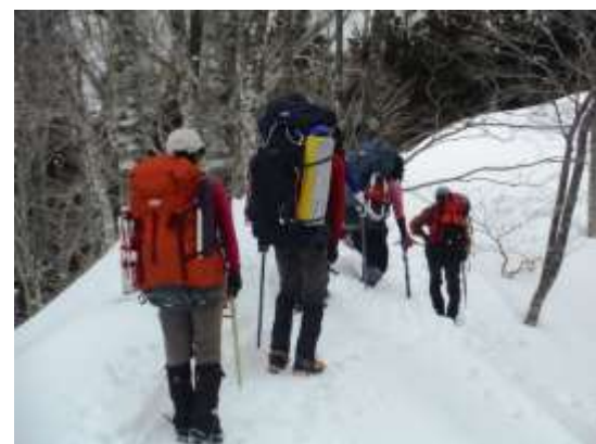
6. 樹林の中をペースよく歩く