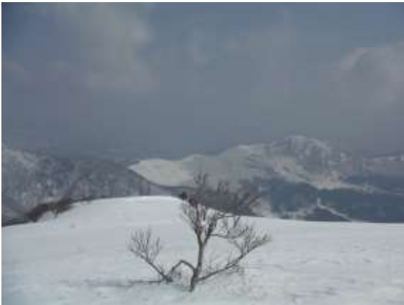
31. ガスが晴れ、遠くに鉢伏山が見える