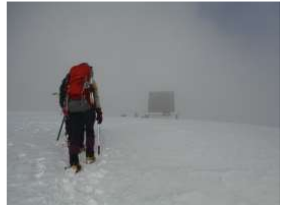
21.ガスの中に頂上避難小屋が見えてきた