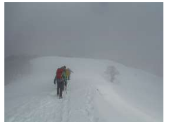
30. 頂上に向け引き返す