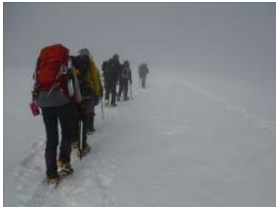
20.ガスの中、頂上はもうすぐだ