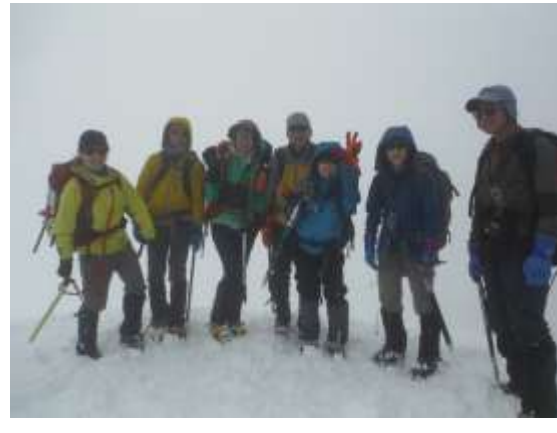
29. 二ノ丸？頂上でパチリ