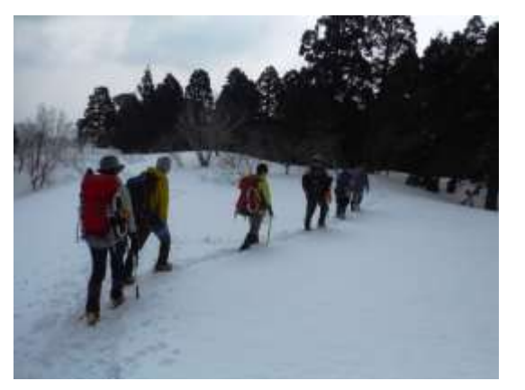
33. 千本杉はもうすぐ