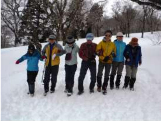
13.みんな一列に揃って圧雪作業だ！