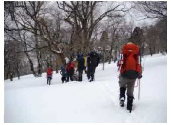
12.適当なテン場となる場所を探す