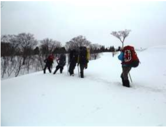
10.千本杉が近づき、神大ヒュッテめがけ方向をかえて歩く