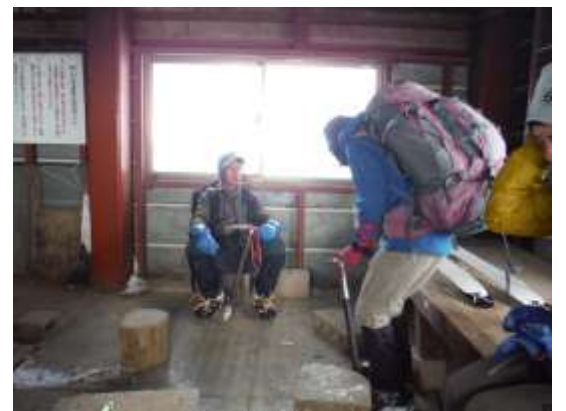
24.小屋の中でちょっと休憩