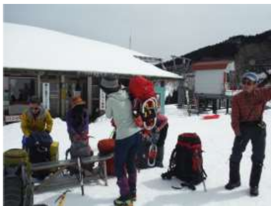
2. セントラルロッジ前で身支度し、さあ出発