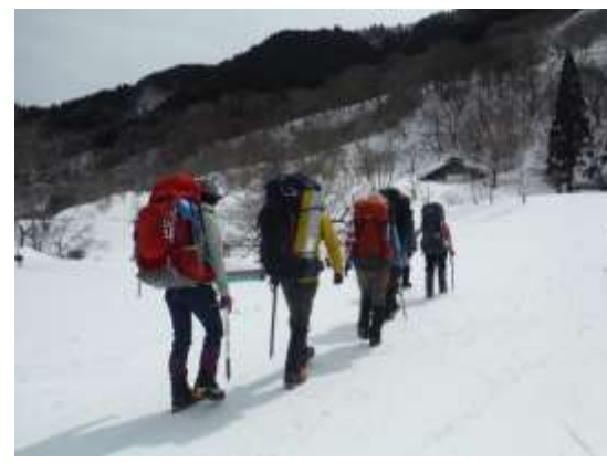
3. 東尾根登山口目指してスキー場を歩く