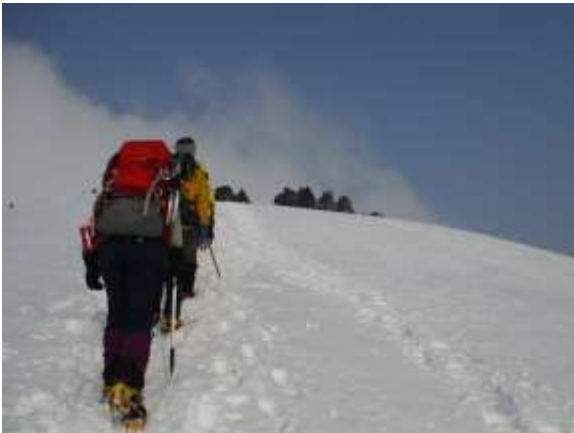
19.頂上手前の古千本が見えてくる