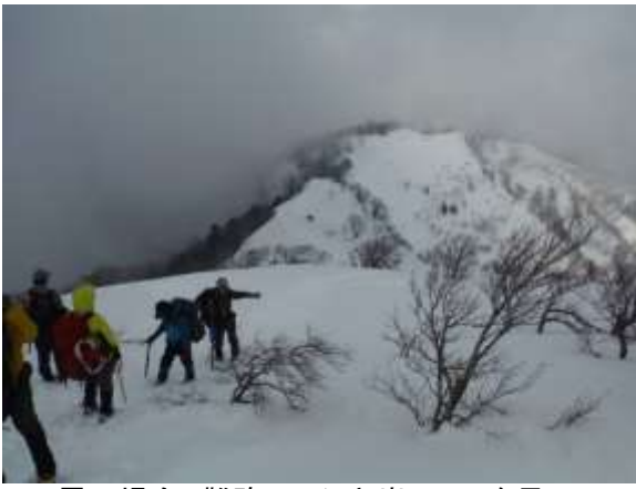
25. 雪の場合、難路のコシキ岩ルートを見に行く あそこやで・・・