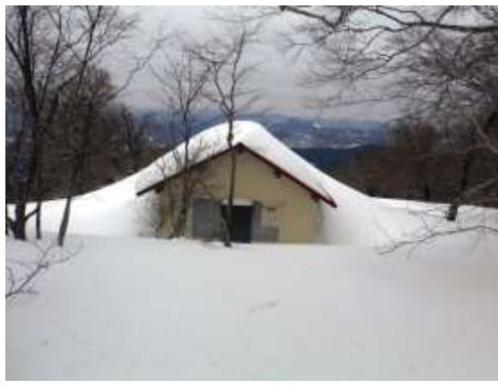
11.神大ヒュッテは1階部分は雪の中であった