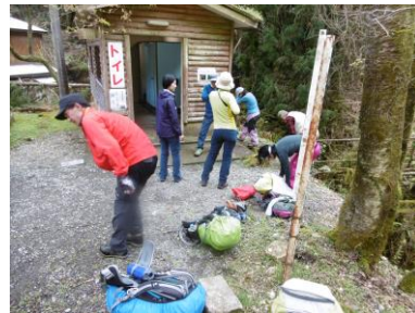
㉓下山後登山靴洗い