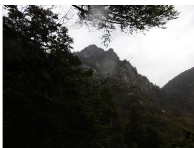
⑤ これから目指す大天井岳