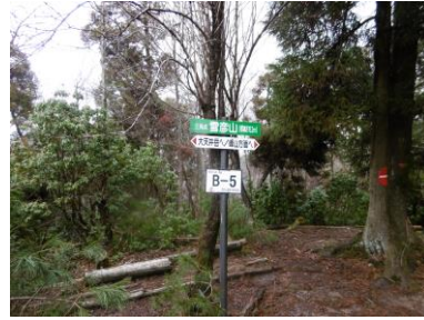
⑮大天井一峰山看板