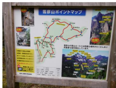
② 登山道ルートマップ