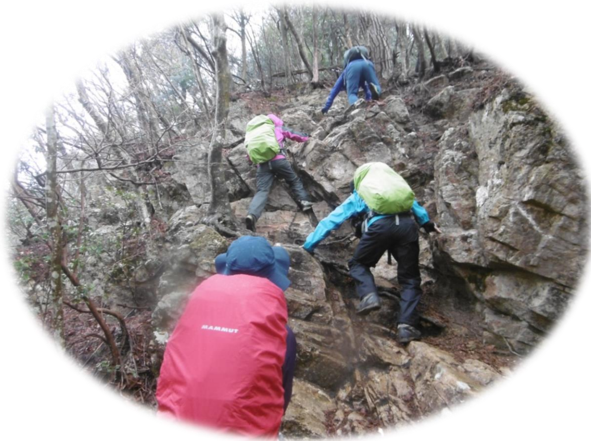
岸壁を登っている様子