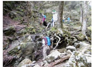
⑳滝前の急斜面通過