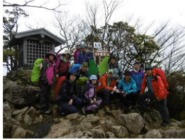
⑭大天井岳頂上集合写真