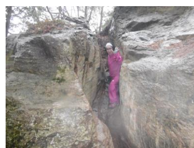
⑪ 岩の割れ目通過中