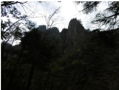
㉑クライミング用岸壁の稜線