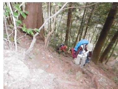
③ 登山開始早々の急登