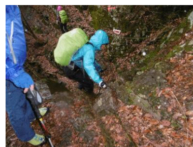
⑦ 岩場岩場を降りる