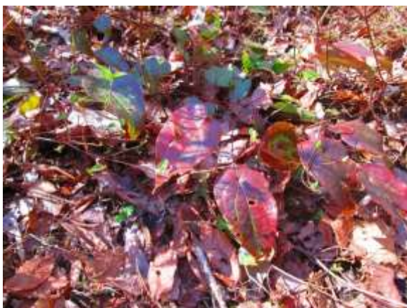
花はまだだがイカリソウもあった