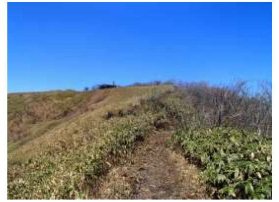
18. 笹原の先に中蒜山頂上と避難小屋が見えてきた