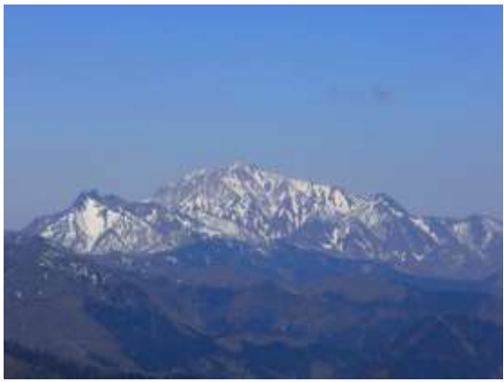
13. 頂上からの雪の大山