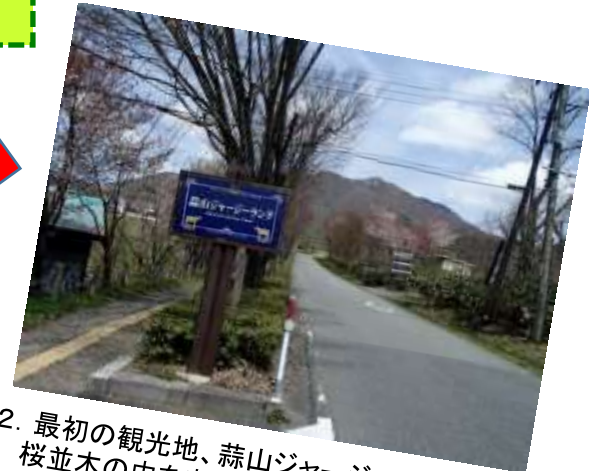
2. 最初の観光地、蒜山ジャージーランドへ桜並木の中を走る