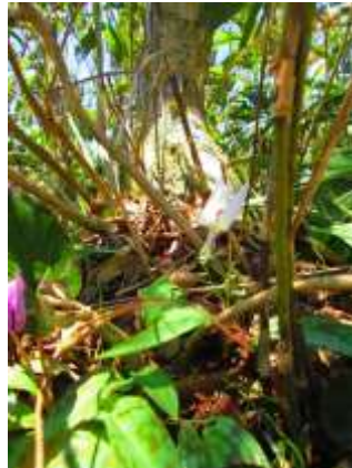
珍しいカタクリの白花