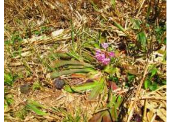
ショウジョウバカマの葉は四方に広がるロゼット状が特徴