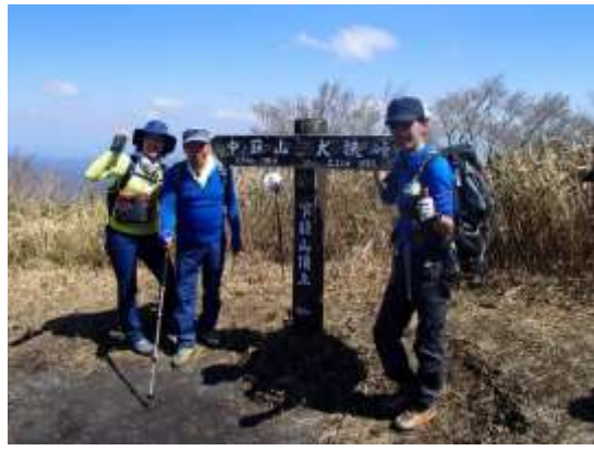
12. 第一峰 下蒜山頂上に到着