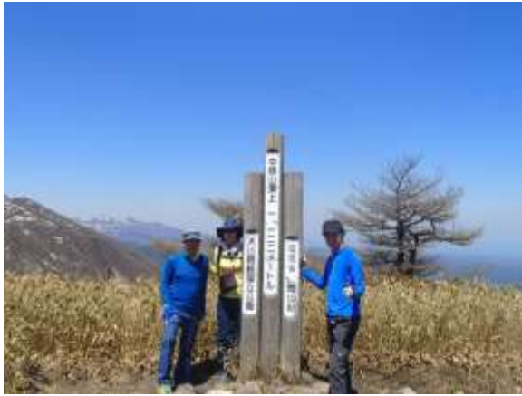
19. 中蒜山頂上 三座縦走組の3人です