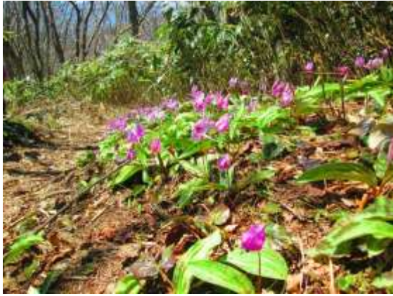
カタクリの大群落 ちょうど満開で見事であった