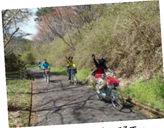
10. やあー！ 頑張ってるで〜