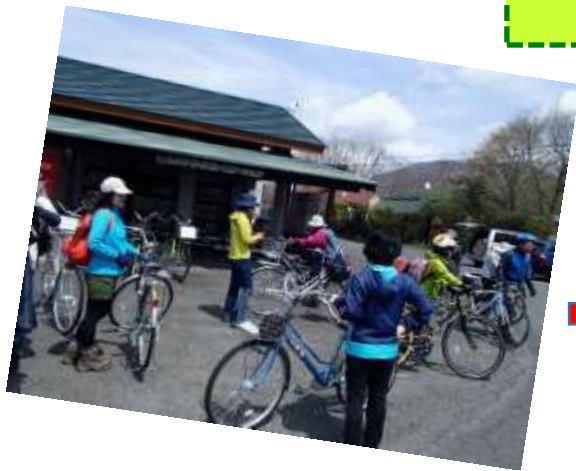
1. ウッドパオにて自転車をレンタルして、さあ出発!