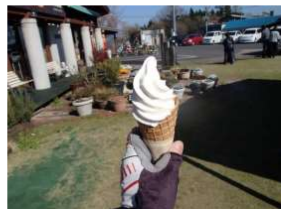
30. 昨日のウッドパオに到着。これで縦走は終了。二座パーティーが車で迎えに来るまで、蒜山のジェラートでも食べて待つとしようか