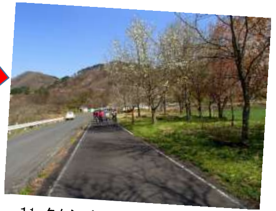
11. タムシバ咲く下を軽快に走る走る