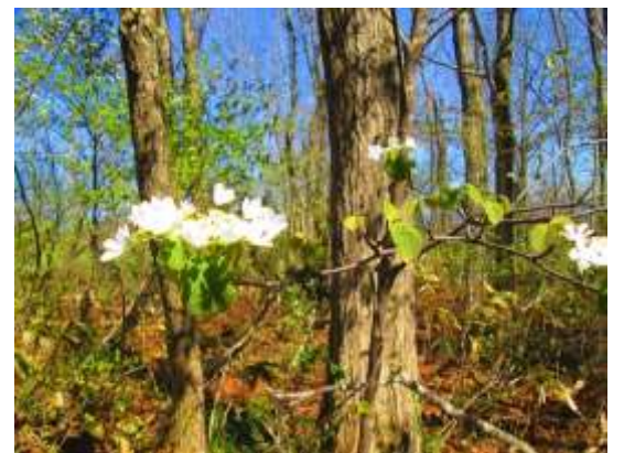
麓近くにあったムシカリ(オオカメキ)の白い花