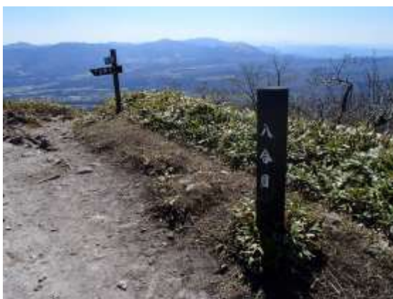
28. 下山を開始して八合目を通過