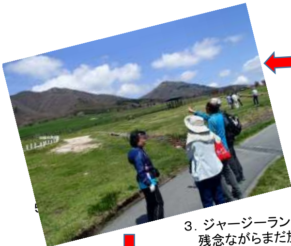
3. ジャージーランドで昼食。ジャージー牛は残念ながらまだ放牧していなかった