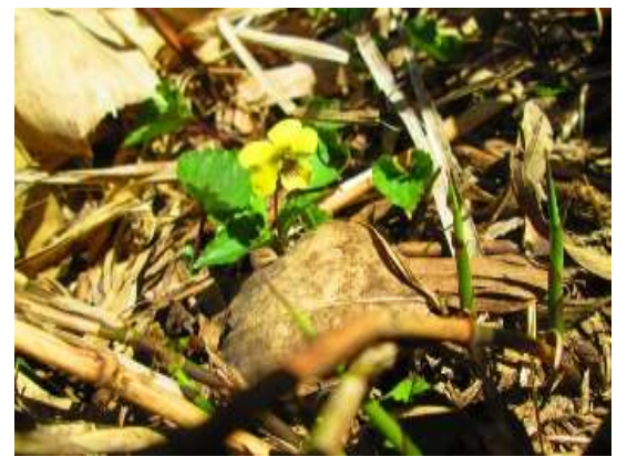
キスミレもひっそりと咲いていた