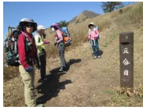
5. 展望の良い五合目を通過