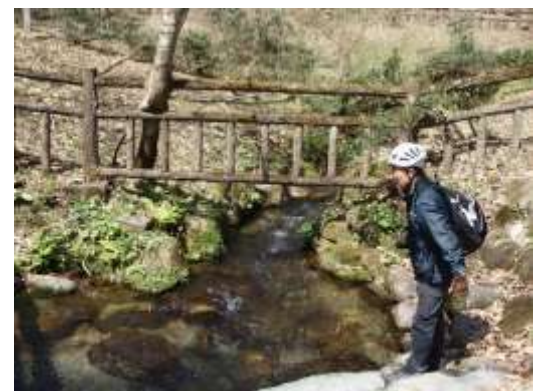
5. 塩釜の冷泉着。泉源ではとてもきれいな水が湧き出していた