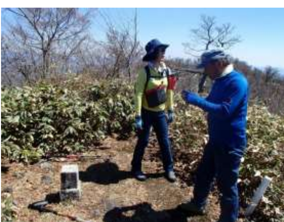
26. やっと辿り着いた三角点