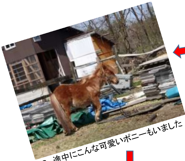
8. 途中にこんな可愛いポニーもいました