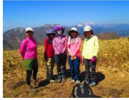
14. やや遅れて到着の北摂の美女5人