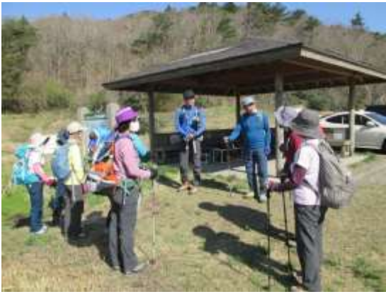
2. さあー 出発だ！