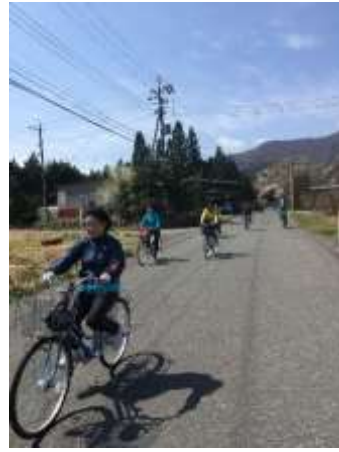
7. 快適に自転車をとばす