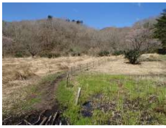
2. スタート地点 少しぬかるむ道を進む