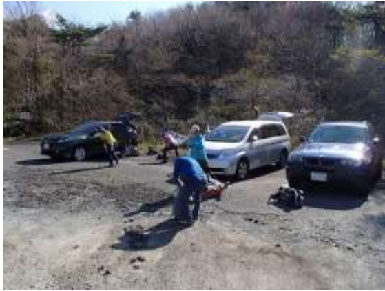
1. 下蒜山登山口到着。ストレッチして出発の用意