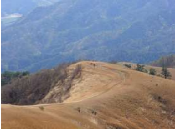
10. 登ってきた雲居平を望む