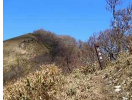
11. 九合目、下蒜山頂上はもうすぐ