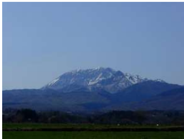
13. 遠くに雪の大山がどっしりと美しい