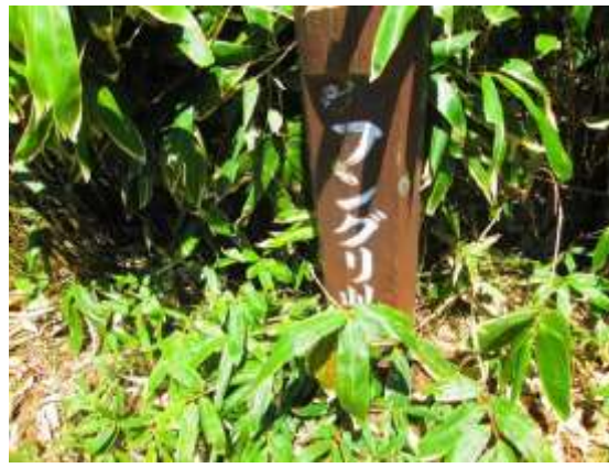
17. フングリ峠(たわ) [大昔、巨人が峠をまたぐとき鞆丸(フングリ)を引っかけたことから名付けられたそう]