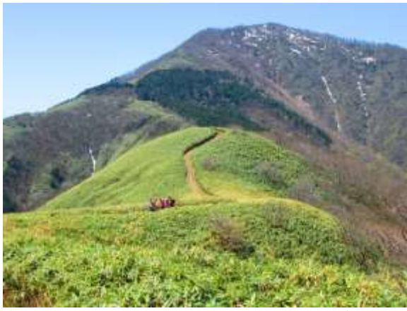
16. 中蒜山手前の笹原を北摂の美女連が行く