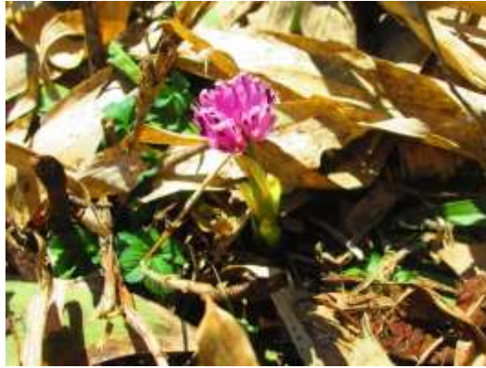
もっと多いと思っていたがショウジョウバカマ咲いていた