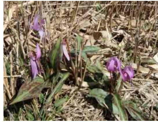
8. やや！カタクリがさいている