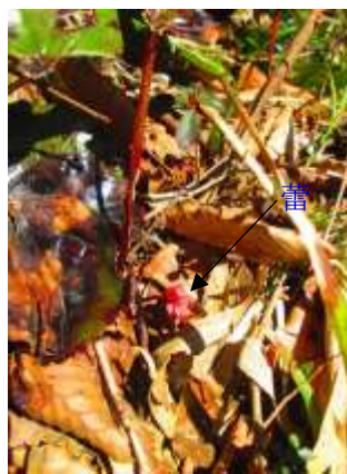
イワカガミも花はまだであったが蕾が見えた