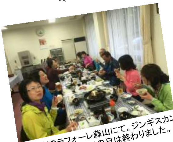
19. 宿のラフォーレ蒜山にて。ジンギスカンの夕食・大宴会でこの日は終わりました。