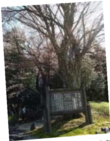
14. 天然記念物、黒岩の山桜