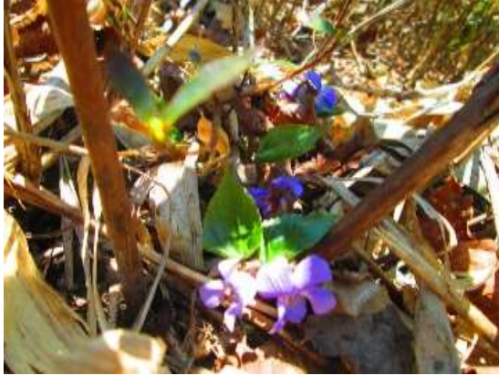
スミレは種類が多いがタチツボスミレか？