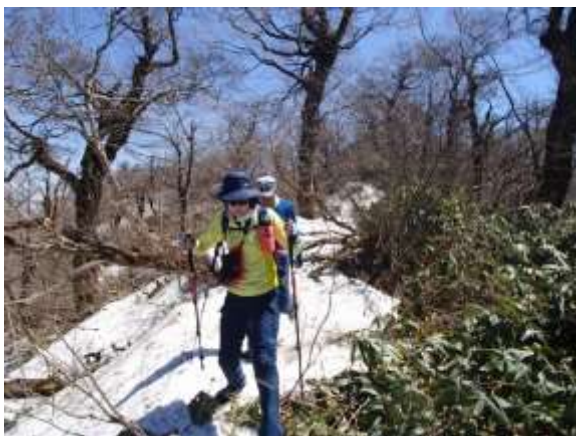
25. 三角点を探しに雪上の藪を漕ぐ