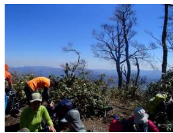
27. 上蒜山頂上 結構たくさんの方がいた