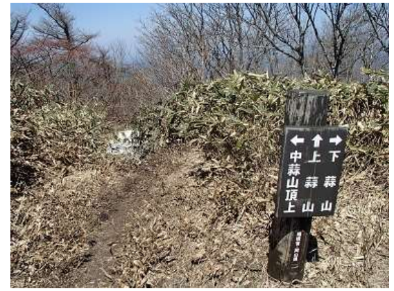
21. この分岐から先が雪の残る上蒜山の登山道