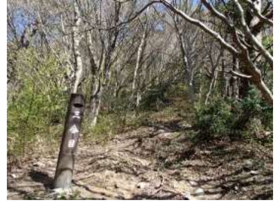
4. 三合目 若葉が萌える樹林の中を進む