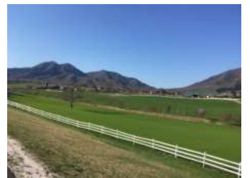
17. いよいよコースも終盤。蒜山三座を見ながらスタート地点のウッドパオに向かう