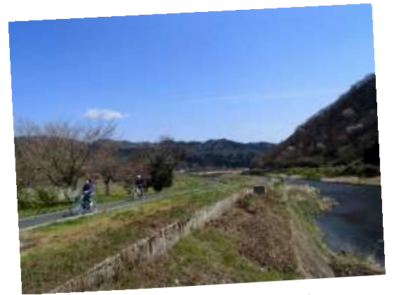
12. 川沿いの爽やかな道を行く