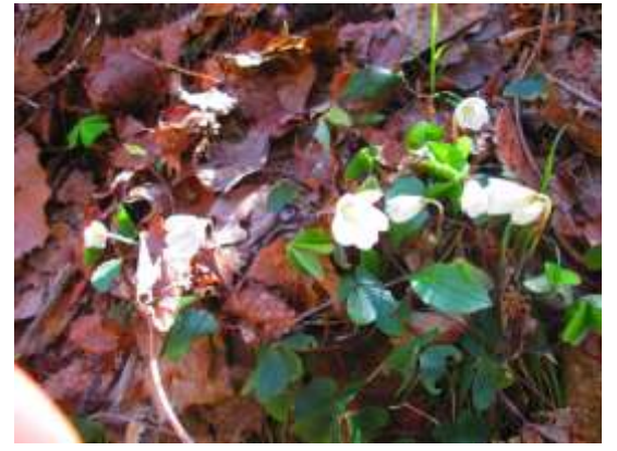
ミヤマカタバミも里近くにあった