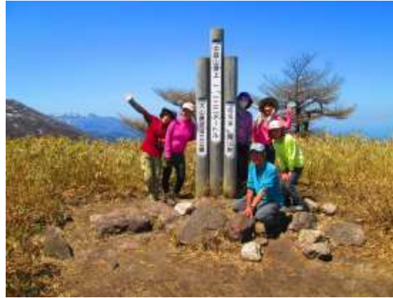
20. 大分遅れて到着した二座縦走パーティーの6人