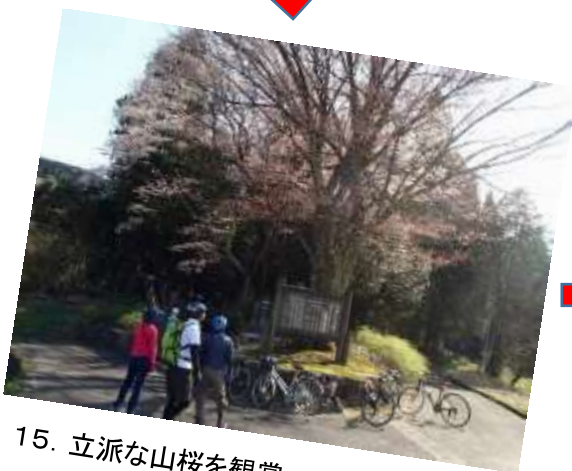
15. 立派な山桜を観賞