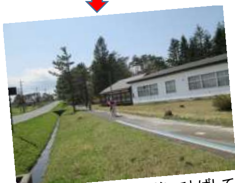
4. 次の塩釜の冷泉めざしてとばしています