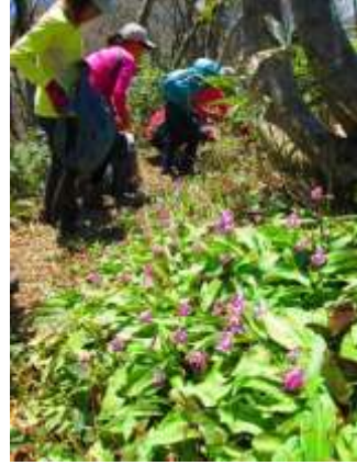
15. すごい！カタクリの大群落だ！