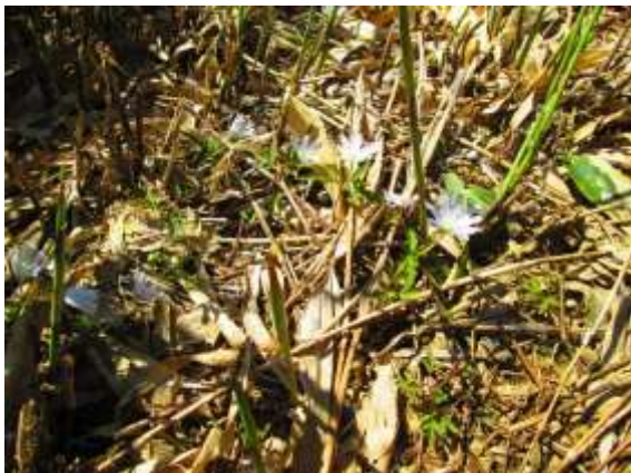
花が白いのでハレーションを起こしているが、これはアズマイチゲ