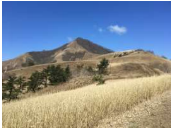
6. 笹原の先の下蒜山を望む