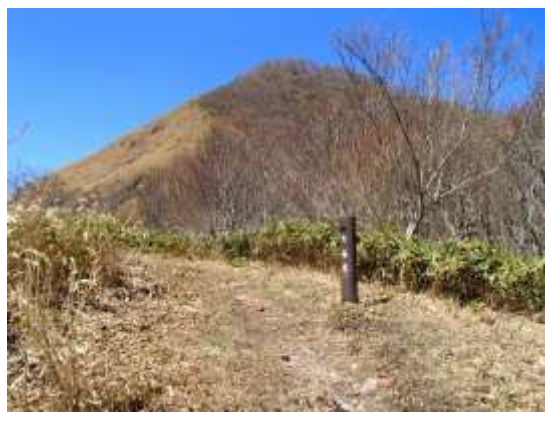
9. 七合目に到着しました