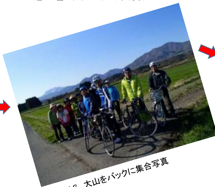
16. 大山をバックに集合写真