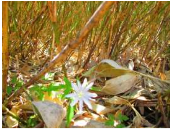
アズマイチゲの花