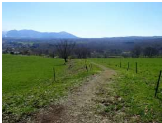
29. ようやく里に下りてきた