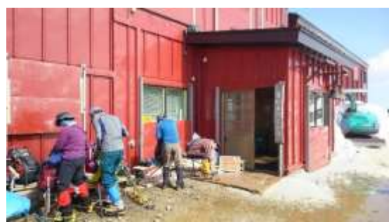
20、唐松岳頂上山荘に着きました