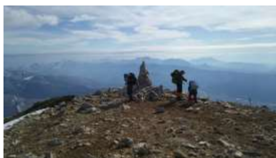
32、あっという間に丸山ケルン