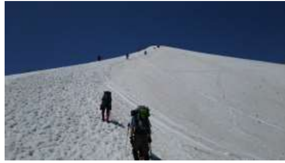
11、アイゼンを着けて登ります