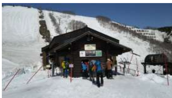
2、次はアルペンクワッド