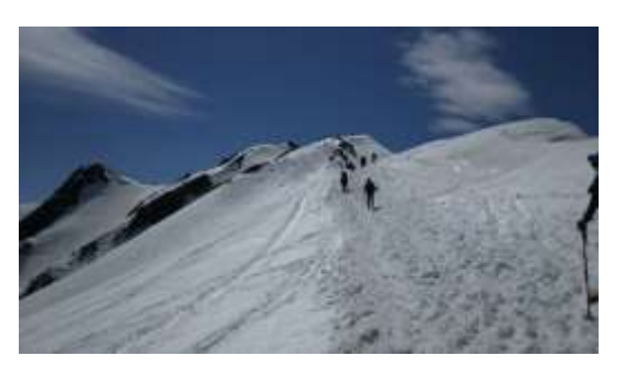
18、唐松岳頂上山荘がなかなか見えてきません。あの先にきっとあるはず