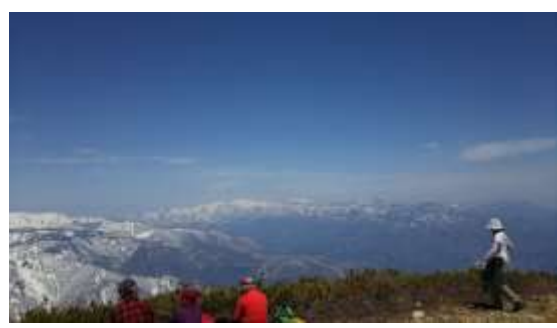
14、青い空に癒されます