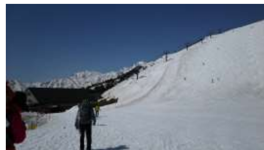
3、スキー場を横切ってグラートクワッドへ