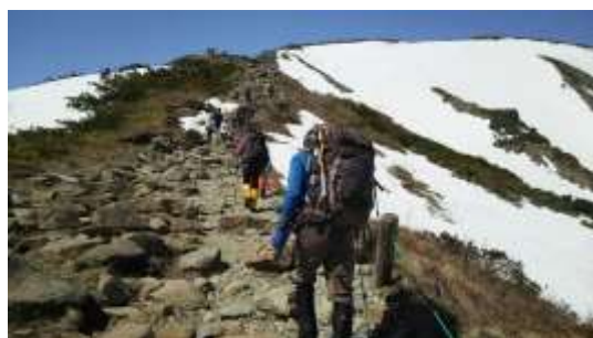
5、登り始めは夏道へ、雪道コースもあり途中で合流しました