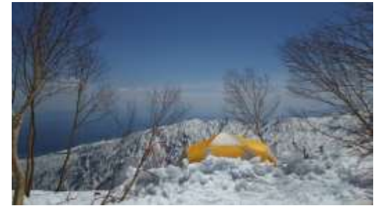
12、こんな所にテントが！