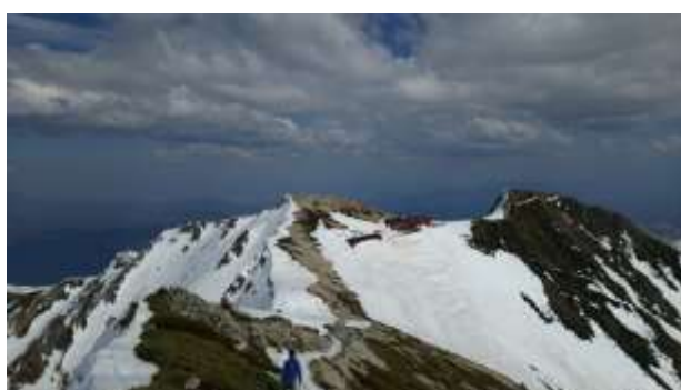
22、振り返ると山荘とテント場が下の方に見えます