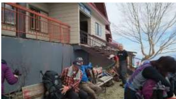
34、予定より早く八方池山荘に着きました