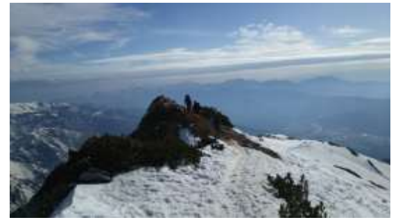
30、来た道に戻ります