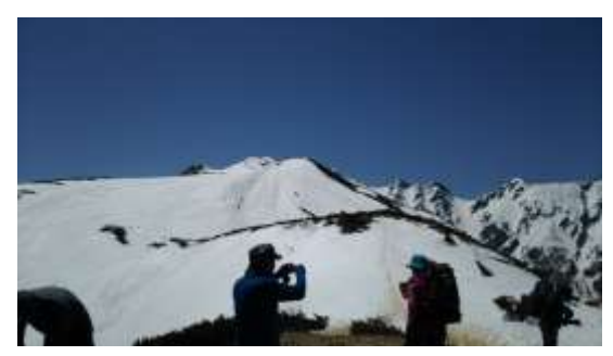
15、前方に登ってる人が見えます。気合いを入れてさあ行くぞ！