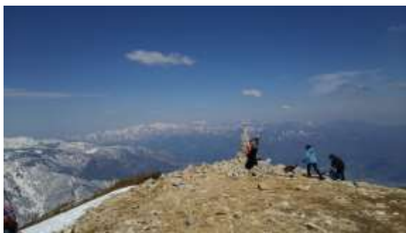
16、丸山ケルンに着きました