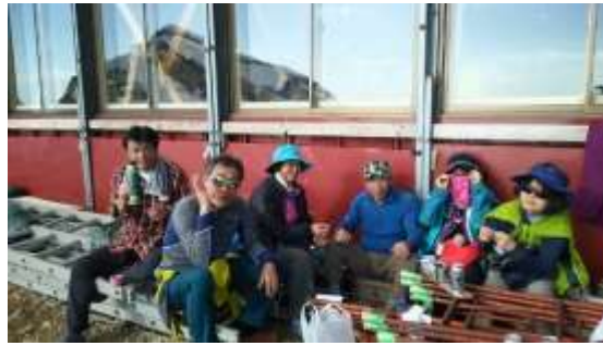
26、夕食の前の楽しいひととき、居酒屋 G もオープンしました