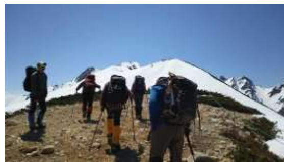
17、雪のない所もあります