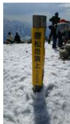
23、唐松岳頂上に到着です、ヤッター！