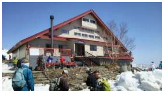
4、八方池山荘に着きました