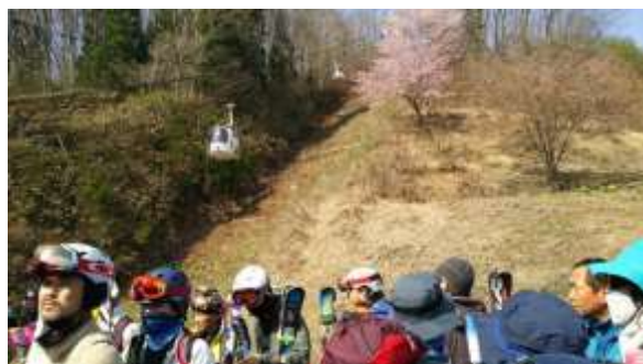
1、まずはゴンドラアダムに乗ります