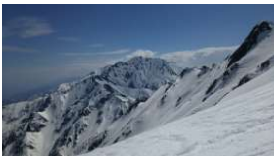
19、五竜岳の稜線、五竜組は今の辺りかな？