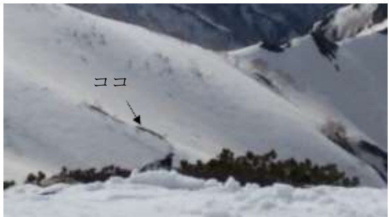
31、雷鳥がいました、どこにいるかわかるかな～？