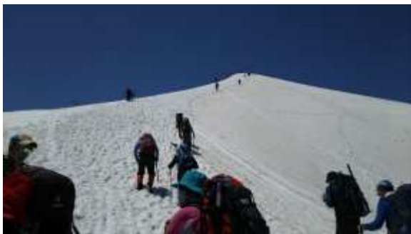
13、なかなかの登りです