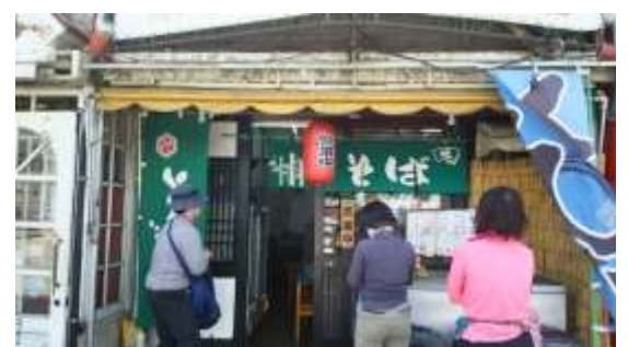
36、駅前のお店でお蕎麦をいただきました