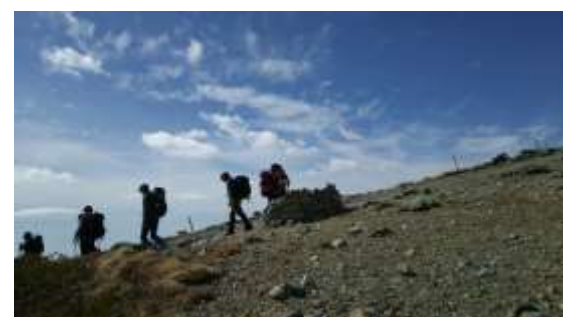
33、なごり惜しいですが下山します