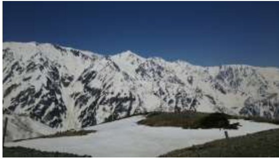
10、八方池は雪の下です。帰りはこの上を歩きました