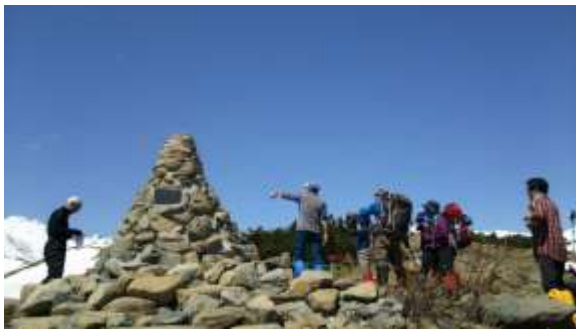
7、八方山ケルンに着きました