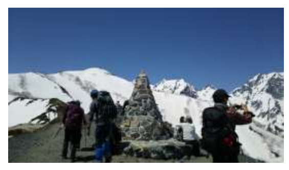
9、第3ケルンに着きました