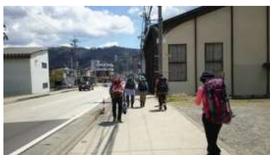
35、お風呂に入って白馬駅方面に向かいます