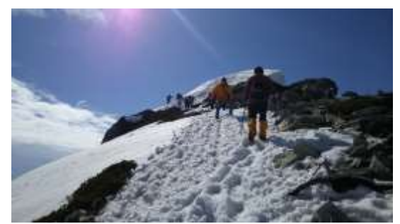
21、頂上を目指します