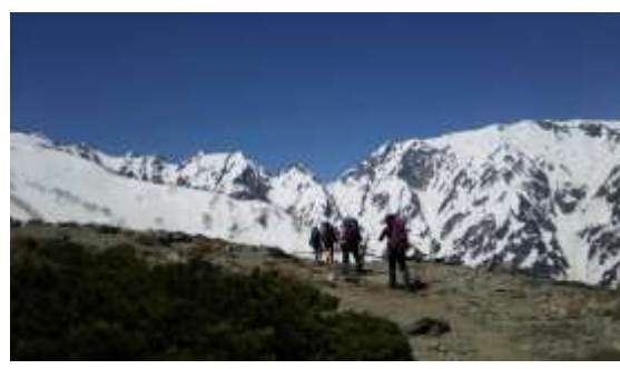
8、不帰嶮がよく見えます、険しそう～