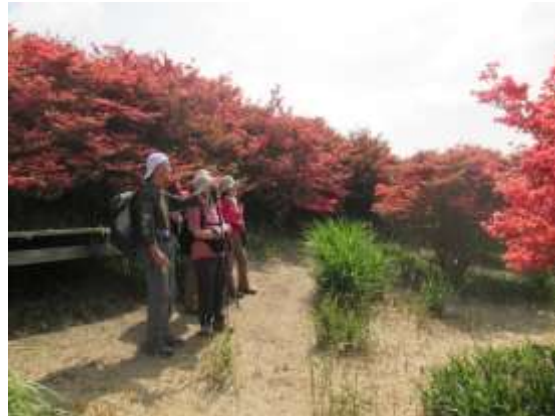
17. しばし美しいツツジを眺める