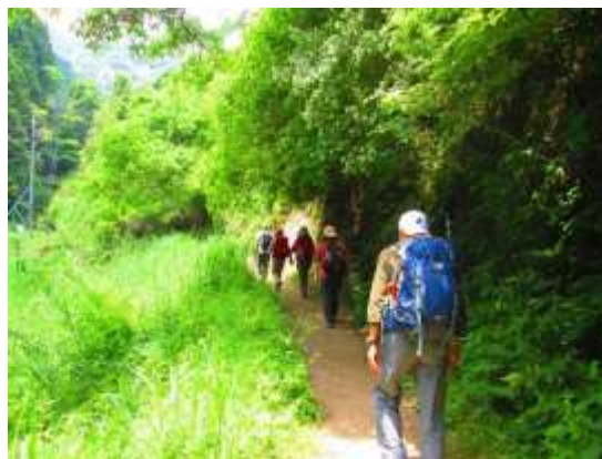
2. 最初はこんな穏やかな道がしばらく続く