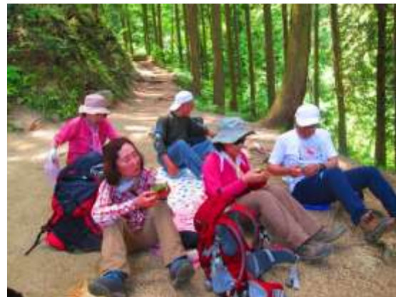
5. 登山路横の少し広くなったところでランチタイム