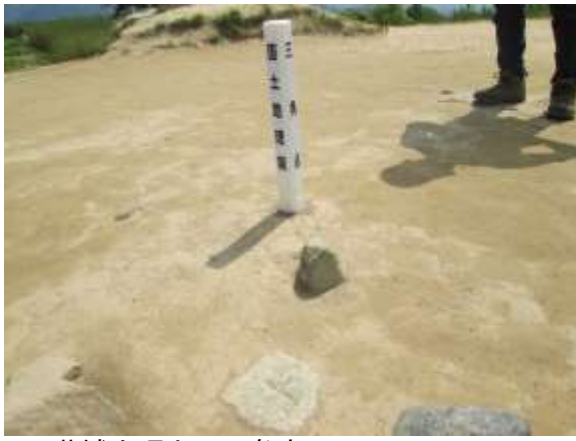
10. 葛城山頂上の三角点 何故かここのは地面に埋もれている