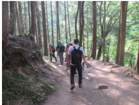
20. まもなくしてロープウェイ駅に到着し、今回の平日ハイクは終わりました