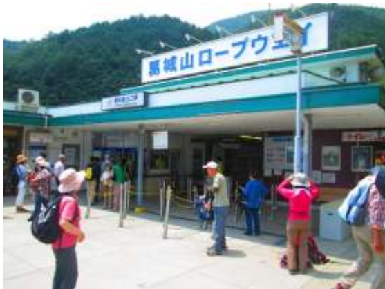
1. ロープウェイ駅前から登山開始

今年4回目の平日ハイクとして取り組まれた。 今回は一目百万本のツツジで有名な大和葛城山で、満開のツツジを楽しむことを目的にした。ここ数日、夏日が連続したこともあって花は終わりがかけていて鮮やかさに欠けていたが、圧倒する赤いツツジの大群落は見事なものであった。平日故に人が少なかったことも良かった。 登山路はロープウェイとほぼ並行するコースをとったが、雨による浸食が激しいため階段が多いのはやや難点であった。帰りのバスの時間の関係で復路も同じコースをとった。