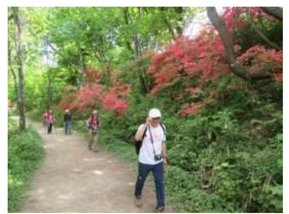
9. ダイヤモンドトレールの縦走路に出ると満開のレンゲツツジがあちこちに咲いていた