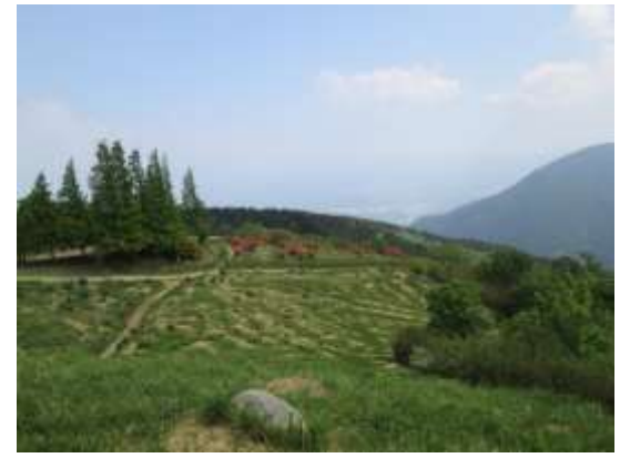
12. 頂上からツツジ園方面を望む