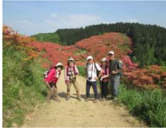
14. ツツジ園をバックにパチリ