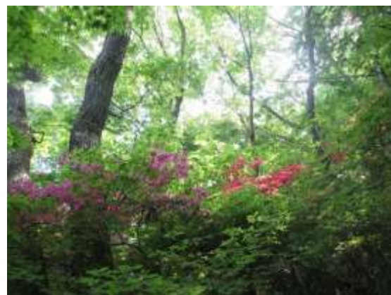
8. 8合目の落葉広葉樹林辺りから花を着けたツツジが迎えてくれる