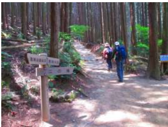
4. 二の滝(不動の滝)分岐を通過 滝への道は崩壊のため通行止めとなっていた