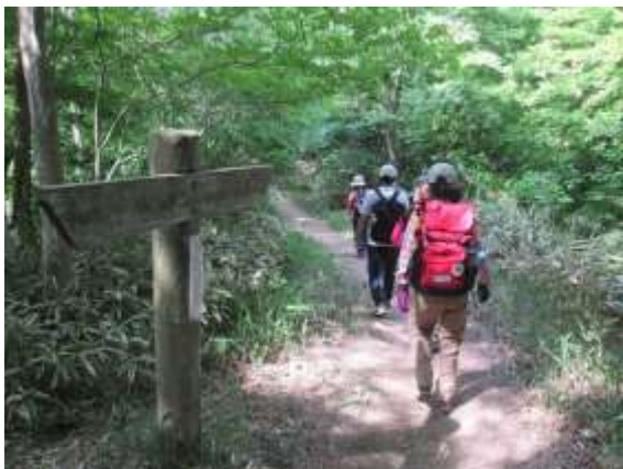
19. 帰路は往路を戻ることにして下山開始