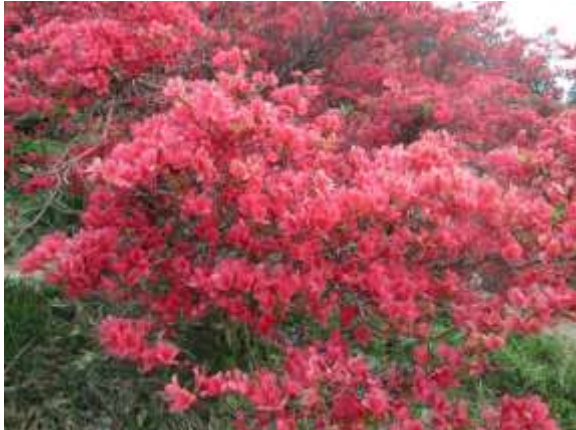
16. まだ色鮮やかなレンゲツツジもあった