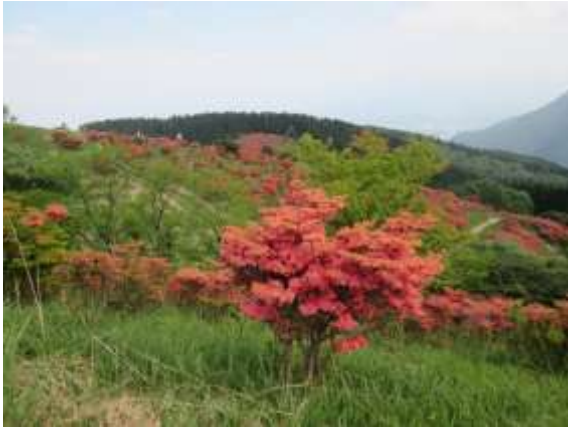
13. ツツジ園が近づいてきた