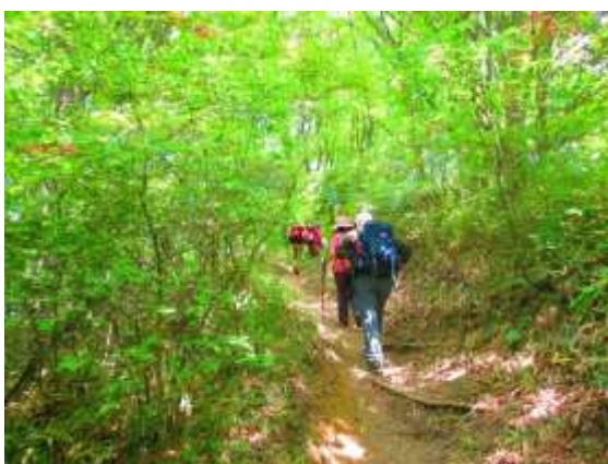
7. 針葉樹の人工林を抜けてようやく落葉広葉樹の明るい林に入る