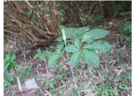
18. こんなアオマムシグサも沢山咲いていた