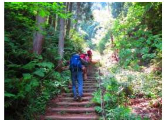
6. こんな階段が結構多かった