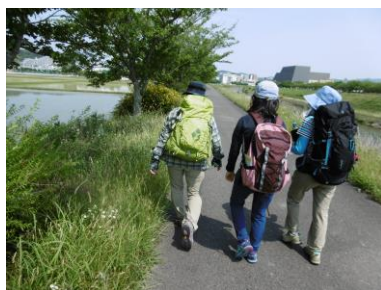
⑪ 武庫川添いを歩いて三田駅へ