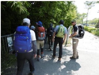
① 車道から登山道へ