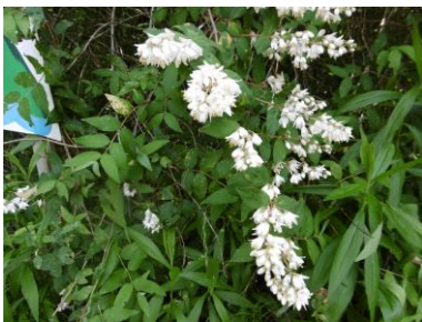
⑤ 登山道途中に咲いていた花