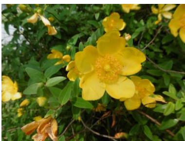
⑩ 河川敷にしていた花