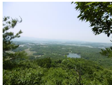
⑦ 福島大池を眼下に観る