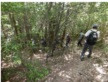
⑨ フィトンチットの小道