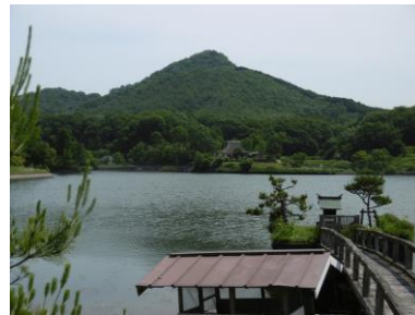
③ 福島大池より見た有馬富士