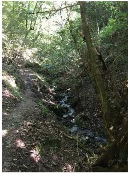
11. 沢も終わりに近づき、水量も気持ち程度。