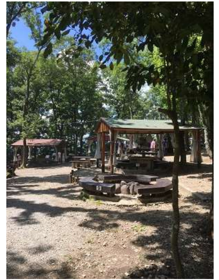
21. バーベキューテラスに到着。