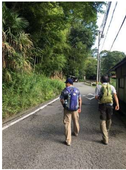
2. 各自体操を行い、妙見の森ケーブル黒川駅へ。