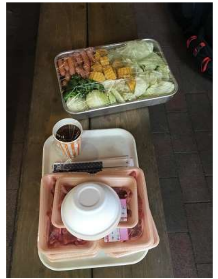
24. 予想以上に多かった食材。