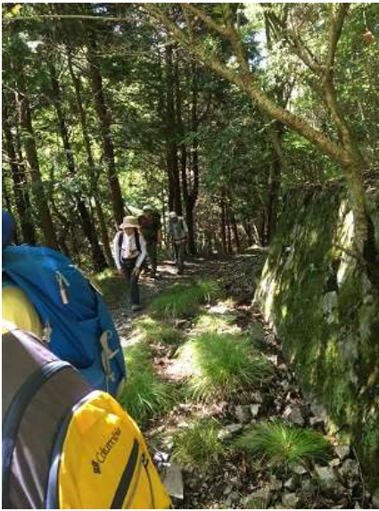
10. 時々涼しい風が吹く。