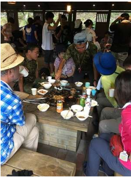
31. 焼きそばも終了まじか。バーベキューも終わりがかなあ