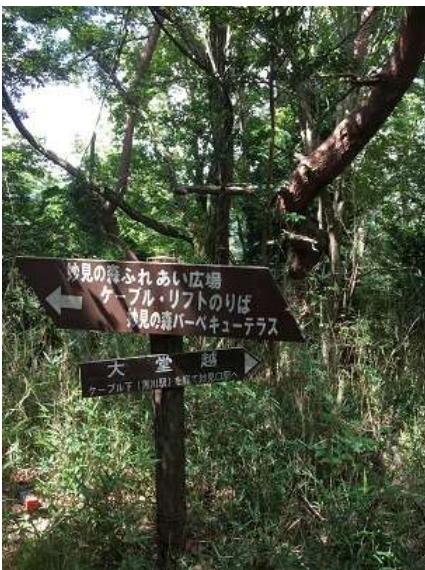
16. 本日の登りはここで終了。