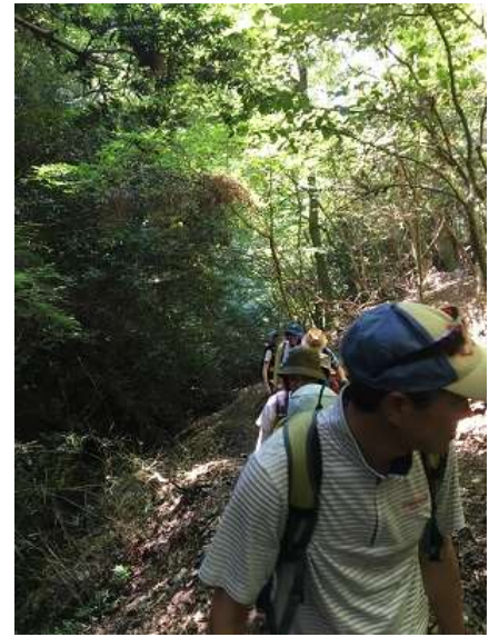
12. 歩きやすい道のため、話しながらの楽しい山行。