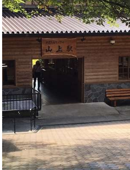
35. 妙見の森ケーブル山上駅に到着。