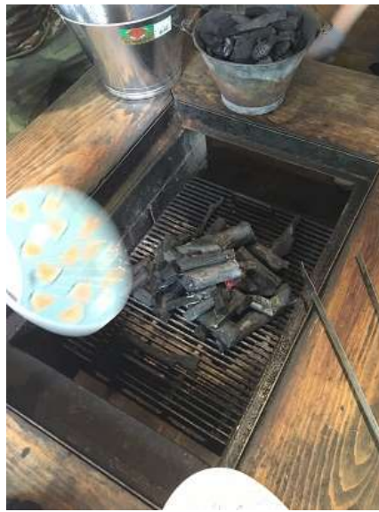
23. 炭に火をつけ、バーベキュー準備に取り掛かる。