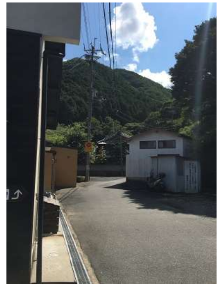
6. この先崩落箇所あり、行けませんよ