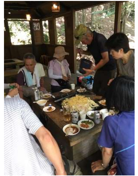
30. 〆の焼きそば調理中。