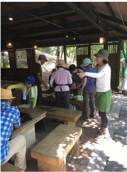
25. 手分けをしながらに準備作業。