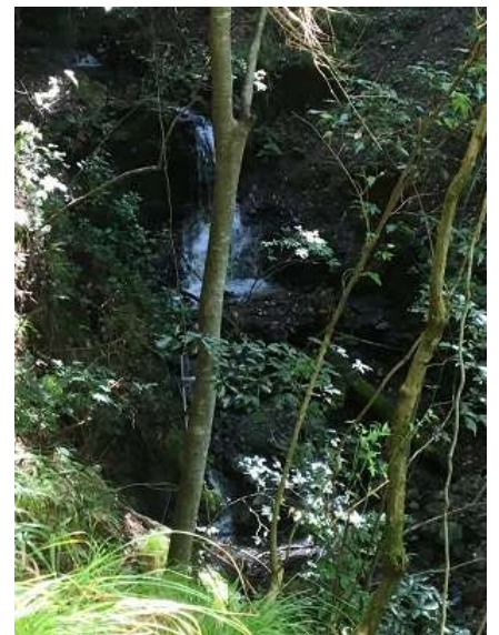
9. 沢沿いを歩くと、小さな滝もひらほらと。