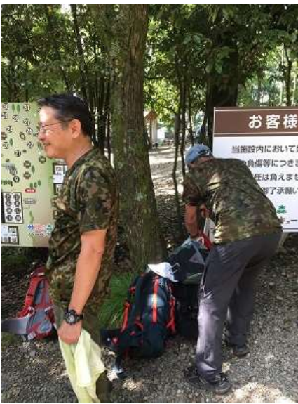
22. お二人は何をする予定？襲撃犯？