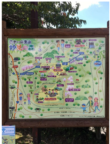
34. 妙見の水広場にある妙見の森案内板。