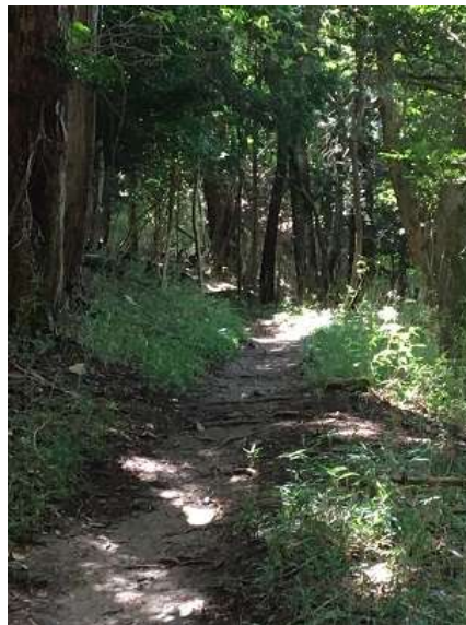
14. ここから10分ほど登れば後は下り。