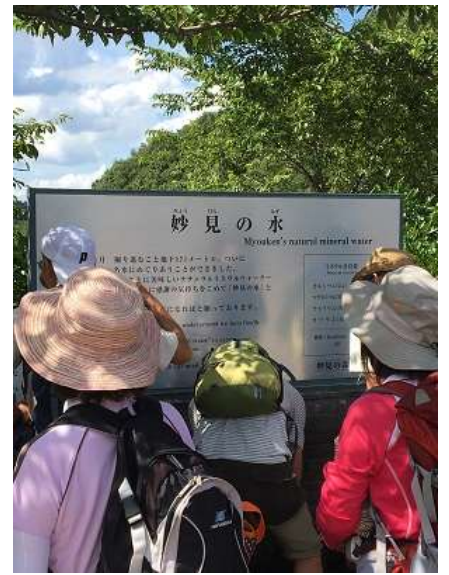
33. 妙見の水前に集まるメンバー。