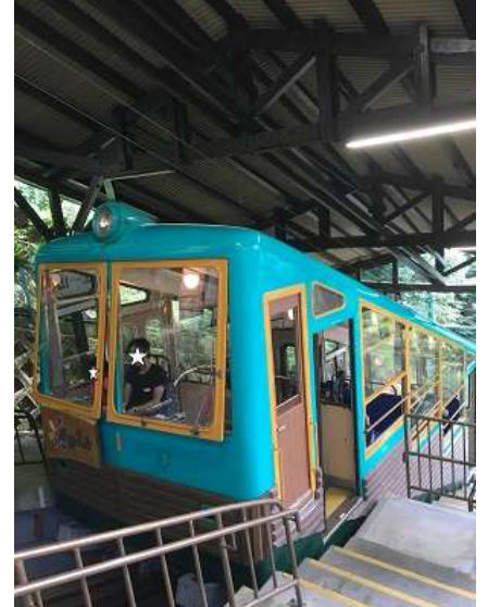
36. これに乗って下山。