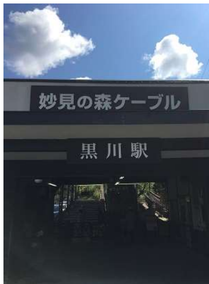
5. ケーブル黒川駅に到着。