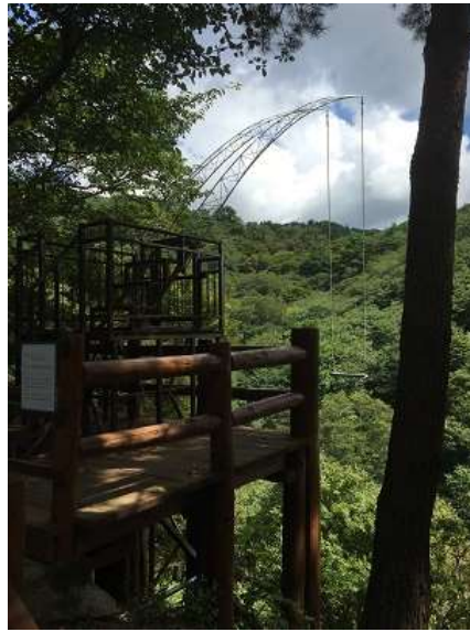
20. 乗るブランコではなく、芸術作品。