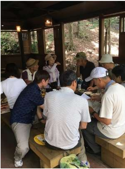
28. こちらのグループは話に夢中。特に遠征山行計画に。