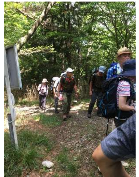
15. 最後尾の人も大堂越に到着。