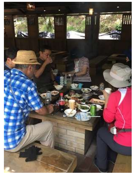
27. こちらのグループは飲み・食いに手が止まらない。