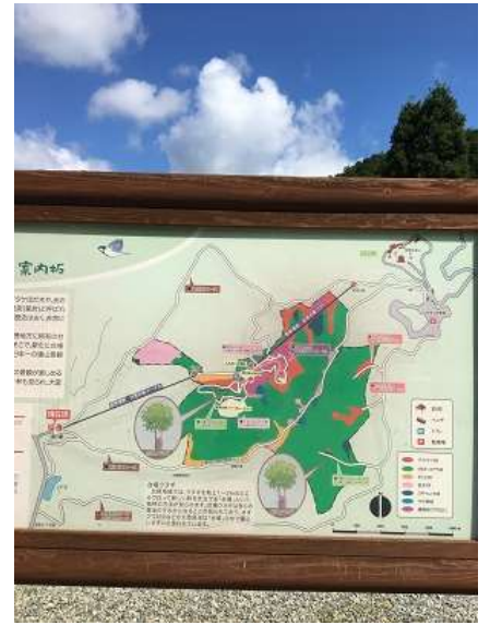
3. ケーブル黒川駅前の妙見の森案内板。