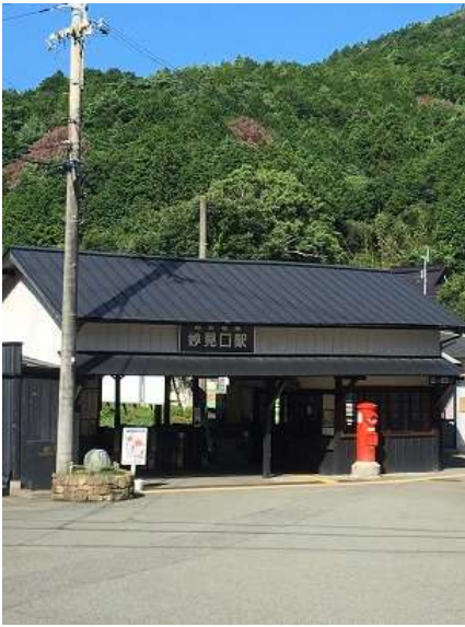
1. 本日の集合場所。能勢電鉄妙見口駅。