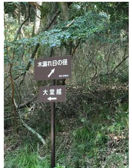
18. ここからも妙見山山頂へ行けそう。