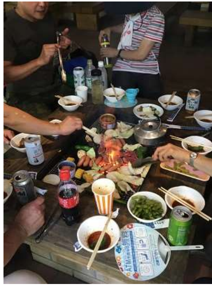
29. まだまだ肉は無くならず。