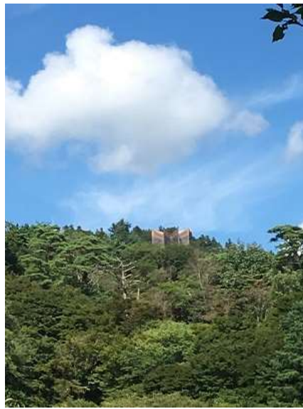
32. 妙見山山頂にあるお寺の変わった建物。