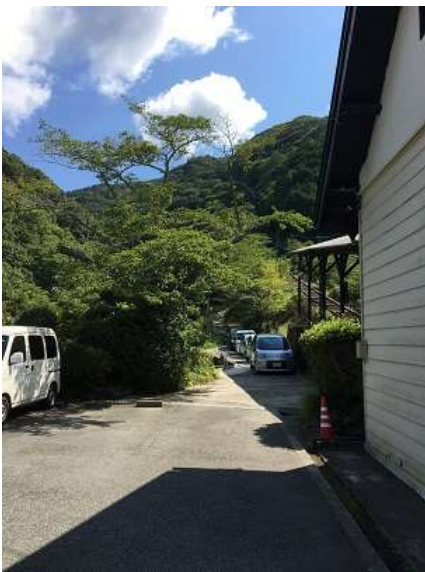
7. 今日はこちらから行く。