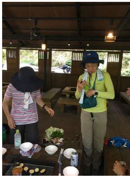
26. 飲みながら肉・野菜を焼く。