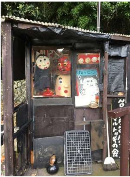
4. おかめ?、ひょっとこ?これはいったい何だ?