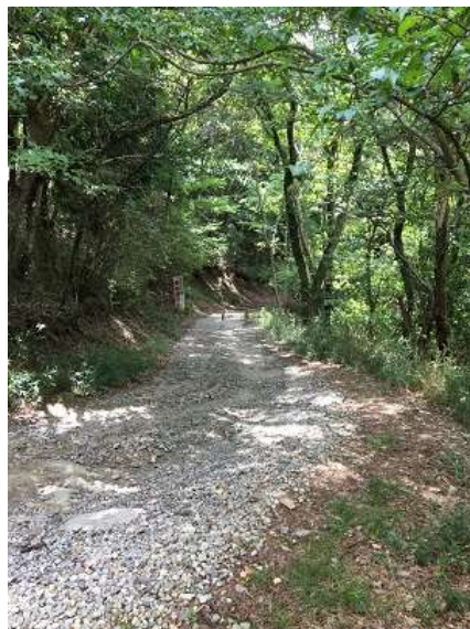
17. バーベキューテラスまでは歩きやすい道を下るだけ。