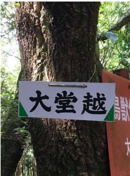
13. 大越越に到着しました。