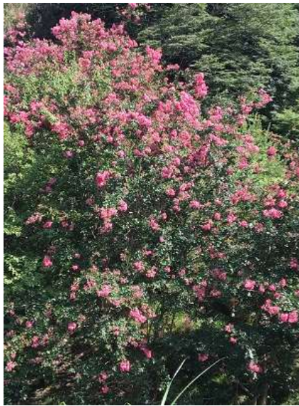
8. この花は何でしょうか?