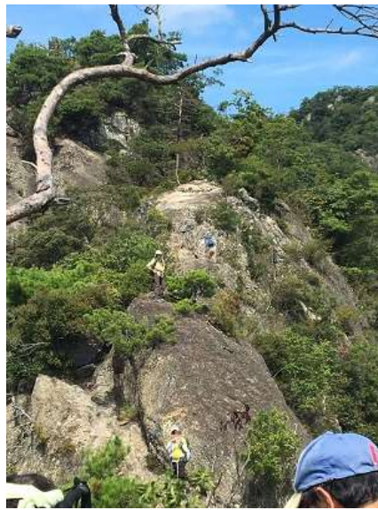
14. 続くどころか、足場は激しさが増す岩場に