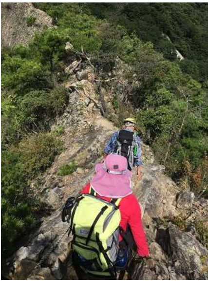
22. 痩せた尾根筋 岩場が余計怖さを強調している