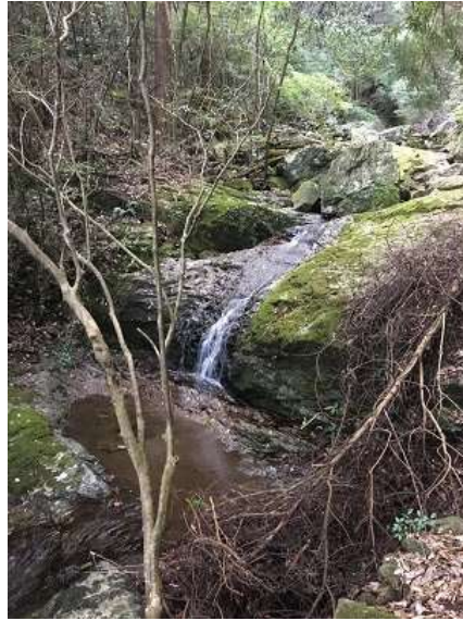
41. 小さい滝がいくつもあるとのこと。七種48滝とも。