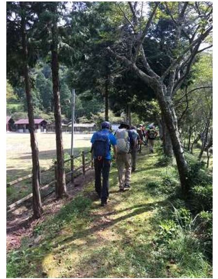
3. 急登が待っているとも知らず、 どんどん先を急ぐメンバー