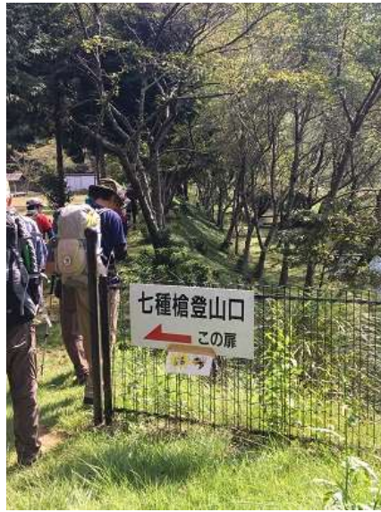
2. この先が七種槍登山口