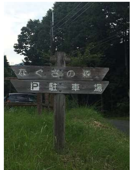
45. 本日のゴールである駐車場の山門