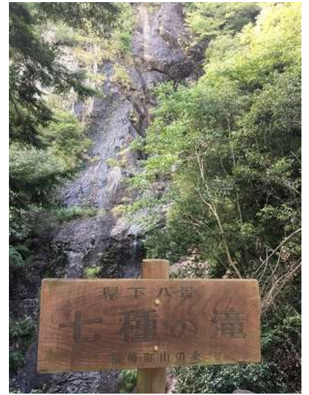
39. 七種の滝 高さ72m