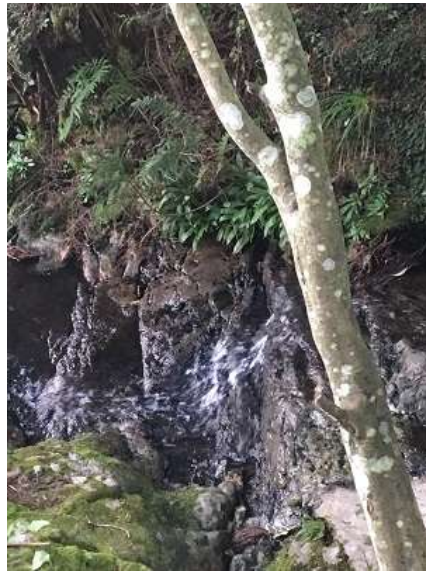
38. 七種の滝の落ち口付近