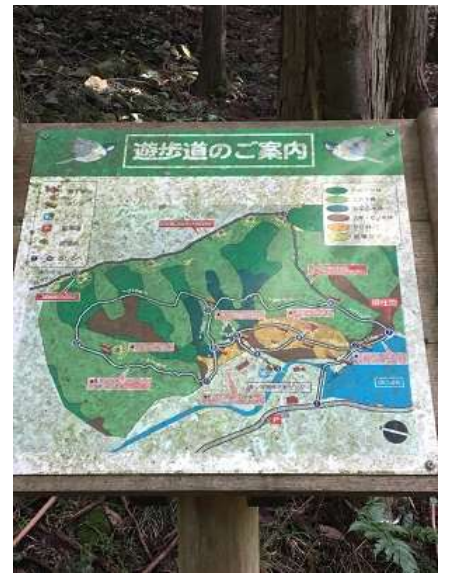
6. 登山口にある遊歩道のご案内