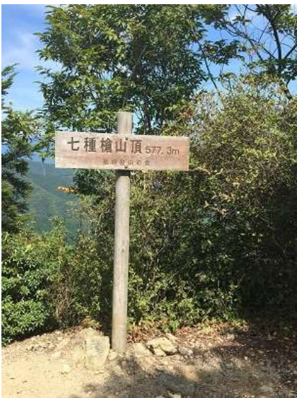
25. 七種槍山頂に到着