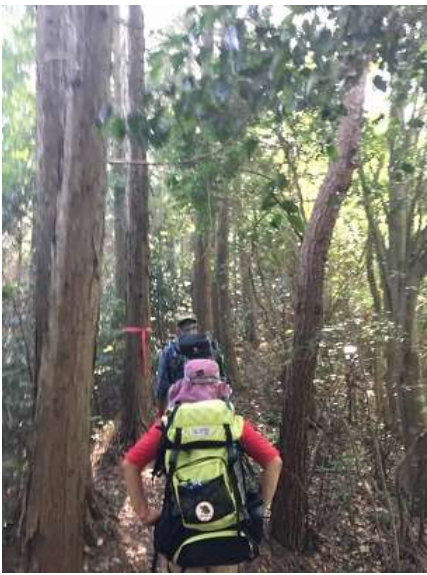
31. 山頂も近くなり急登も少し落ち着いたかな？