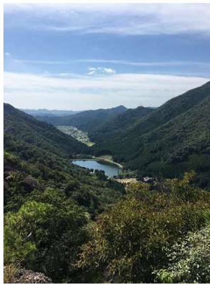
17. 登山口の池が良い雰囲気で見える