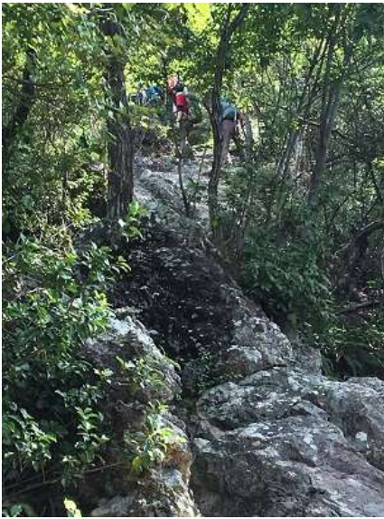
10. 岩場がまだまだ続く。奥山三角点はまだ？