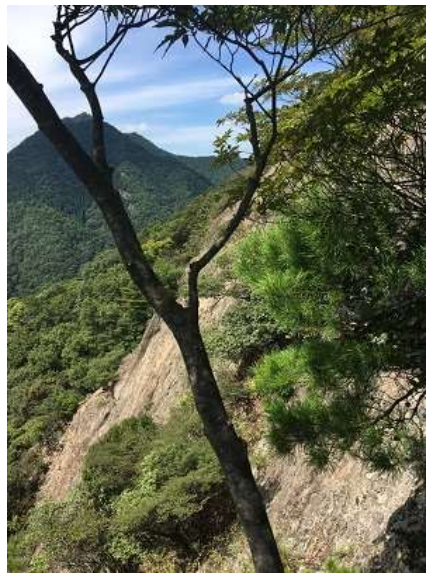
23. 落ちたら最後、下まで行くな。。