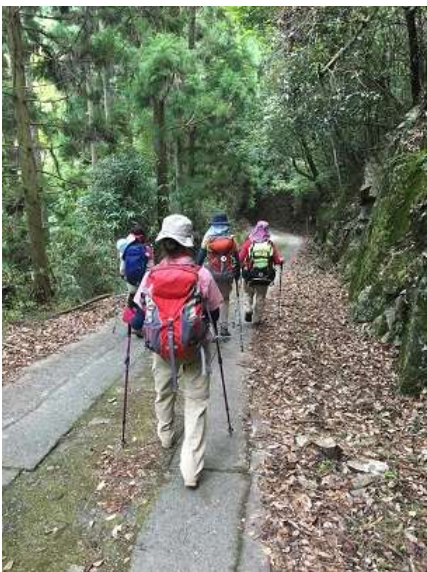
43. ここから3km延々と歩く