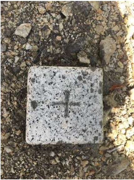
19. 奥山三角点に到着 キティ山岳会作の看板を撮り忘れ