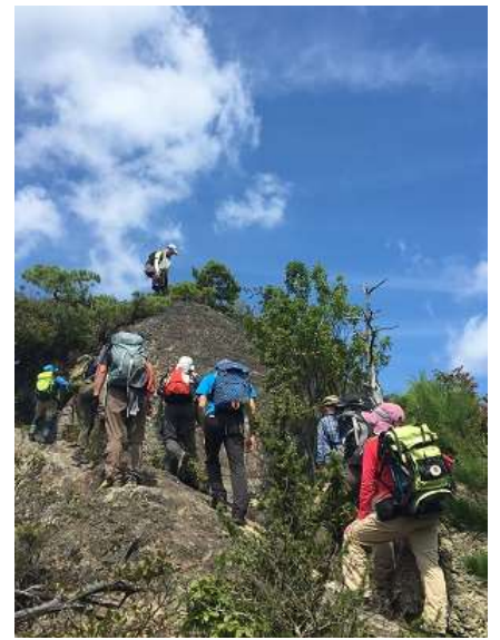
15. 足元気を付けて！ちょっと渋滞気味となる