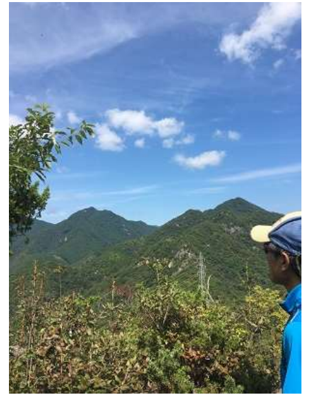
12. 見晴らしの良いところに出てきました