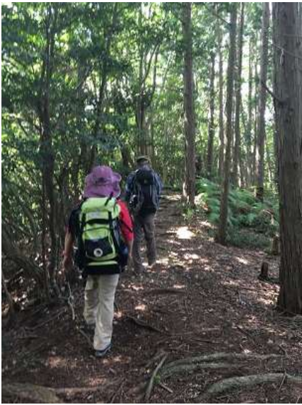
28. 120mの激下りの後、しばし休息？