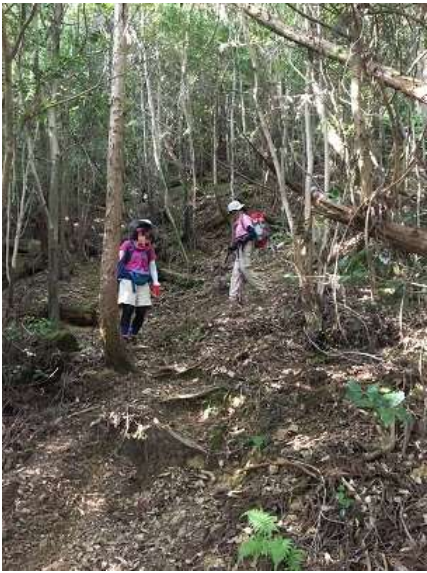
37. 激下りを約30分 お疲れ様でしたあ