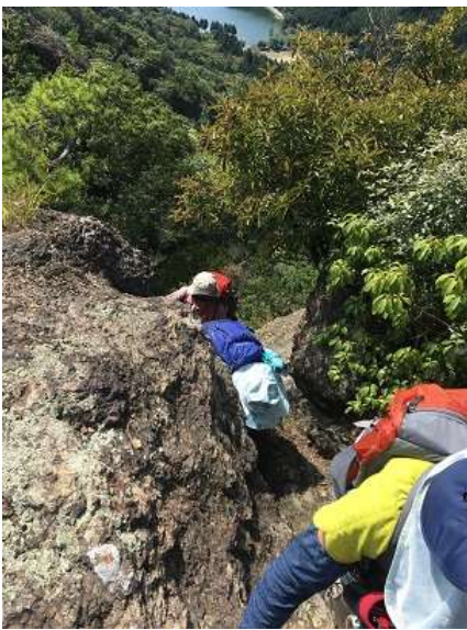
16. 一人ずつ3点歩行でゆっくり登ろう