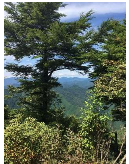
27. 木が邪魔で、眺望は良いとは言えませんね