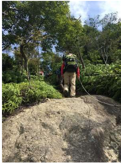
11. 三角点に着いたかな？