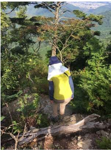
34. そこを降りるとつなぎ岩を見ることができる