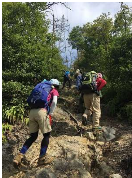
8. 登っても登っても急登で、岩 場が続く