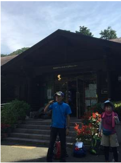
1. 本日のスタートは福島町立青少年野外活動センター