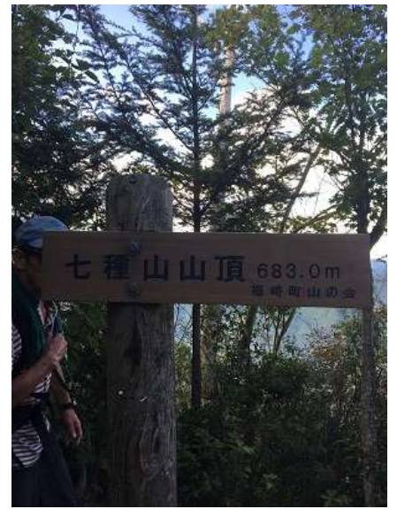
33. 七種山山頂に到着