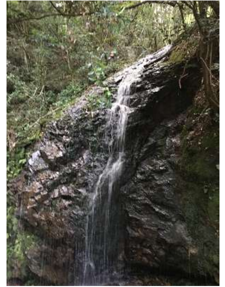
42. ゆっくり登山ではなく、観光に来て面白いかも。