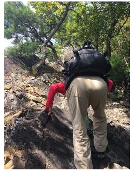
24. とにかく壁は巻きます