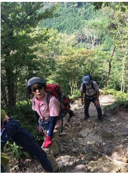
7. まだまだ急登は続きますよ～