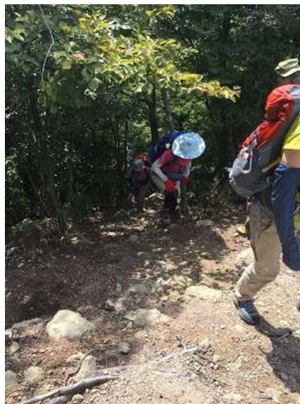
26. ようやく山頂に到着ですよ ～