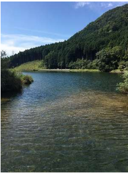
4. 風のない日はこの池に七種槍 が映るとのこと