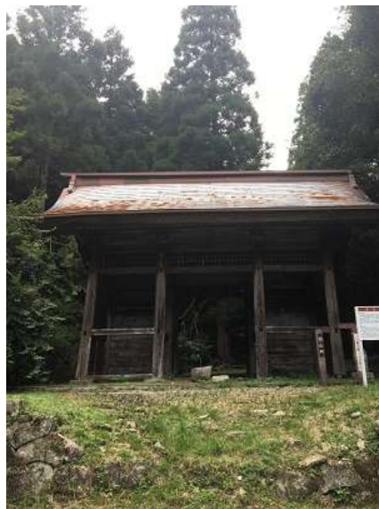
44. 旧山門 味わい深い雰囲気 の山門