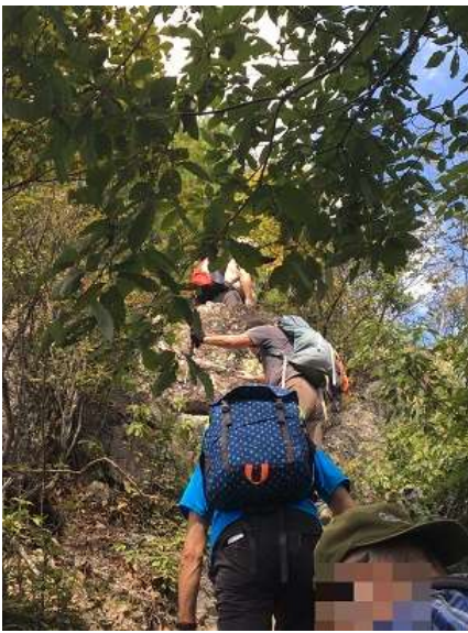
13. しかし、まだ登りは続きました。