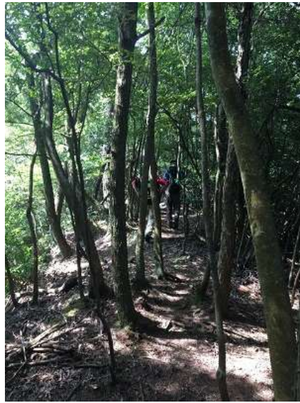
29. 徐々にまた登り始める