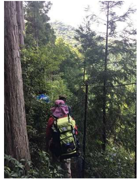
30. 一部細い道となっており、半袖だと傷だらけに（笑）