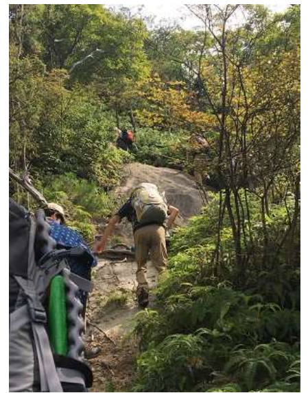
9. さらに岩の大きさが大きくな っていく