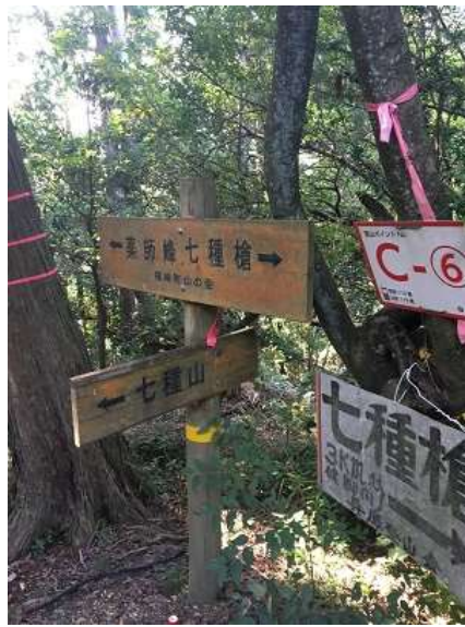
32. 薬師峰、七種槍、七種山の分岐点