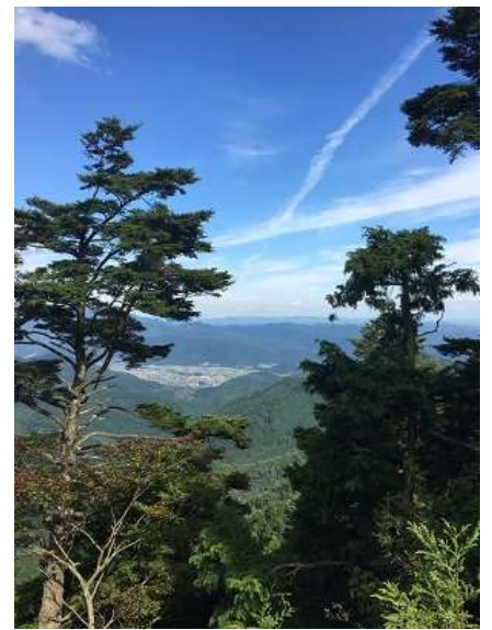
36. ここも木が邪魔で眺望もあまり良くないかな？