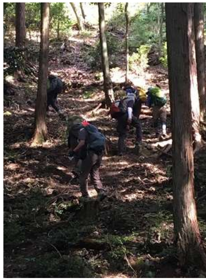
5. 登山口なのにいきなり急登が 始まる