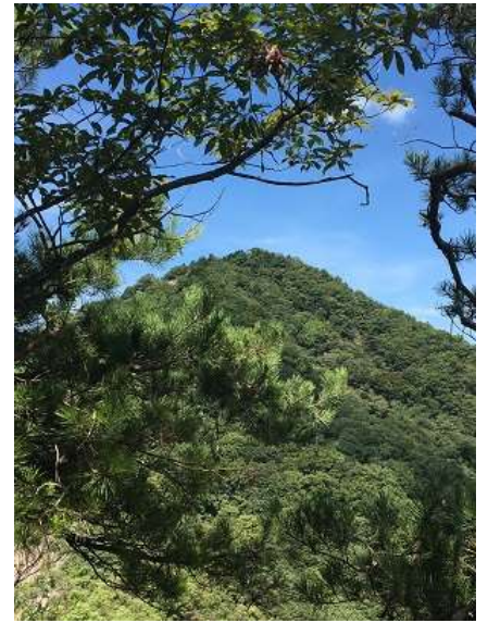
21. 目指す山でしょうか・・・