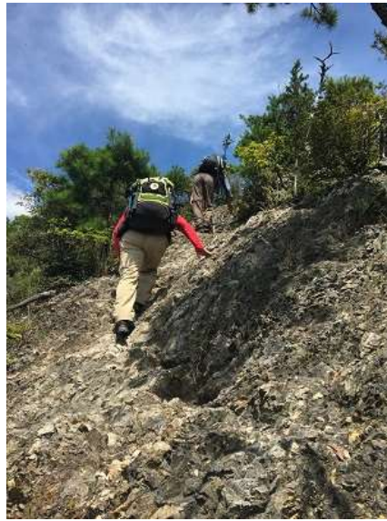
20. 七種槍はまだ先 足を滑らせないように歩るこ