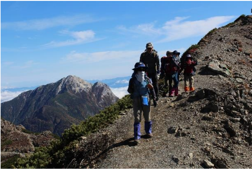
9. 仙丈ヶ岳山頂に向かう