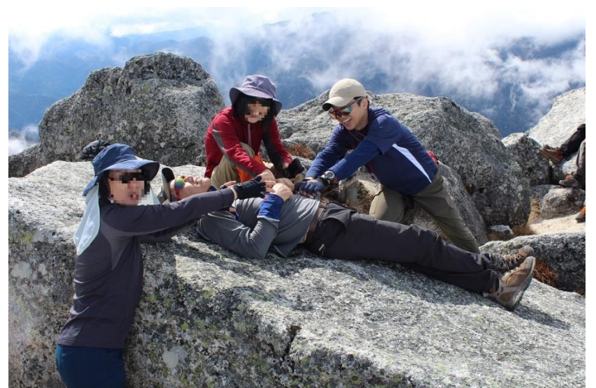
4. 甲斐駒ヶ岳山頂にて