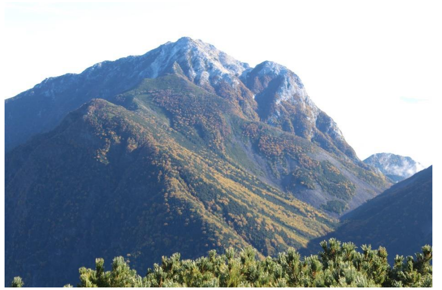
6. 仙丈ヶ岳から甲斐駒ヶ岳を遠望する