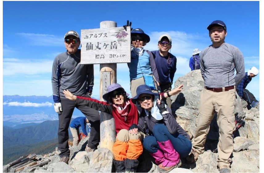
10. 仙丈ヶ岳山頂にて