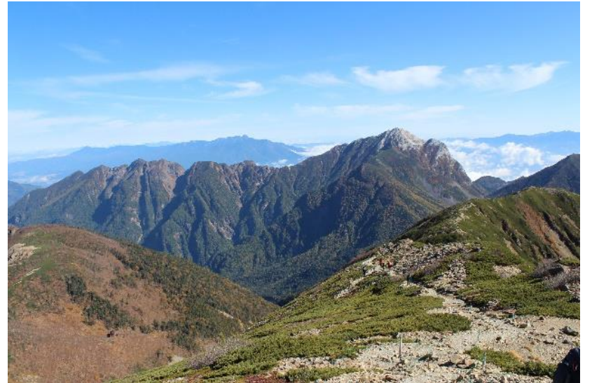
8. 甲斐駒ヶ岳とその奥に八ヶ岳を望む