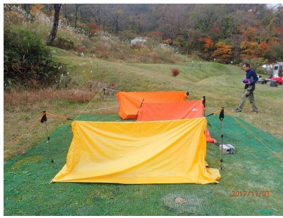
26.うまく張れたかね