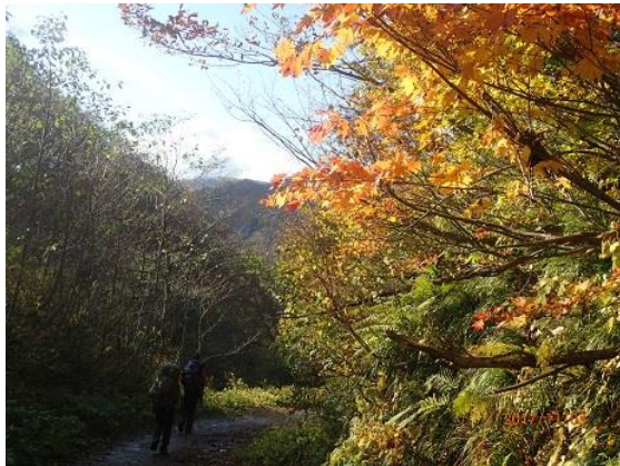
19.時間の都合で三ノ峰へは行かず