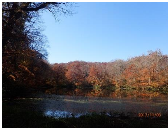
11.台風の影響で落葉していた