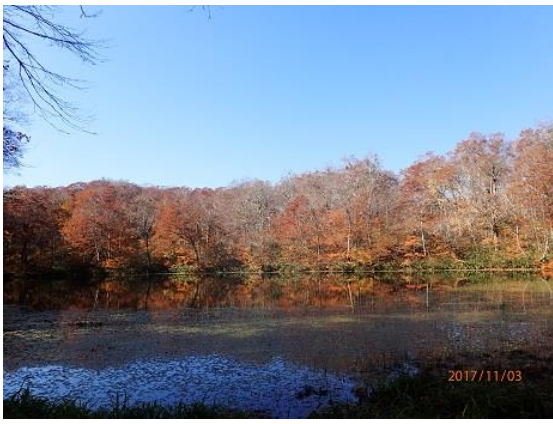
10.水面に映る木々が美しい