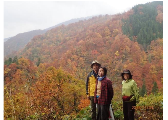
30.雨が止まないの別山行きも中止