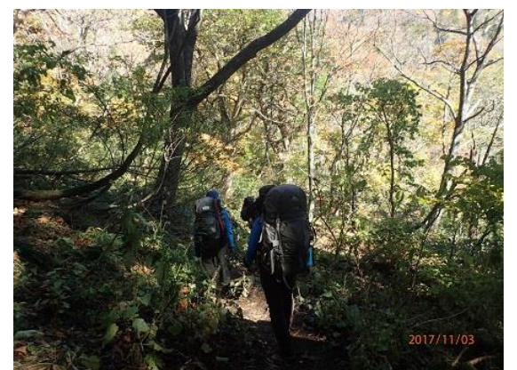
3. 刈込池に向かって出発