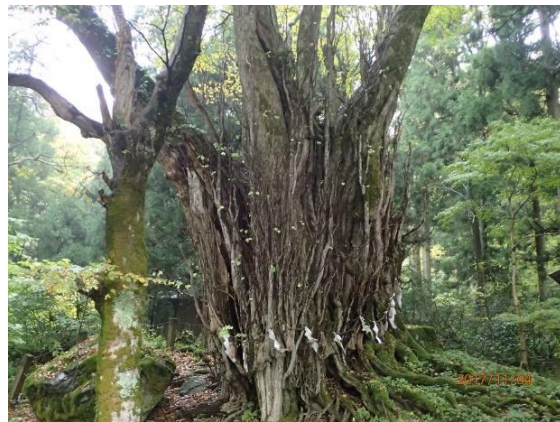
32.白山神社の大カツラ