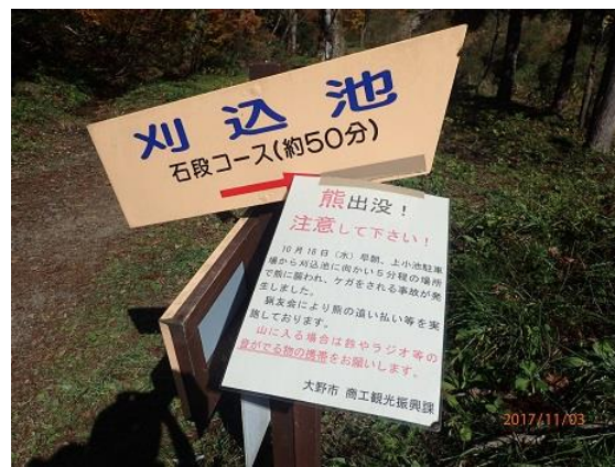
5. 山岳会は石段コースを行く