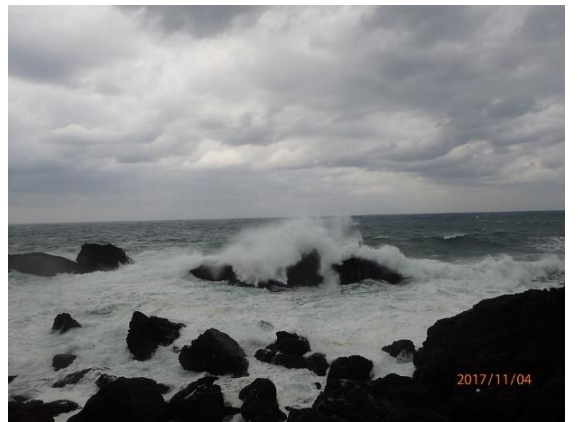
36. 荒波を見ながら海鮮丼をいただきました