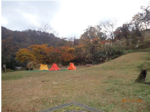
28.この辺りにクマが出たそうな(怖)