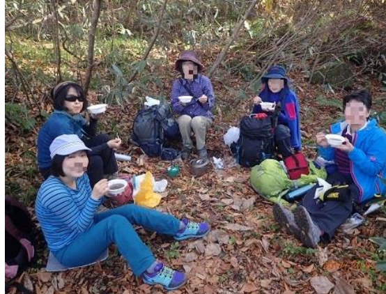
14.日帰り組の女子会