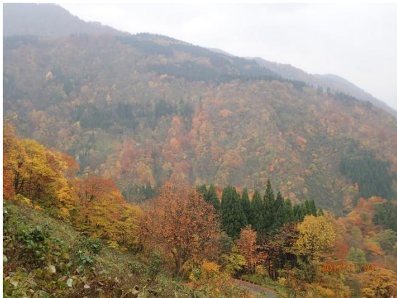
31.また来れるといいな