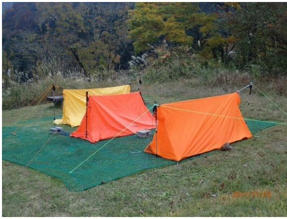
25.ツェルトに寝ます