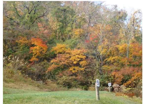
24.避難小屋へ行かずテント場へ