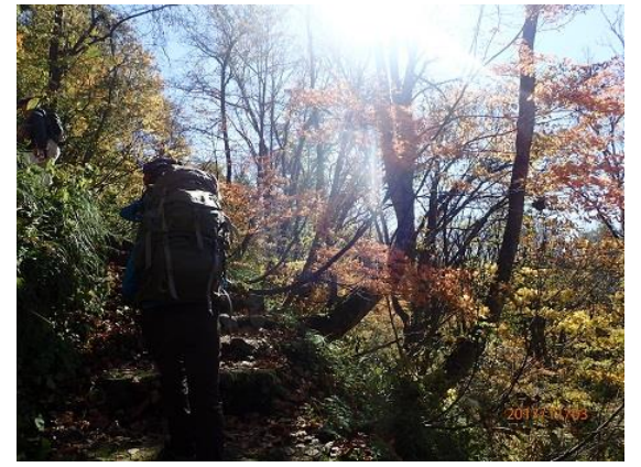
6. 約680段の階段はきつい