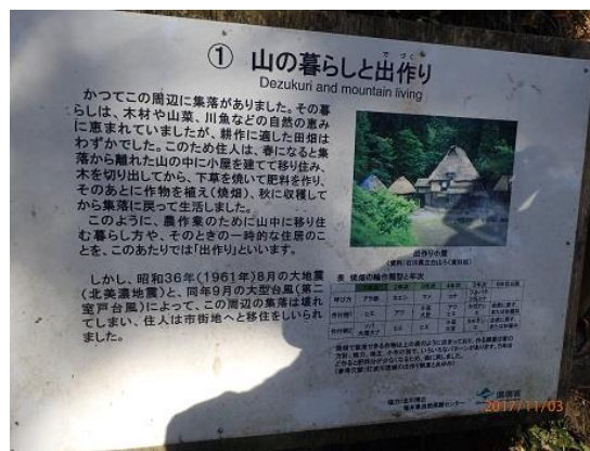
2. 登山口周辺には昔集落があった