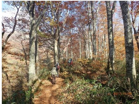
17.ブナの原生林が美しい