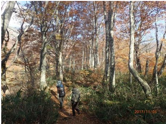
16.下山は岩コースへ