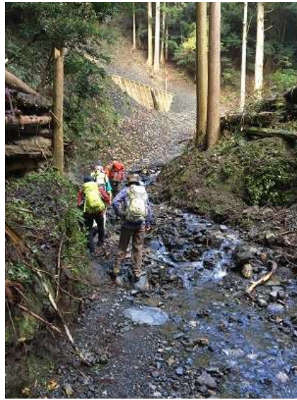
11. やはり夏に來ると涼しそう ～