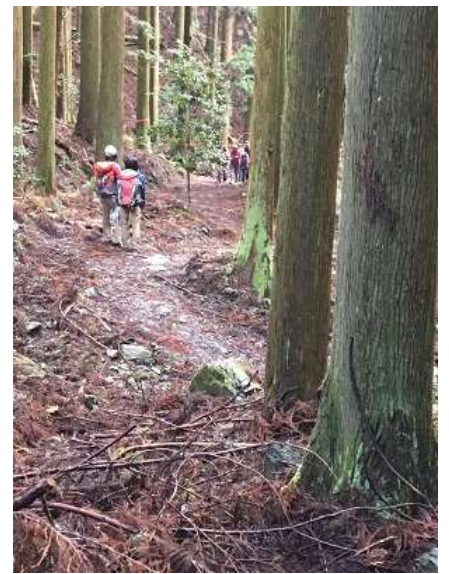
9. 後続チーム 少しばらけてますよ～