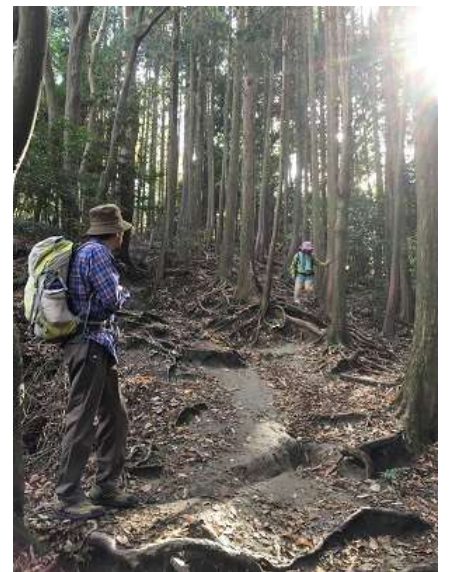
18. 火床へ向かうも、足元があ まり良くなかった。