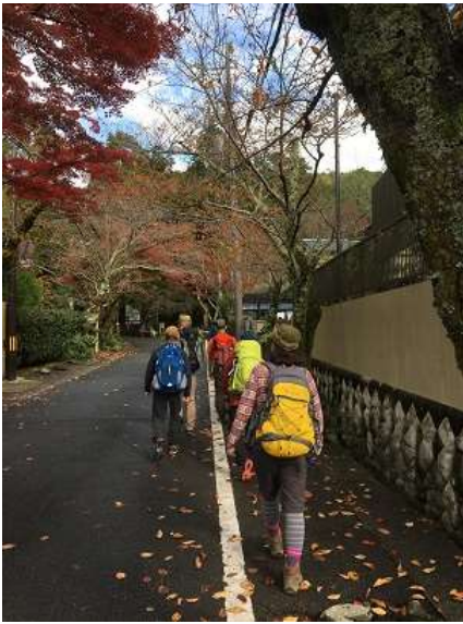
1. JR山科駅を出発し、毘沙門堂門跡へ移動