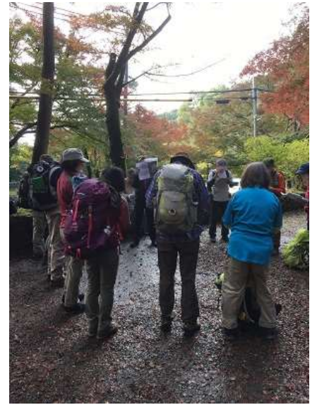
3. リーダーの本日の山行計画の説明