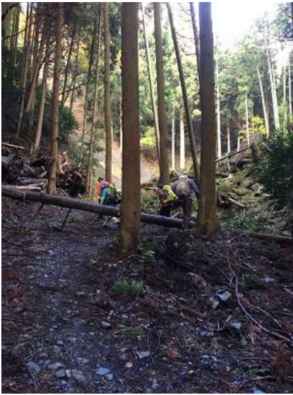
10. 先日の台風の影響?所々倒木がありました。