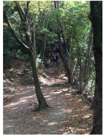
21. 間もなくゴール地点。銀閣寺ですよ～。