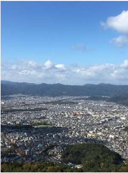
19. 火床に到着。京都市街も綺麗に見えます。