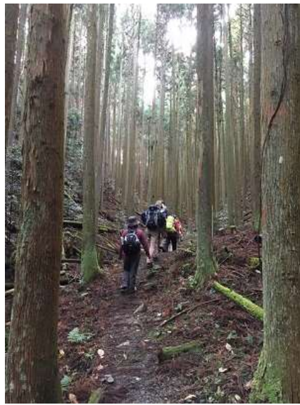
14. 尾根筋にでるまでラストス パートですよ～