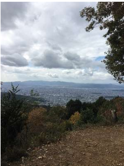
16. 大文字山山頂までくると京 都市街が見渡せます。