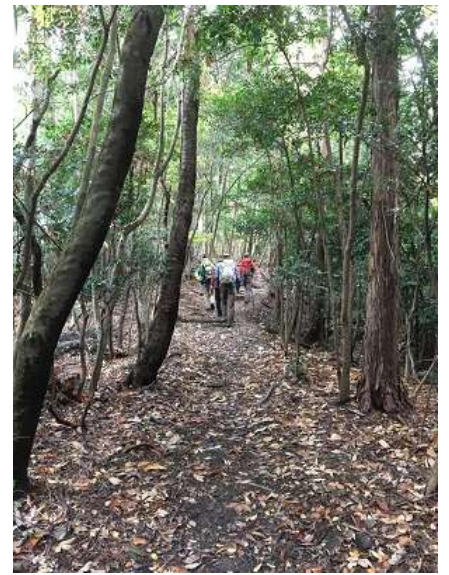
15. 尾根筋に出てきましたが、 眺望は望めませんでした。