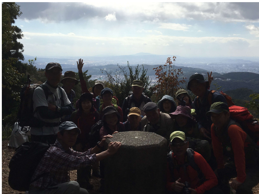
大文字山山頂にて

今回の四人一組例会は秋の紅葉を楽しみに京都大文字山へ登りました。集合時間通りに参加者はJR山科駅に集まり、予定通りに出発。まずは毘沙門堂門跡に立ち寄り、リーダーより本日の登山スケジュール、コースの説明。リーダーが2度下見していただいたこともあり、登りは緩やかで周りの景色を楽しみながらの山行となりました。景観は山頂まであまり望めませんが、春は春の良さ、夏は夏の良さ、秋は秋の良さが楽しめるルートではなかったかと思います。大文字山山頂は人も多く、すぐに、大文字火床へ。火床にて昼食を取り、銀閣寺へ。火床から銀閣寺への道は急で足元に注意して下りました。登りだったらきつかったでしょうね。銀閣寺まで降りて、山門の所で解散。希望者はそのあと南禅寺までの街歩き。哲学の道を通って永観堂・南禅寺へ。ところどころ紅葉を楽しみながら、南禅寺山門に到着。