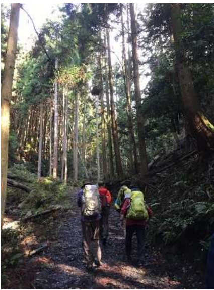
7. このチームはリーダーがガイド。色々教えて頂きました。