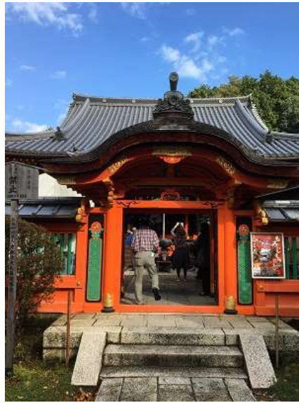
2. 毘沙門堂門跡へ入る会長