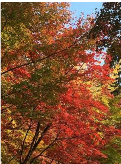
25. 同じく永楽堂の紅葉です。