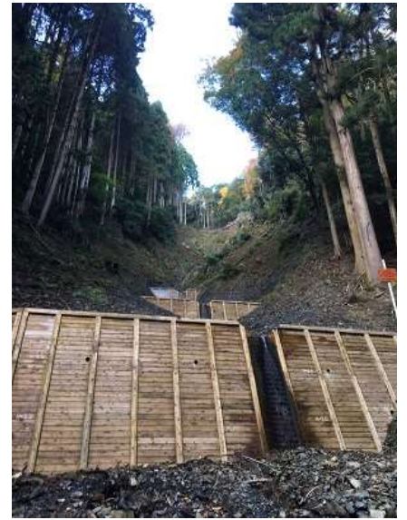
12. 綺麗な木の堰堤の3連弾。 昨年作られたようです、