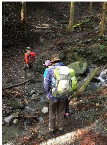
8. 渡渉もあります。夏に来れば涼しいかも？