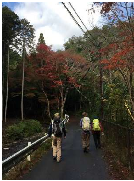
5. 紅葉は11月下旬ごろが旬でしょう。