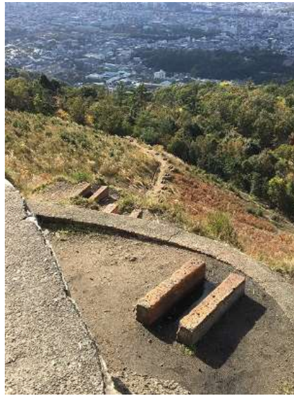
20. 右下に向かう火床。