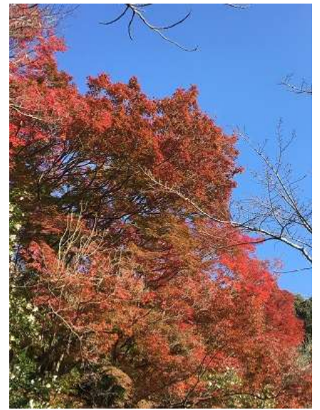
24. 永楽堂の紅葉はキレイかったです。