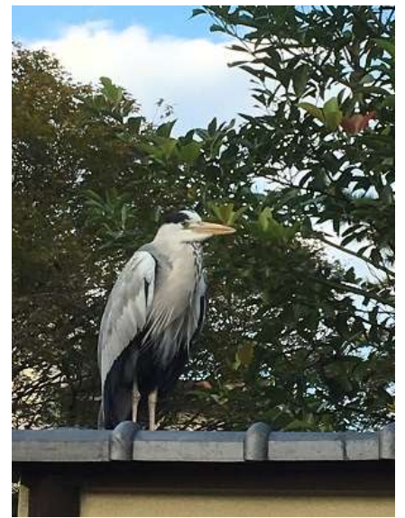
27. 本日の2人目の特別参加者？