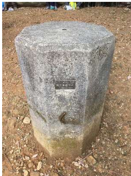
17. 測量に使うのだろうか?何 なんだろう?