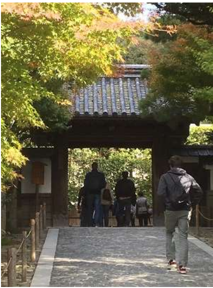
22. 銀閣寺山門です。ここでいったん解散です。