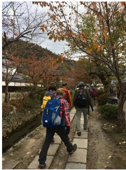
23. 希望者は哲学の道をここから歩きます。