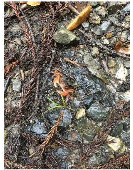
6. 本日一人目の特別参加者 沢蟹ちゃん