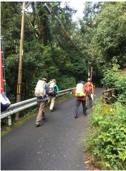
4. 大文字山登山口に入る。最初はアスファルト道でした。