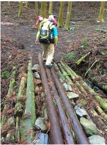
13. 滑って転びそうな橋。恐る 恐る渡ってました。