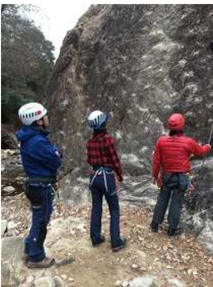
16. スタッフと受講生が上を見 ながら指示を飛ばす。