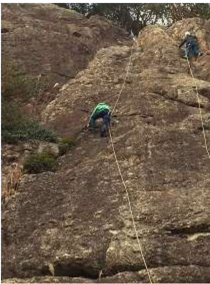
25. 2本目は皆さん軽快に登っておられる。