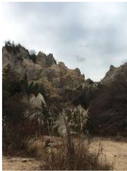
8. こちらを登るわけではありません。