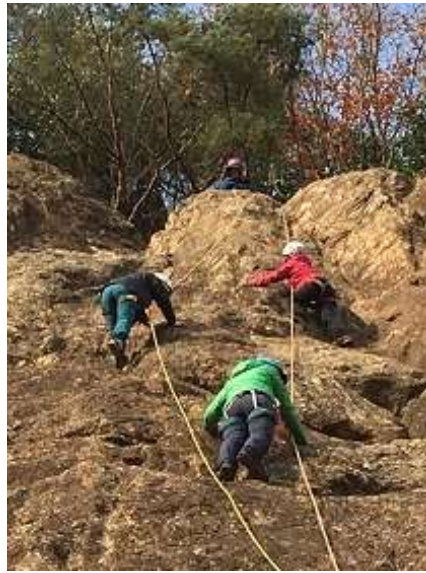
20. ラストの所で手こずってます。