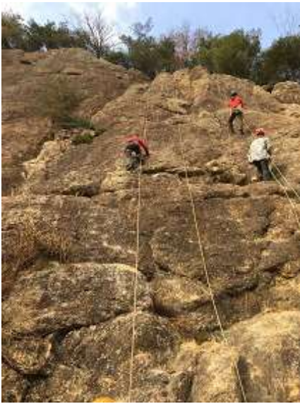
19. 大屏風岩です。スタッフさんがスタンバイ中。