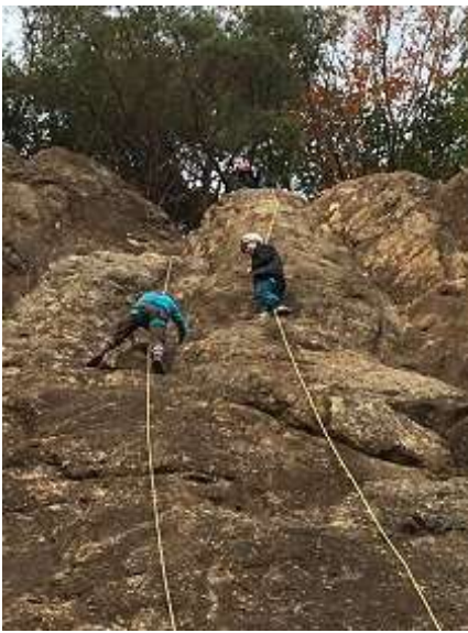
22. そこまで行けば後は淡々と登るだけ。