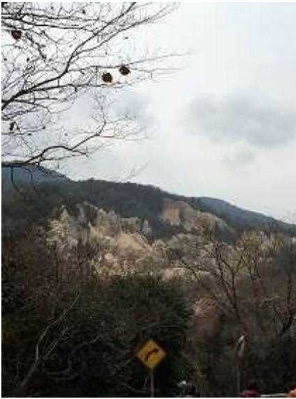
1. 本日の実技会場 蓬莱峡。