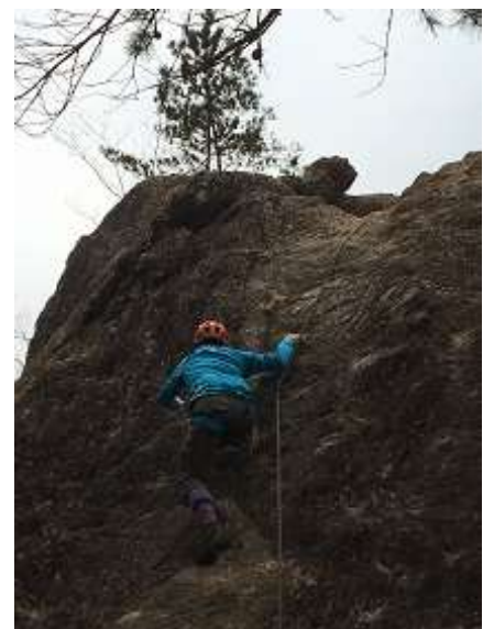
18. 5 人目の受講生。経験者? 平気で難ルートを選択。