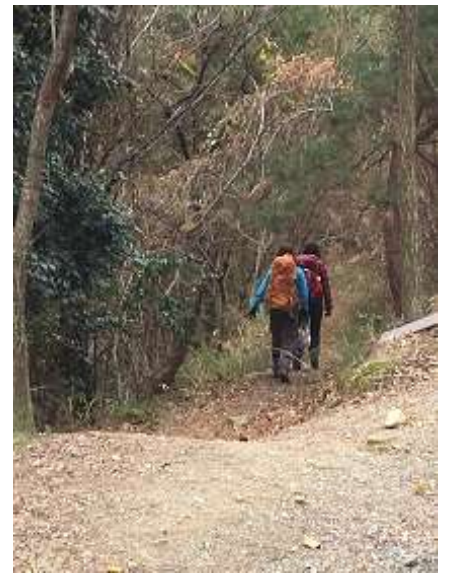
6. 沢に向かい始めました。