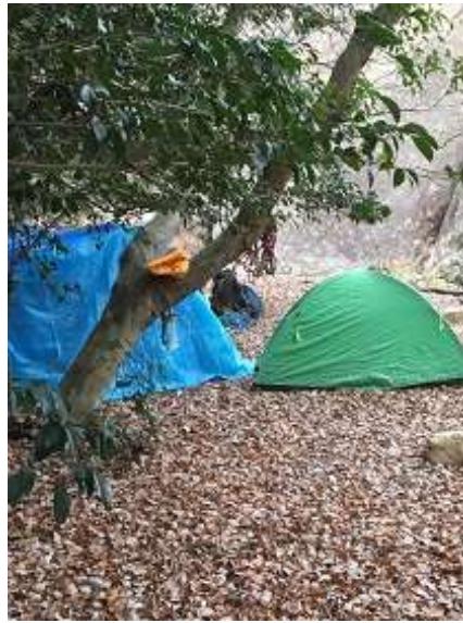
11. テントが張られていたこの 場所が、本日の会場です。