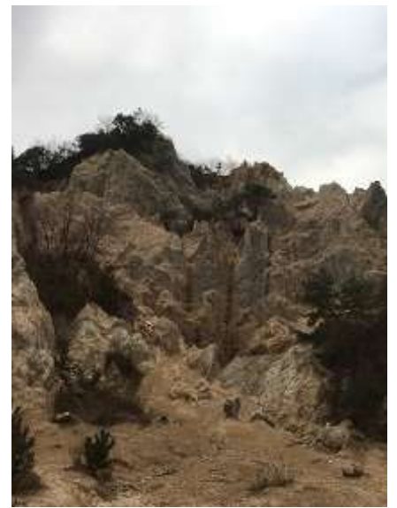
27. また、来ます。今度はトップロープクライミングだ！