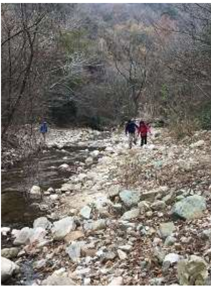
7. 渡渉に手間取ったのかな？。