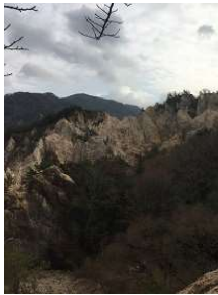
23. 大屏風岩から下りる前に景観撮影(▽^)/。