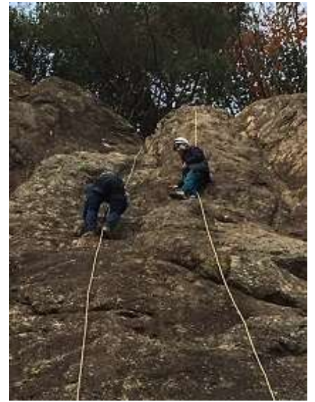
21. そばで経験者の指示がもらえるのは心強い。