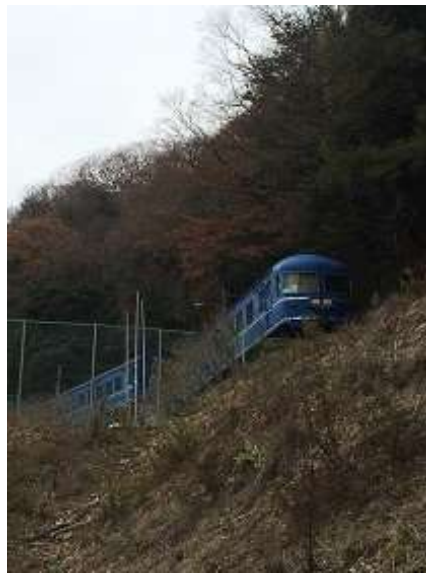
5. なんでこんなところに特急列車が・・・？