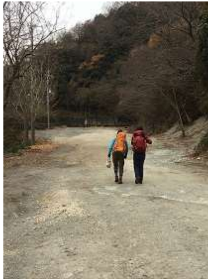
2. 淡々と会場に向かう二人。