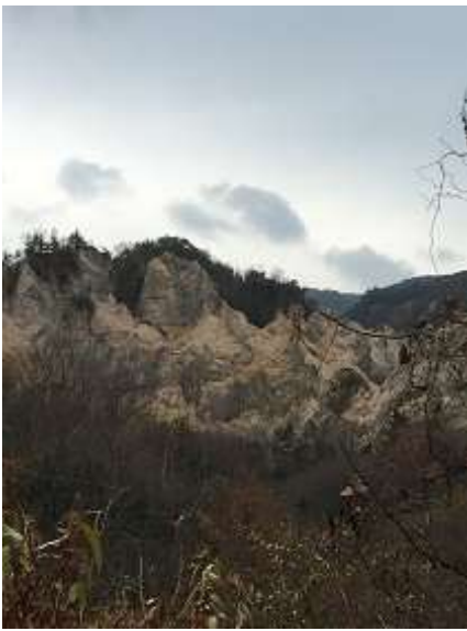
4. ドキドキ・バクバク 蓬莱峡がどんどん近づいてきます。