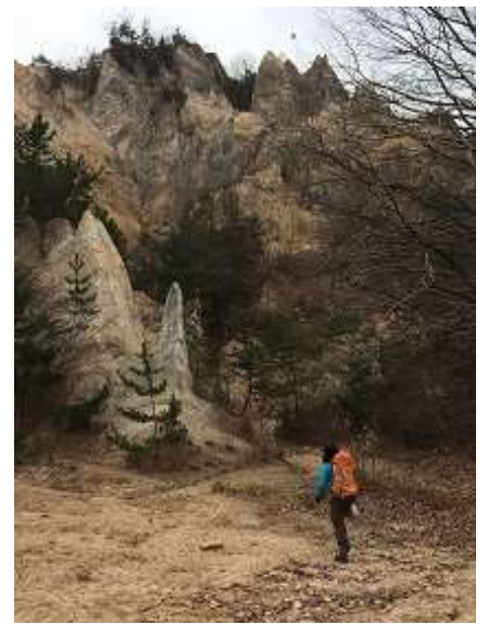
9. 登ろうとしている？いえいえ、道を探してます。