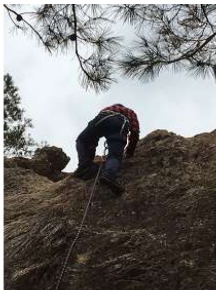
17. 4 人目の受講生。気づくと 登り切っているって感じ。