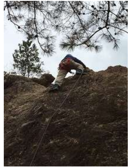
12. 一人目の受講生。わんぱく 坊主を思わせる登り。