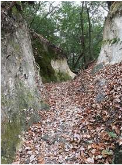
10. あっ 道らしきところまで きてきました (笑)。