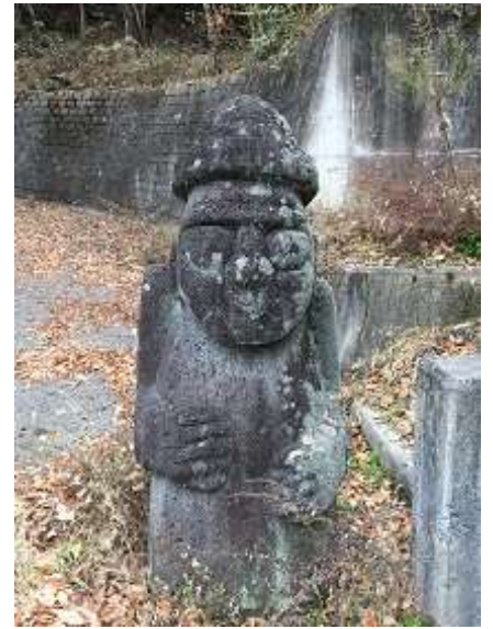
3. いったいなんの石造でしょうか。濟州島関連？との噂も