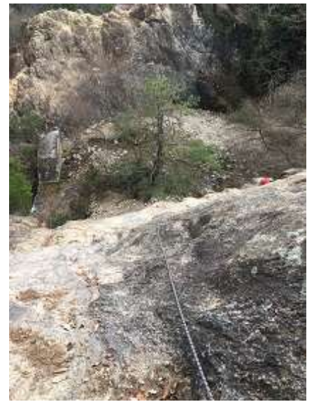
24. えっ？ これを下るの？ 実は階段状になってます。