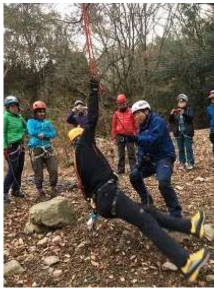
26. 終了前にビレイの練習。