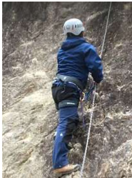
14. 三人目の受講生。この方は 淡々と登り切る。