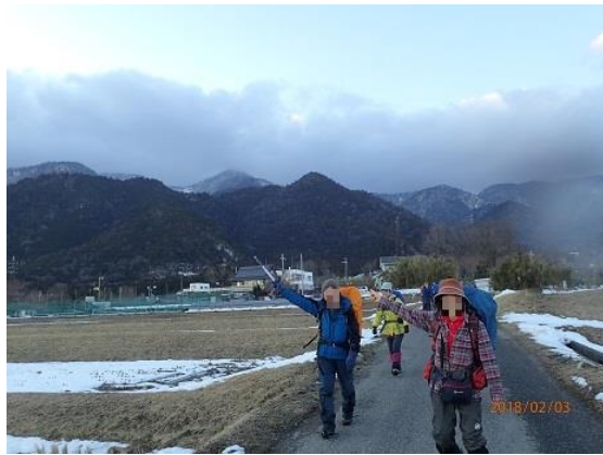
17. あの山登ってきたんだぜ～