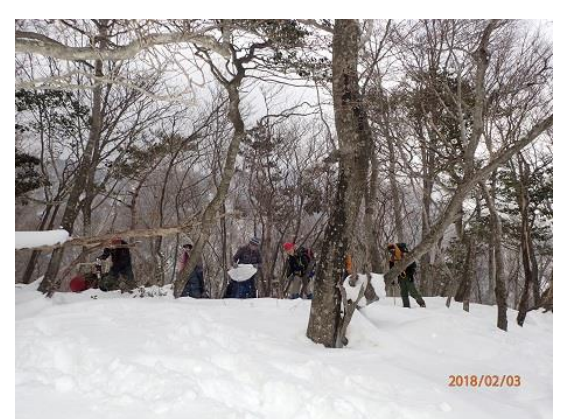
9. 稜線の平坦地に出て雪上トレ