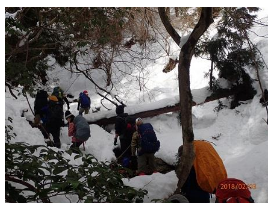
8. 谷筋の急登をジグザグ登ります