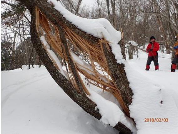
13. この酒方！訂正、裂け方！