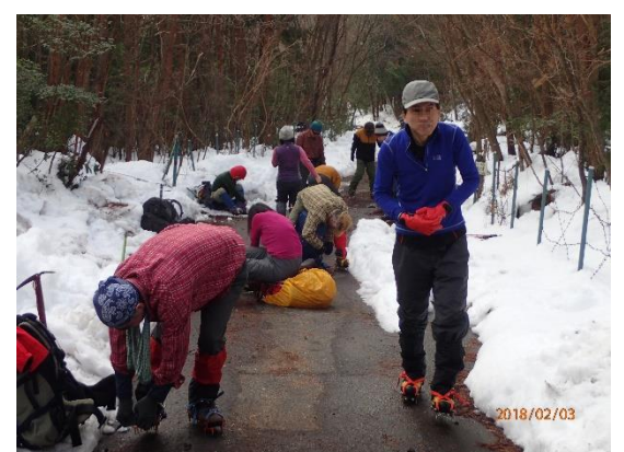
3. 登山口にてアイゼン装着