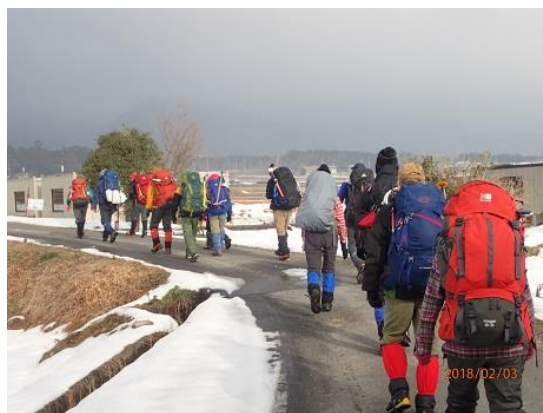
2. 3班に分かれて出発