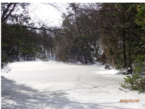
7. 池も凍って真っ白です