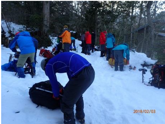
16. アイゼンを外します。お疲れさまでした