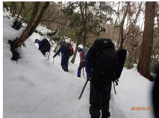
5. 雪はたっぷり。ノタノホリ目指します