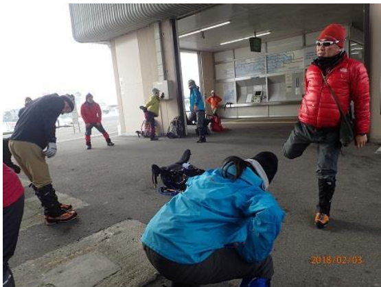
1. 比良駅にてストレッチ