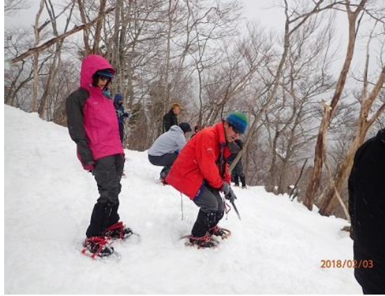
14. 尻セードはこうでグリセードはこうやねん