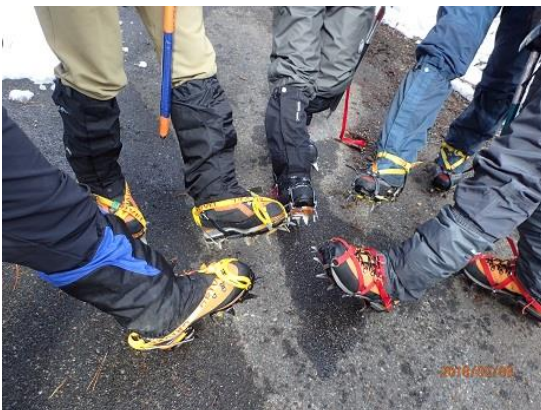
4. 受講生も着けられました