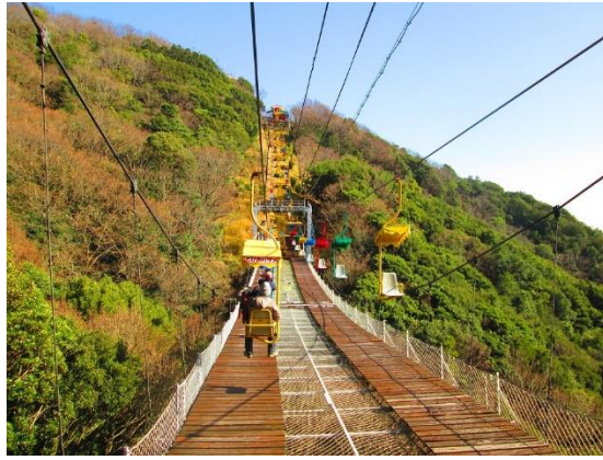
29. 帰りは〇〇飲みの三人だけリフトに乗った