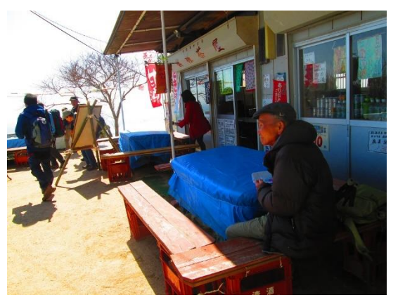
21. 旗振茶屋に到着。現地集合の〇さんと合流