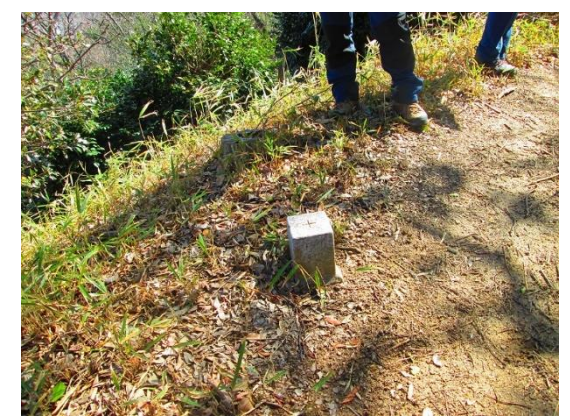
5. 禅昌寺への分岐の少し上がったところにある三角点(154.6m)