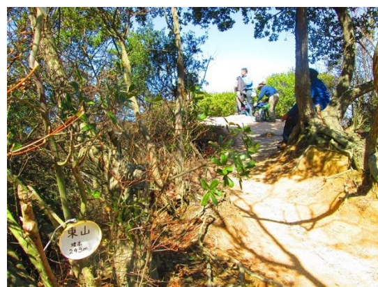
7. 東山(横尾団地への分岐)に到着