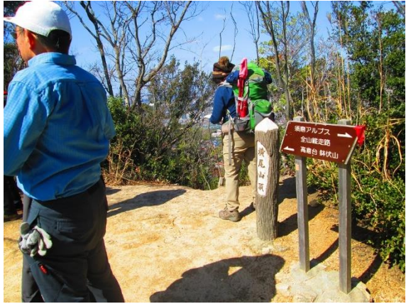
13. アルプス?越で横尾山に到着