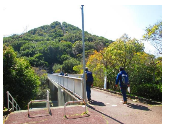
18. 高倉台から鉄拐山方面へと進む