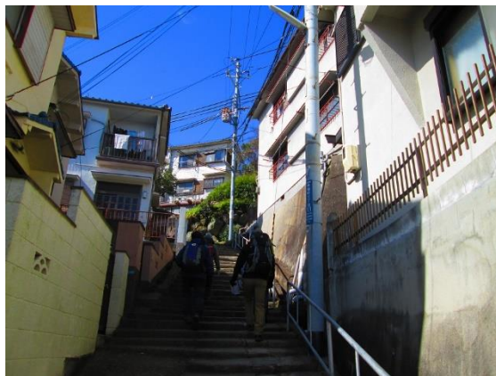
2. 板宿八幡神社への石の階段を登る