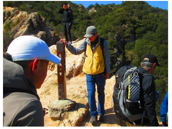
12. 須磨アルプス・馬の背に到着