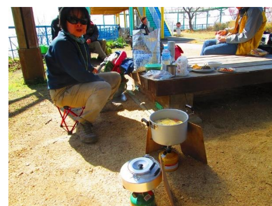
23. 今、豚汁作ってますよ〜・・・