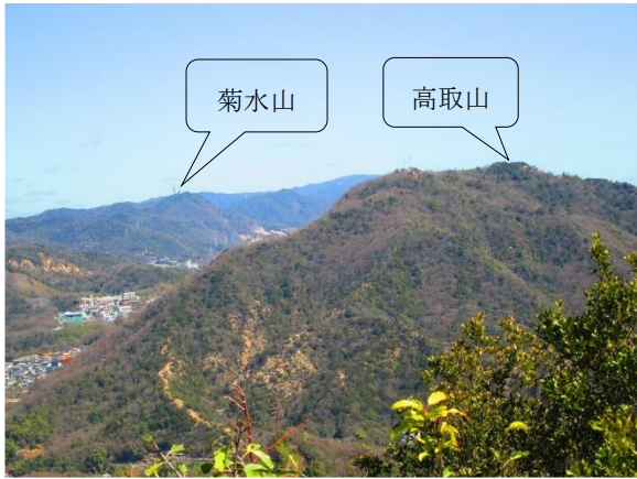
10. 東山から六甲全縦コースを遠望する