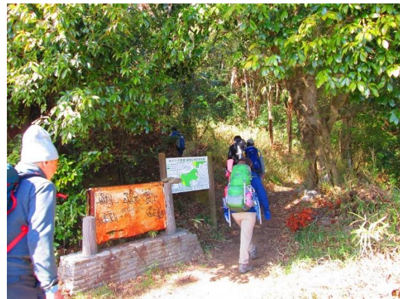
3. 神社横から登山道へと入る