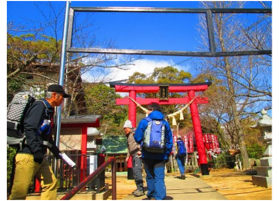
2. 板宿八幡神社に到着(標高約70m)