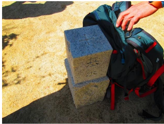
14. 横尾山の三角点 (312m)