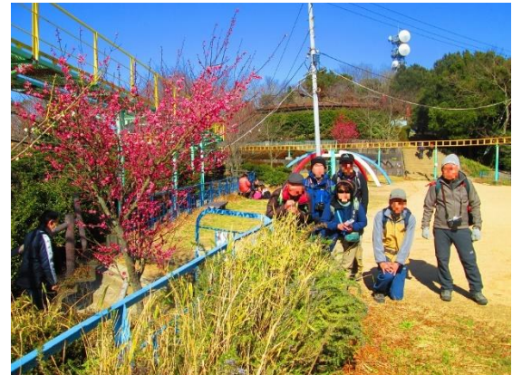
24. 宴の後、梅をメインにパチリ