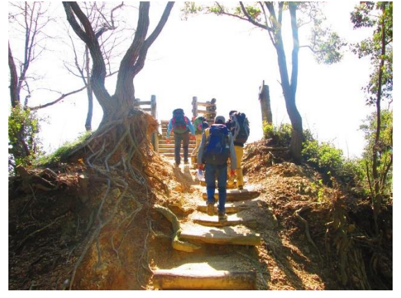
15. 木製の展望台がある柵尾山に到着。ここから高倉台に向けて激下りとなる