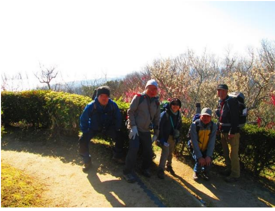
25. 梅と明石海峡大橋をバックに(大橋は映ってないかなあ～)