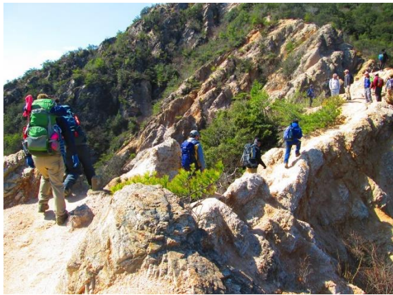
11. 須磨アルプスに入ってきた