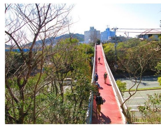
17. 高倉台への歩道橋を渡る