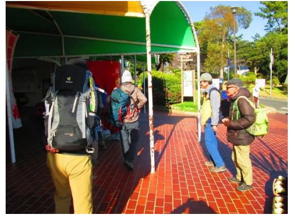
30. 須磨浦公園駅に到着 また来年も旬の春の自然を山で楽しもう!