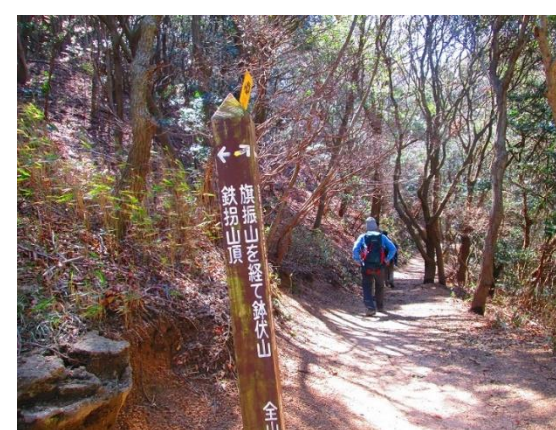
22. 時間の関係で鉄拐山はパスして進む