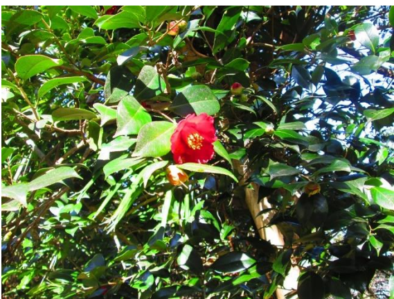
6. 登山路にはあちこちにヤブツバキが咲いていたが、春を迎えていよいよ最後かな・・・