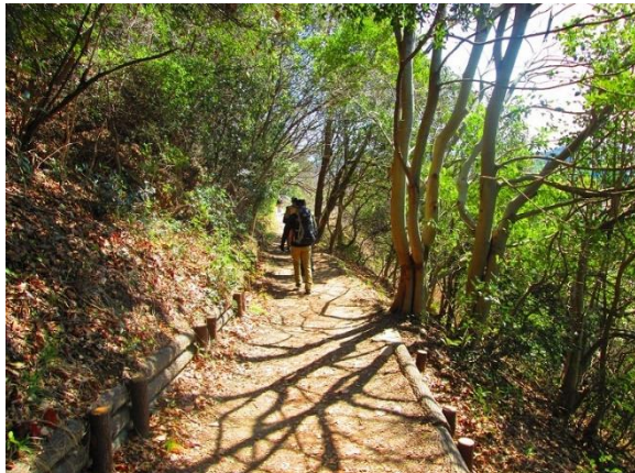
16. 長い階段の後、水平道を進む