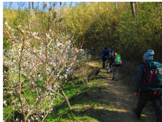
4. 登山道に入って暫くして、いきなり梅の花が迎えてくれた