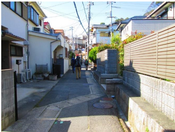
1. 板宿駅近くでコンパスを八幡神社に合わせ、北西方向へと街中を進む

板宿から六甲全縦コースへと合流するルートは展望が良く、素敵な良い登山道だった。今回は通常の六甲全山縦走路を逆行して歩く形となり、いつもと見る景色が違って新鮮な感じを受けた。また、読図・コンパスの使い方の実習も兼ねて行なったが、一寸中途半端に終わってしまったかな?