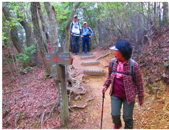
11. 釈迦岳を後にポンポン山へと向かう