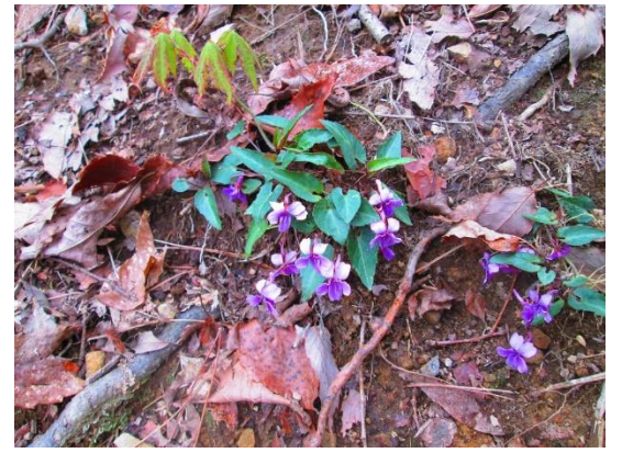
12. 可愛いスミレの群落