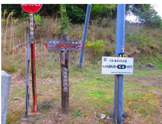
23. 集落近くの車道に出る