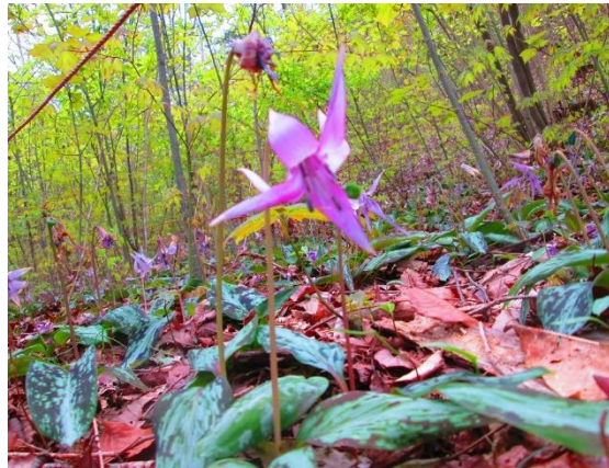
14. これがカタクリですよ