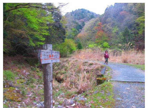
21. 下山は往路を行かず、杉谷の集落をめ ざす。後半はこんなゆるやかな道