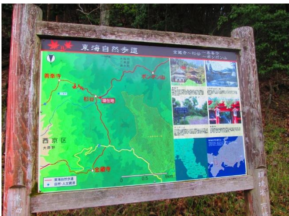
22. 登山口にある案内板