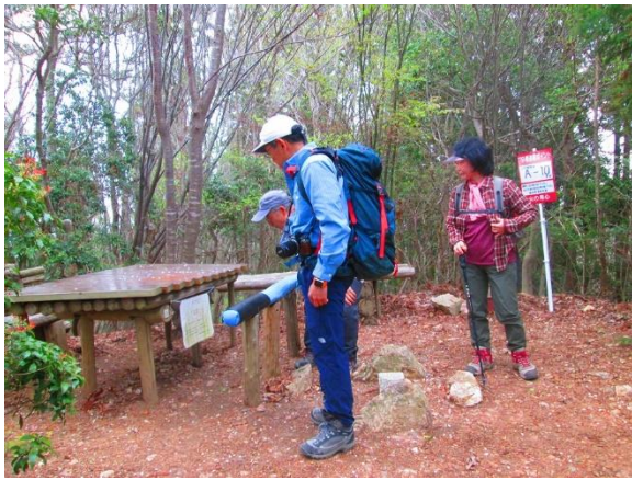
10. 釈迦岳頂上に到着 木のテーブルがあり、ここでランチにしました