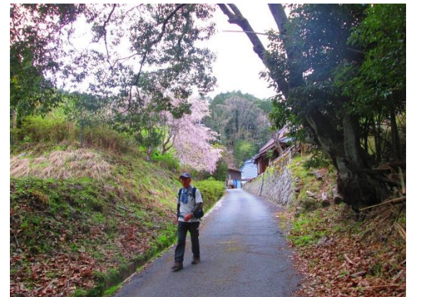
24. 遅咲きの満開のシダレザクラの横を通る