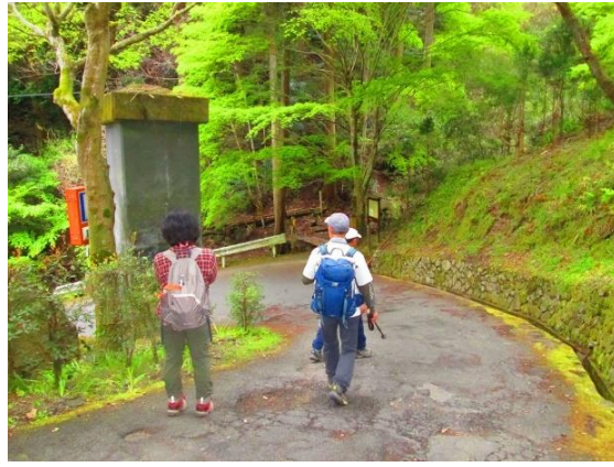
26. 釈迦岳への登山口に戻ってきて、ポンポン山ハイクは無事終了