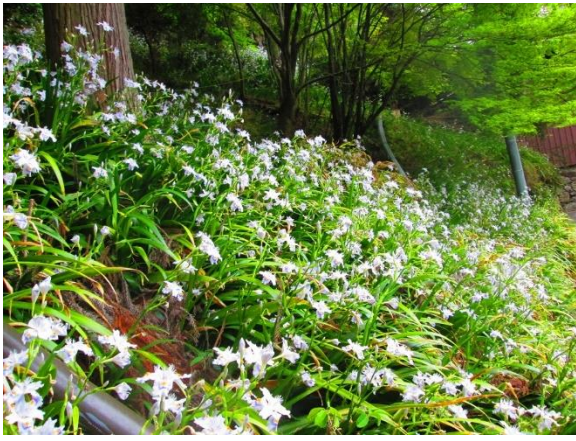
25. 善峯寺近くの山の斜面にシャガの大群落がありました。花は満開で圧巻でした