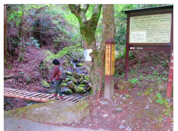
3. 登山口の沢を渡り、釈迦岳へと向かう