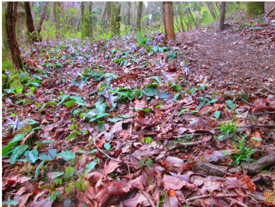
13. お目当てのカタクリの保護区に到着 カタクリがまだ咲いてくれました