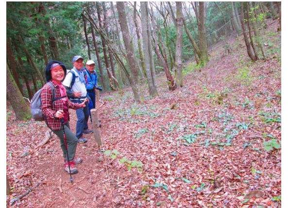
15. ロープで囲われた保護区