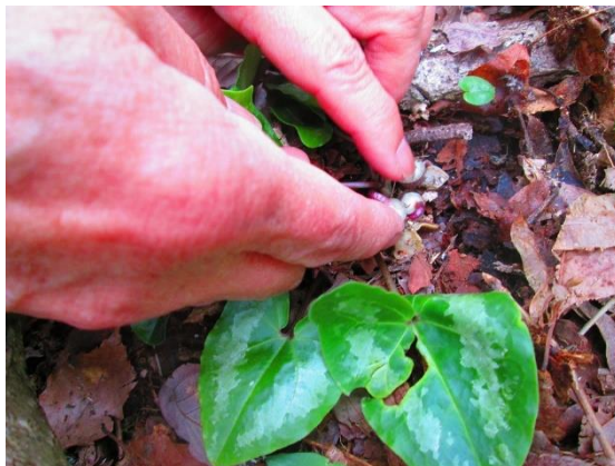
17. 指先にあるのがカンアオイの花 ほとんど土に埋もれています