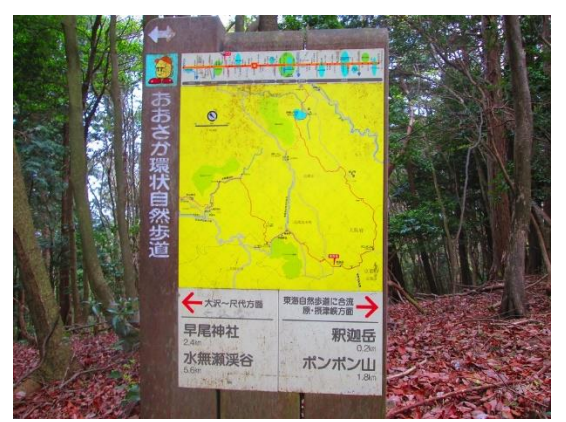
9. 釈迦岳まで 200mの表示がありました