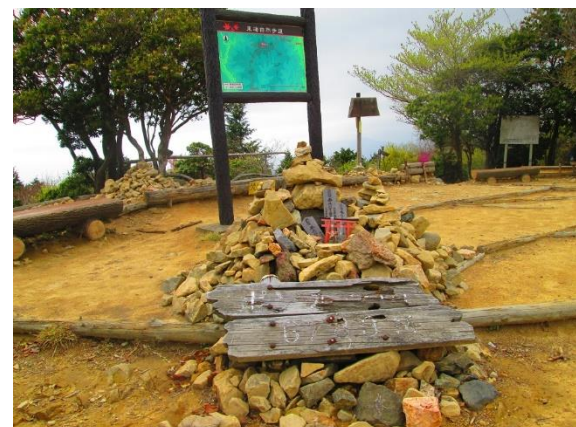
19. ポンポン山頂上に到着