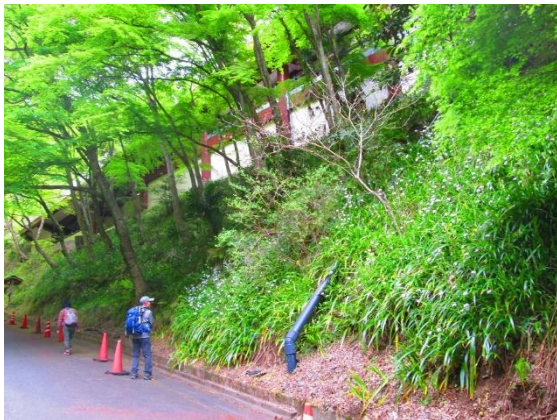
1. 善峯寺の境内には入らず、下の車道を進む

今回の平日ハイクは、春の山野草の花を楽しもうと企画した。今春はサクラをはじめとして花の開花が早いので、カタクリはダメかと思ったが沢山咲いていてくれた。そして、善峯寺周辺のシャガ群落の花は見事であった。サクラが咲く頃、善峯寺のサクラと山野草を目的にもう一度訪ねてみたいところである。