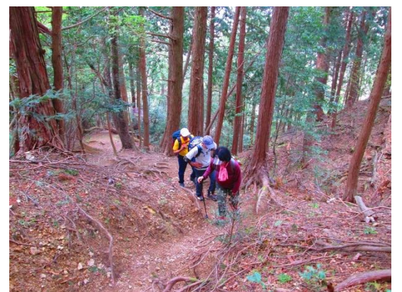
6. 杉の植林地の中の急登を進む