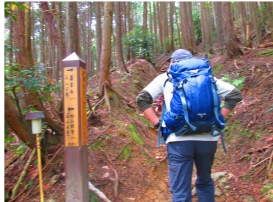
5. 展望所から急登が始まる