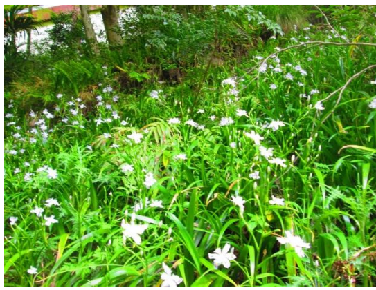
2. 善峯寺駐車場下の斜面のシャガの花が見事