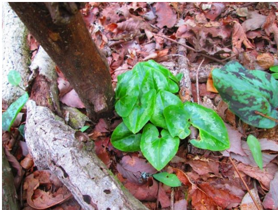
16. カンアオイも沢山自生していました