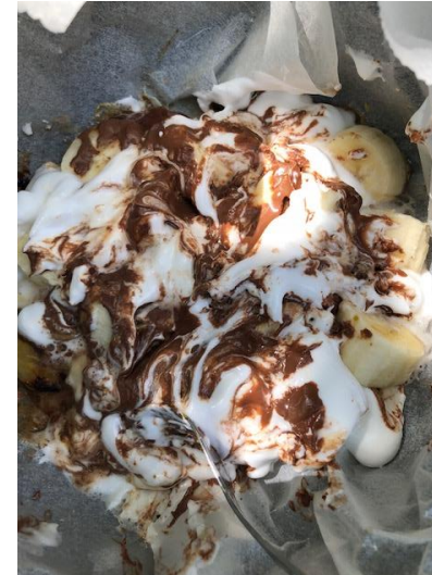
⑮ チーズケーキにチョコバナナ焼きマシュマロをのせる