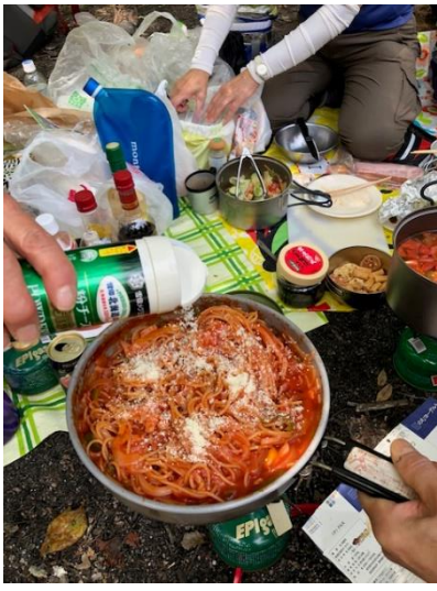
⑨ トマトジュースでパスタをゆでる