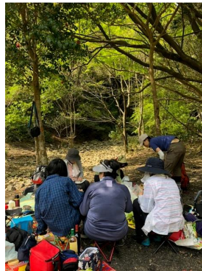
③ピストロのオープンです