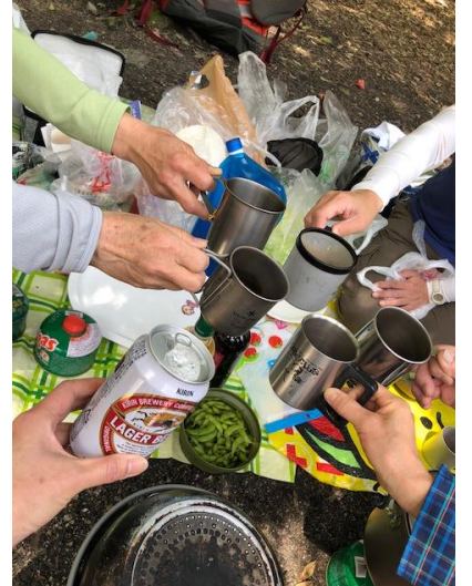
④調理の前にはまずはかんぱーい