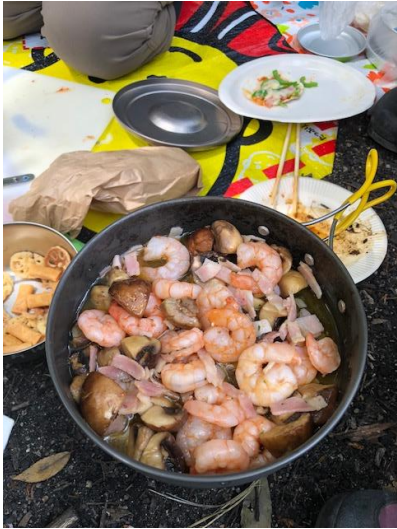
⑬ シーフードアヒージョ