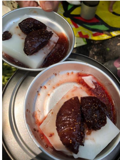
⑭ 杏仁豆腐いちじくワイン煮ソースかけ