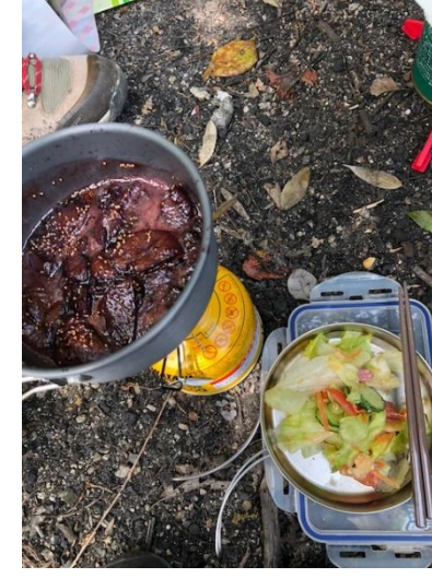
⑦サラダを頂いている間にいちじくワイン煮調理中