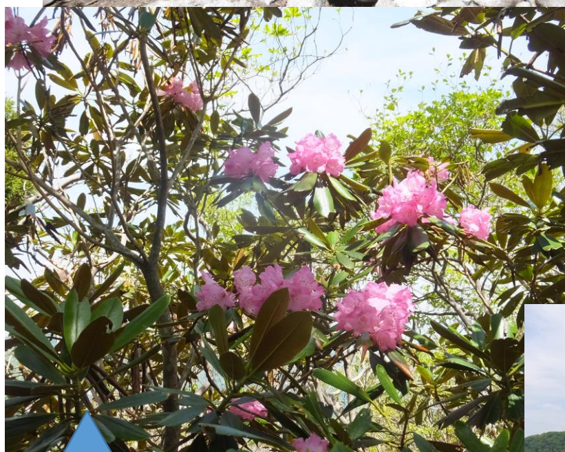
堂満岳直下に咲く シャクナゲ！！