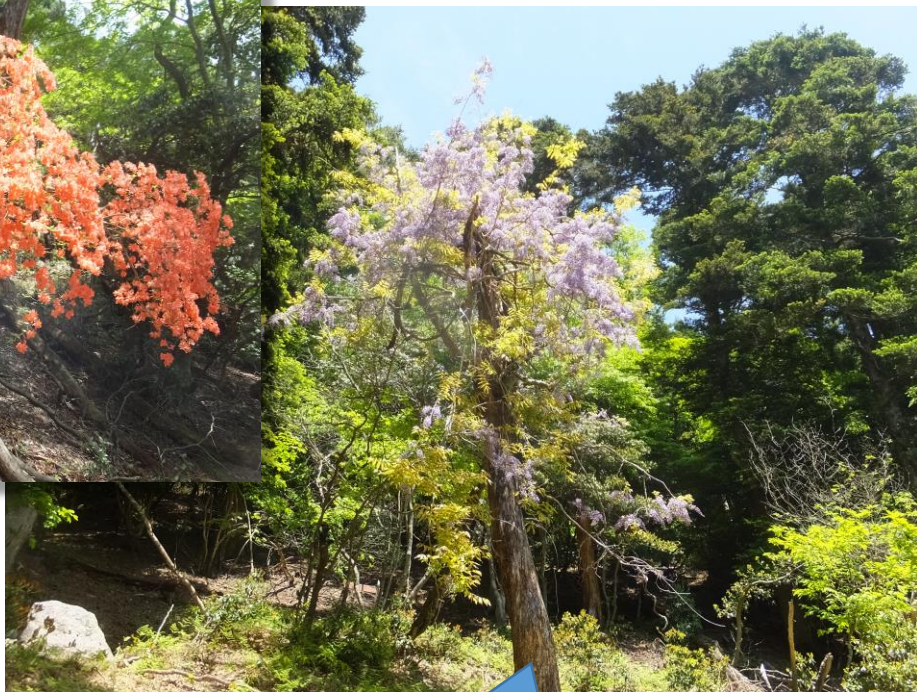
古木に巻き付くヤマフジ