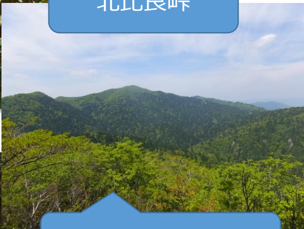
コヤマノ岳。天気良好