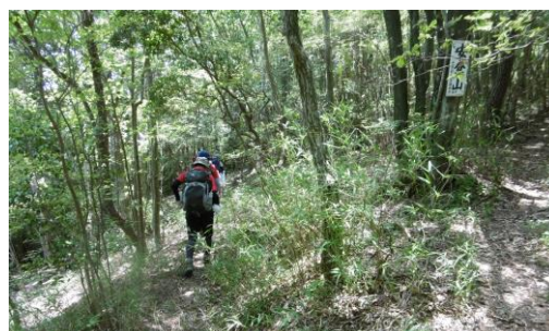
⑧ 安倉山(頂上には行かず巻き道通過)