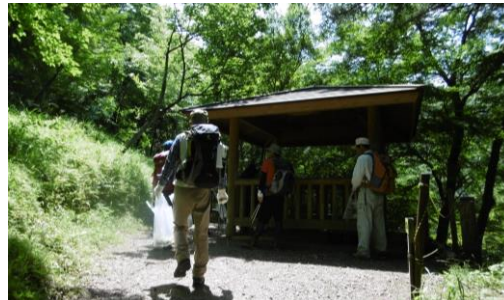
⑤ 桜の園の四阿でちょっと休憩