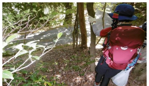
⑩ ゴルフ場到着(カート道が見えてます)