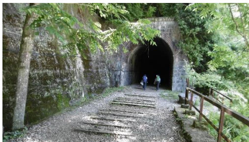
① 廃線跡トンネル入口

大峰山・安倉山で行われたクリーンハイキング(年6回、偶数月に実施)に参加。 JR 福知山線武田尾駅から廃線跡を歩き親水公園より桜の園を登り大峰山山頂に到着。頂上で少し早めの昼食を取り、その後地図に記載のない道を地図とコンパスで方位確認を行いながら安倉山を、そして引き続きゴルフ場の境界沿いを歩き、毎回ゴミ集積している長尾山霊園入口まで下りここで分別計量、少々休憩を取った後宝塚駅まで車道を歩き到着後解散。