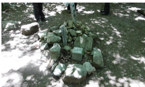
⑦ 大峰山頂上三角点