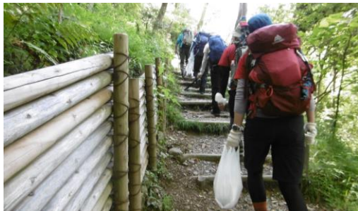
④ クリーンハイキングスタイル (カッチョイイ)