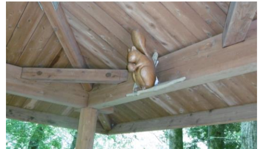
⑥ 四阿にリスがいました(守り神?)