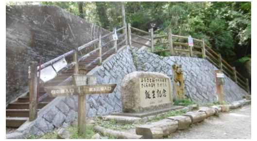
③ 親水広場記念碑(左の階段から登る)