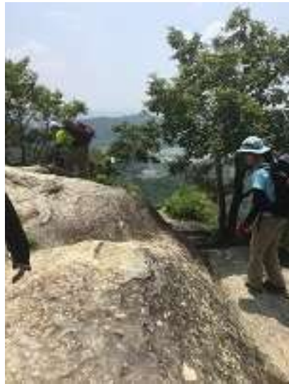
鷹ノ巣山東峰から高御位山を目指す面々