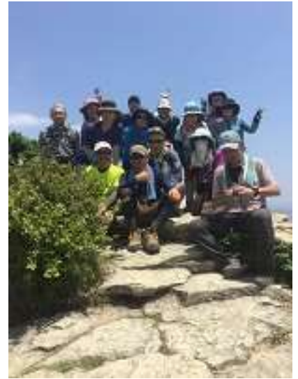
昼食後、高御位山山頂にて集合写真