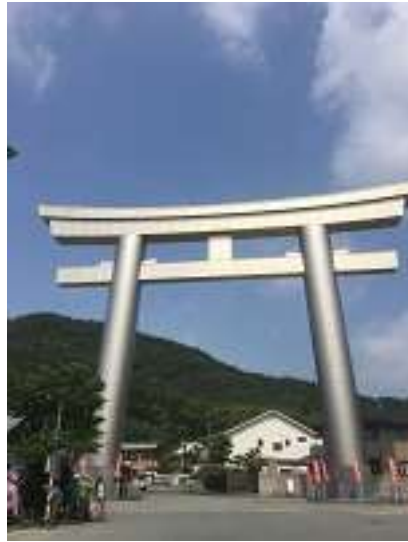
鹿島神社駐車場のチタン製の鳥居