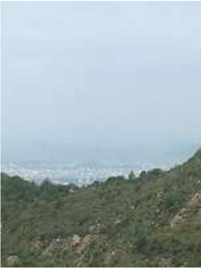
やはり眺望は良くない。天下の白鷺城も微かに見える・・・