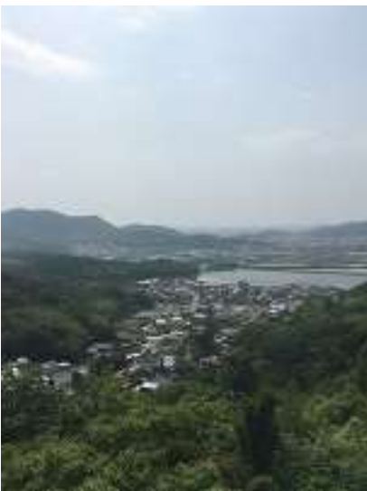
ガスっていて眺望は今一つ