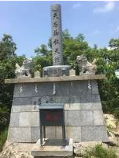
ここで拜んで山頂にある高御位神社へ