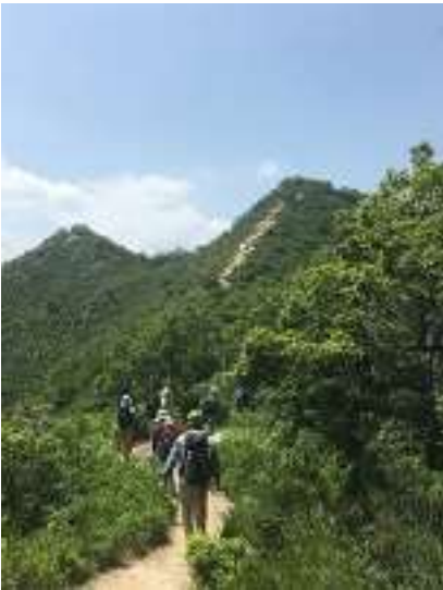
アップダウンの激しいハイキングでしたが、最後の登り直前