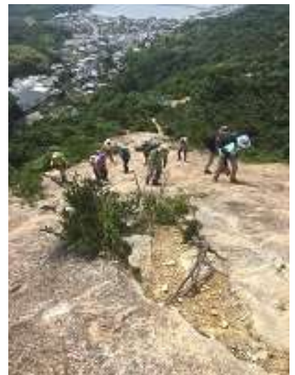
後方は思い思いにルートを選択して登る