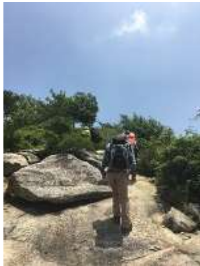
もうじき高御位山