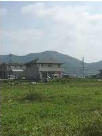
本日、目指す高御位山