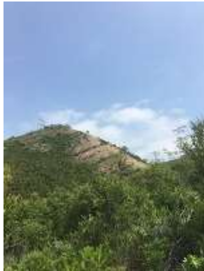
今から登る百間岩