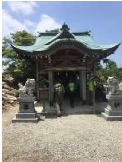
山頂にある高御位神社