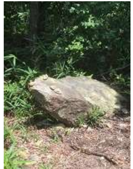
高御位山頂直前にあるかえる岩