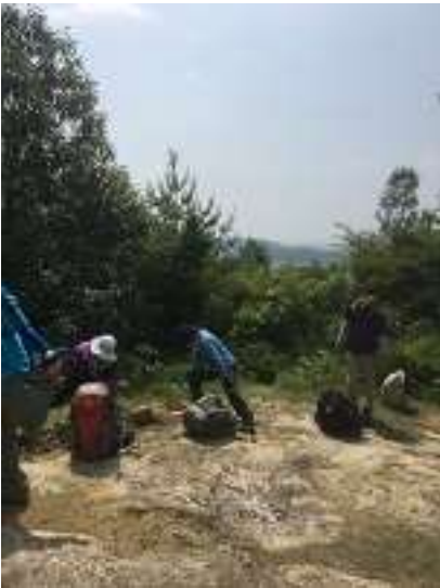
鹿島神社分岐にて各自準備体操