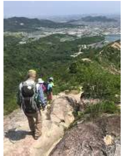
隊列なして下山するメンバー