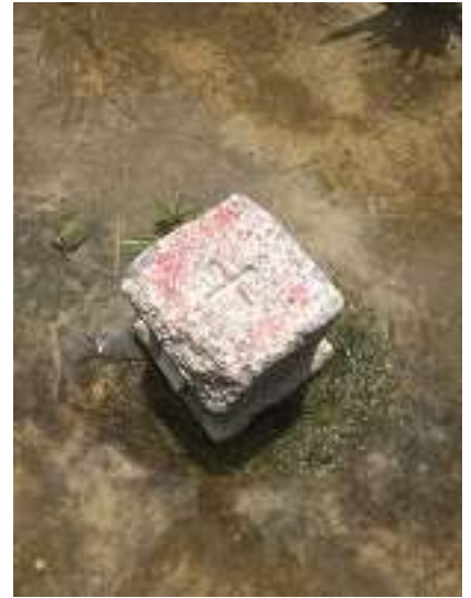
鷹ノ巣山本峰 三角点