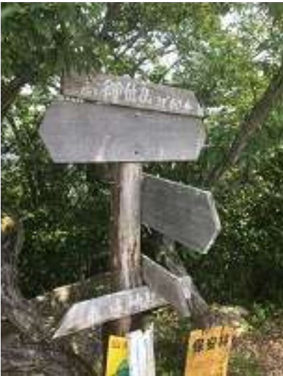
馬の背分岐 下山時はここまで戻って来る