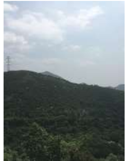
百間岩展望所にて、高御位山頂がかろうじて見えます