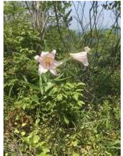
途中、ささゆりがまだ咲いていました。