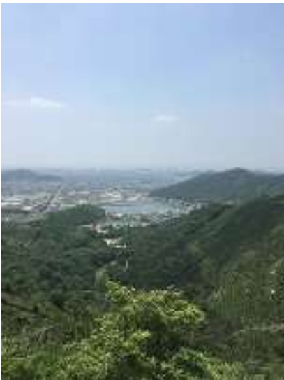
長尾奥山からの眺望