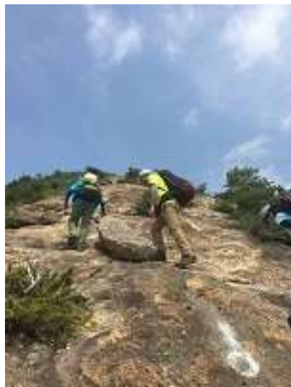
百間岩を隊列崩さず登る先頭グループ