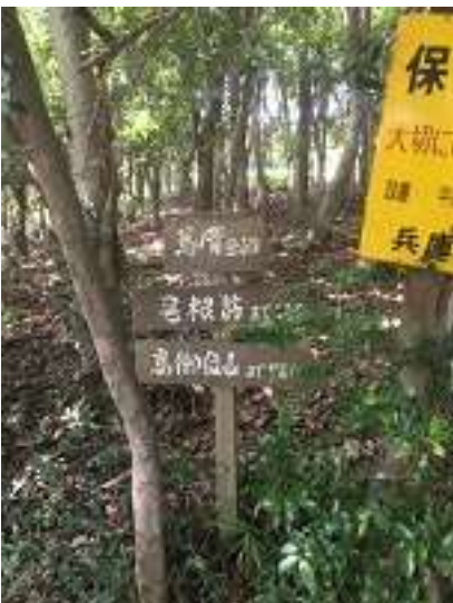
馬の背登山口に到着