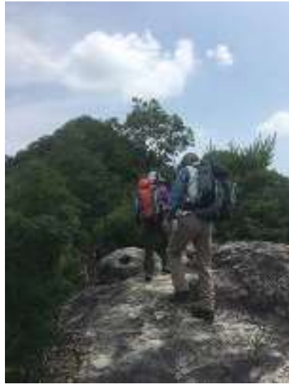
まずは鷹ノ巣山を目指して歩を進める