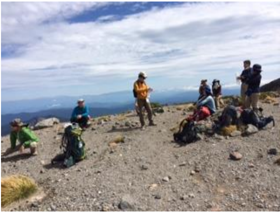
52. 頂上でアホな冗談言い合って、ゆっくり休む