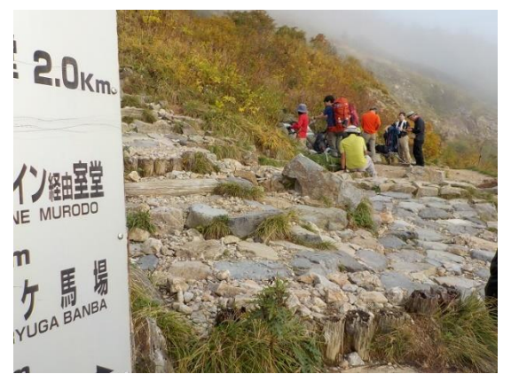
21. 南竜道分岐にて休憩 ここは南竜方面と室堂との分岐点