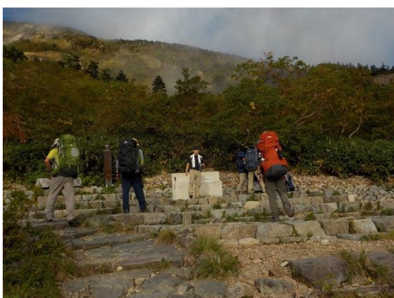
19. 甚之助避難小屋の水場 ちゃんとカランの付いた水道栓がある