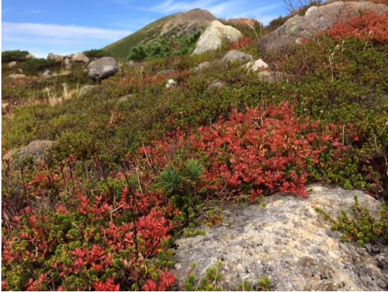
55. 少し早い紅葉が綺麗