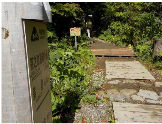
8. 道の先にある茶色のマットは外来植物(主にオオバコ)の新入を防ぐために設けられているそう