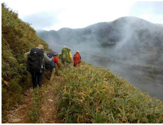
23. 南竜山荘が見えてきた