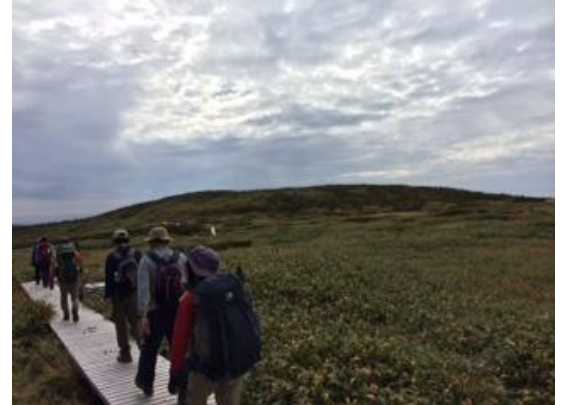
60. 弥陀ヶ原の高原 長い木道を進む