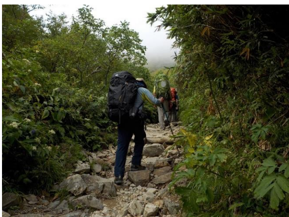
16. 石がゴロゴロの道をひたすら登る