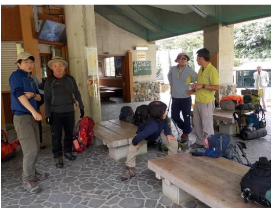
1. シャトルバスで別当出合に到着 出発準備をする