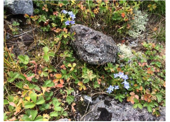
54. タテヤマリンドウ