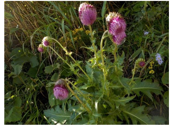
12. 花の大きさアザミ No1 のフジアザミ?