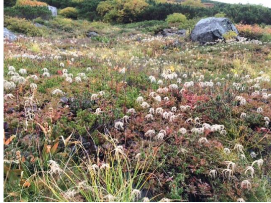
56. チングルマの花後の綿毛