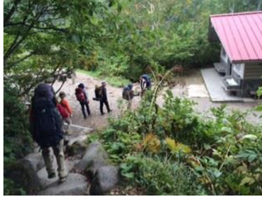
67. 中飯場に到着 このトイレは綺麗