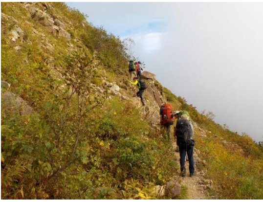
22. ここからはアップダウンがやや少なくなり、トラバース気味に進む