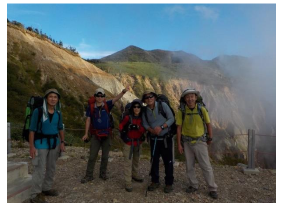
18. ガスが下から湧き上がってくる