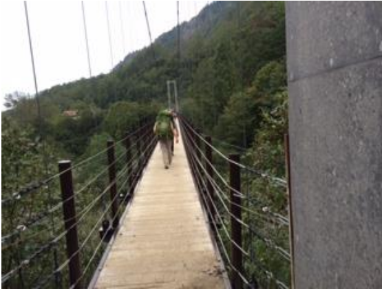
69. また、長〜い吊り橋を渡る