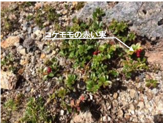
49. コケモモと赤い実