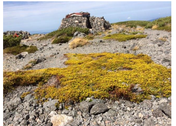
51. ガンコウランの黄葉 後方の石積みは小さな避難小屋