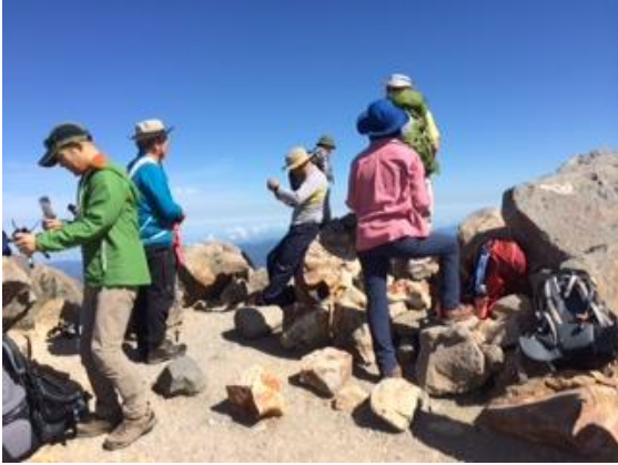
40. 頂上でしばし展望を楽しむ