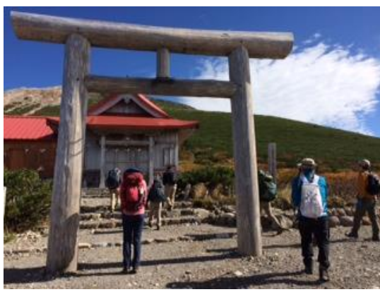
35. 神社にお参りして頂上に向け出発する