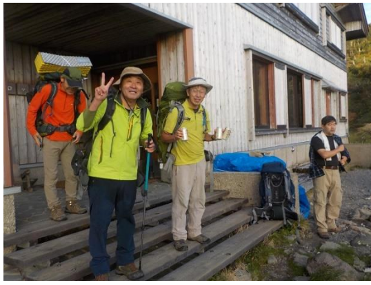
26. 南竜山荘に到着 夕食用のビールを早速仕入れる