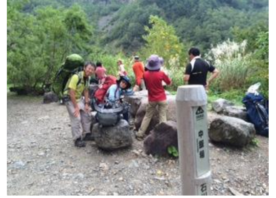
68. もう少して別当出合 ここでもゆっくり休む