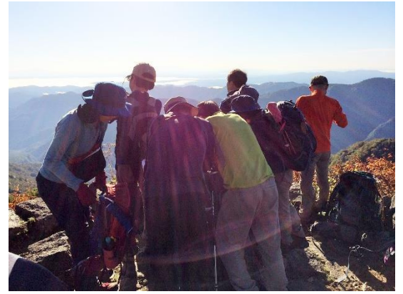
30. アルプス展望台で山の位置を示した表示板を見て山の同定を楽しむ