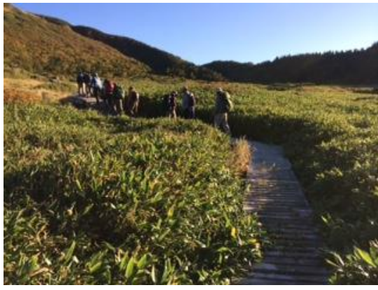
29. 最初は歩きやすい木道が続く