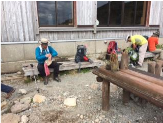
61. 南竜山荘に戻ってきた