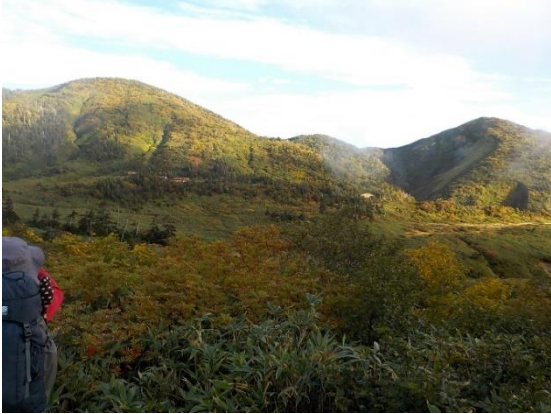
25. 向こう側が南竜山荘と南竜ヶ馬場