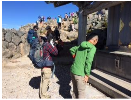
38. 最高峰の御前峰に到着