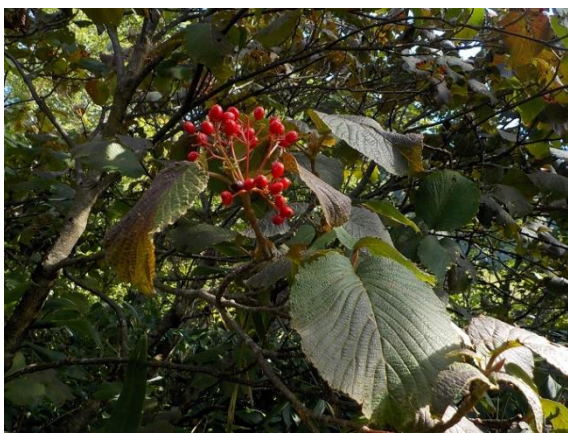
13. ムシカリ(オオカメノキ)の赤い実