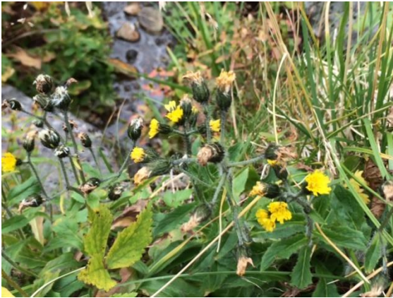
58. ミヤマコウゾリナ