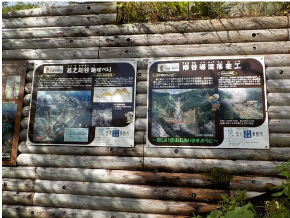
10. その工事の解説表示板