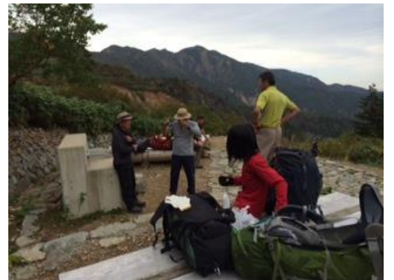
65. 甚之助避難小屋の水場に到着