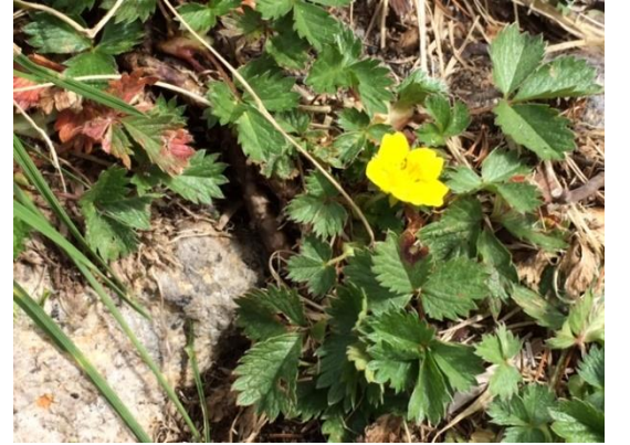
57. 遅咲きのミヤマキンバイ輪