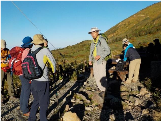
28. 早朝、南竜山荘で女性陣と合流して、白山ピークハントに出かける