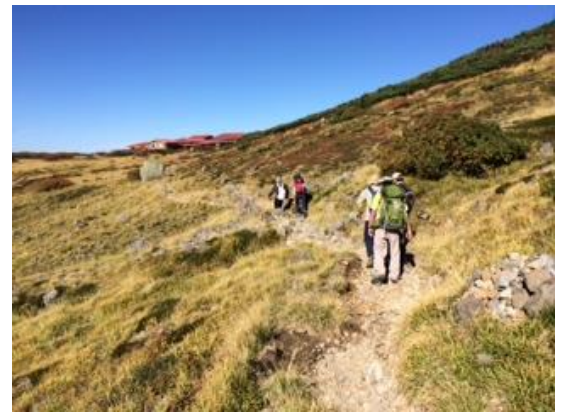
33. 室堂のビジターセンターが見えてきた