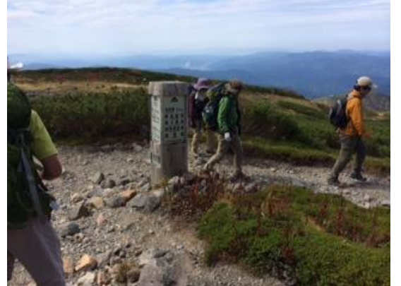
45. 大汝峰への分岐を通過