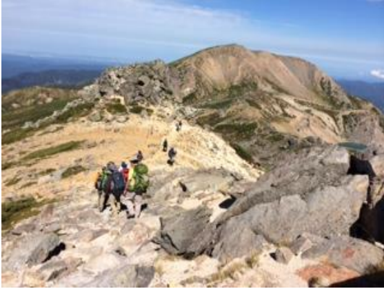
43. 岩稜のコースをひたすら下る