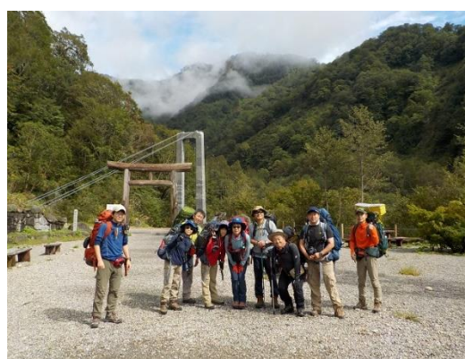
2. 南竜ヶ馬場に向けいざ出発