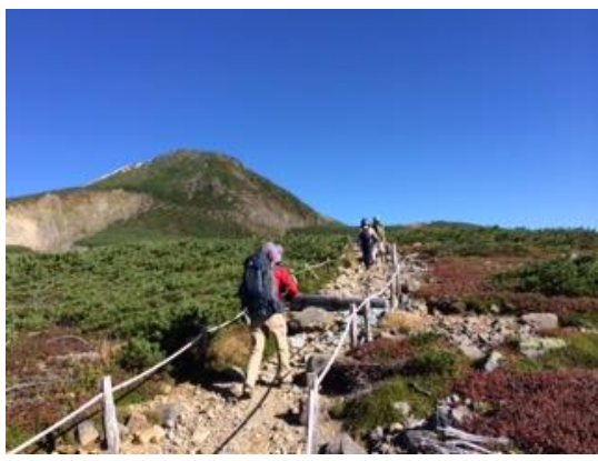
32. 白山頂上が見えてきた