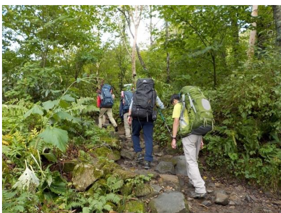
4. 最初はこんな樹林の中を進む