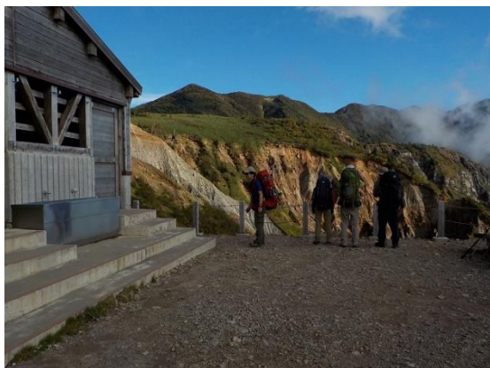
17. 甚之助避難小屋に到着