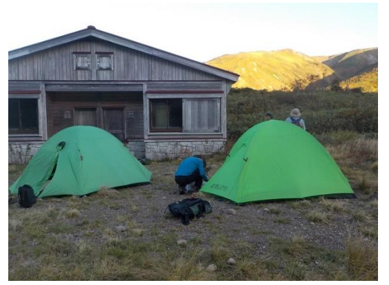
27. 南竜ヶ馬場のテント場と我らのテント2張り