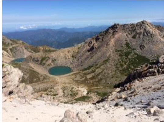
41. 剣ヶ峰と紺屋ヶ池