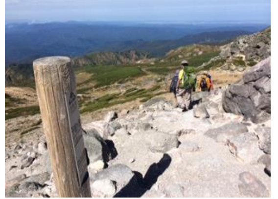
42. 大汝峰を目指して御前峰を下って行く