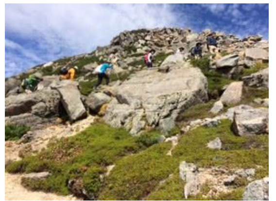
48. 岩の登山道を登る