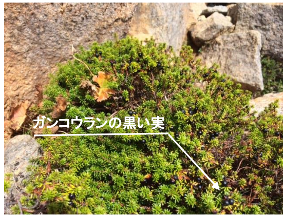
47. ガンコウランと黒い実