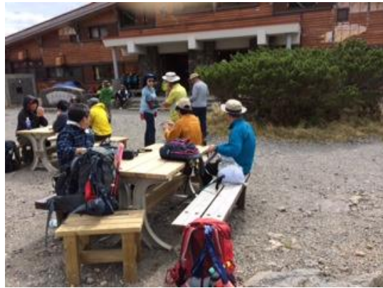
59. 室堂に戻ってきた やはり、人でいっぱい