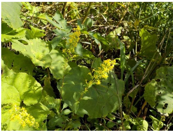
7. アキノキリンソウ