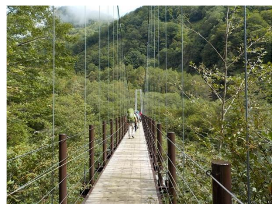
3. 200mの長~い 吊り橋を渡る 結構揺れて怖かった