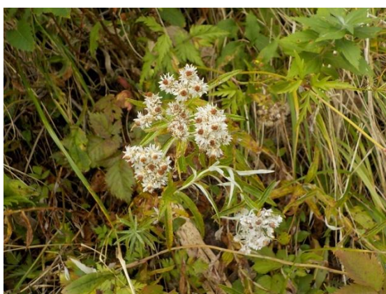
20. ヤマハハコの花後の姿 キク科植物であることがよく分る