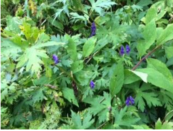
66. 秋の山野草の代表格、トリカブト