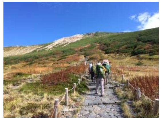
36. 石畳の登山路を進む