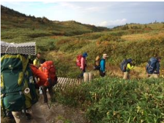
63. 早朝、全員そろって南竜を出発