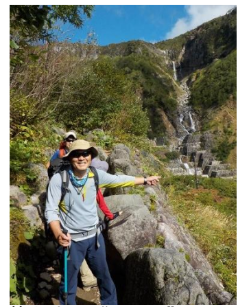
9. 甚之助谷と“谷やん” 後方は「導流落差工」による砂防工事現場とその人工的造形美