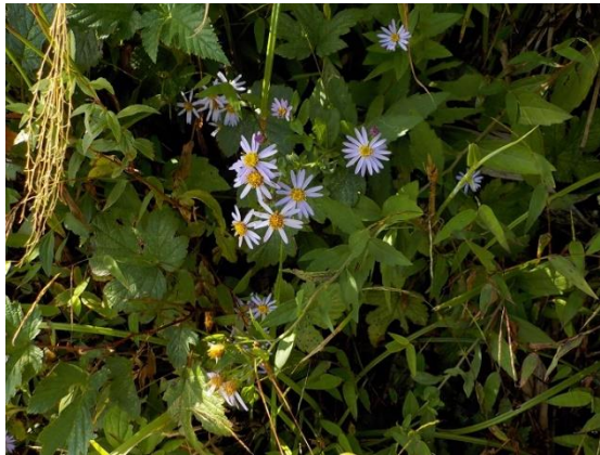
11. 山野に多いヨメナ