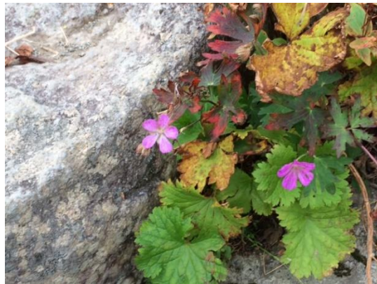
62. ひっそりと咲いていた遅咲きのハクサンフウロ 秋でもハクサンを冠した植物にいくつか出会えた