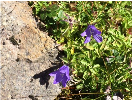
37. イワギキョウがまだ咲いていた