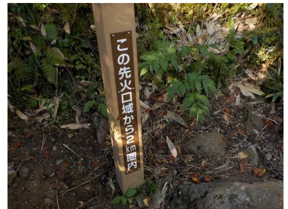
15. 白山は火山なのだ! (休火山) それで、こんな表示も