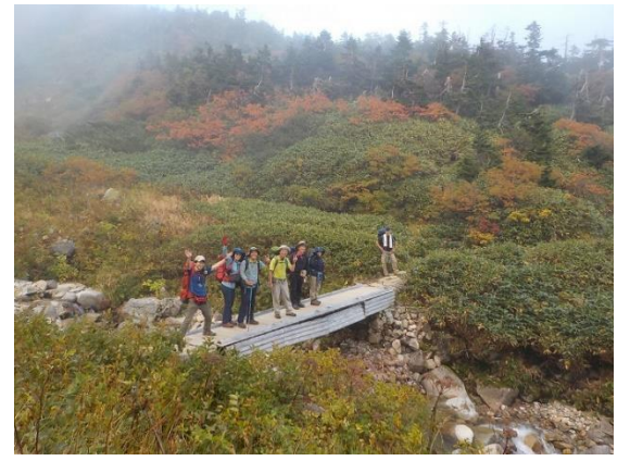
24. この辺り、結構紅葉が綺麗だった