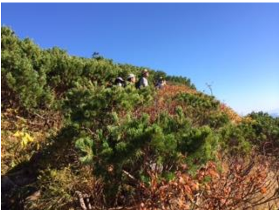
31. ハイマツ帯の登山道を登っていく