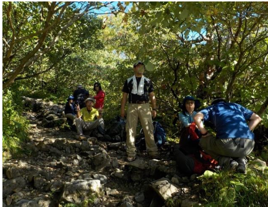
14. 湿度が高く、暑かった そこで、木陰で休憩中