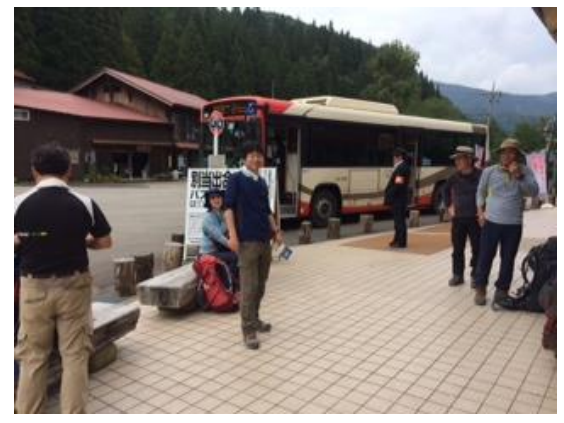
71. シャトルバスに乗り市ノ瀬着 これで今回の白山山行は無事終了した