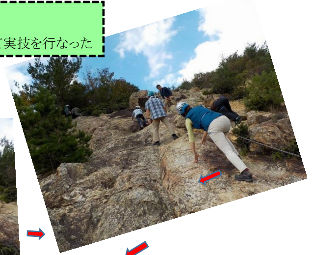
ビレイをとっているので急斜面の岩場でも安心して登ったり下ったりできる。