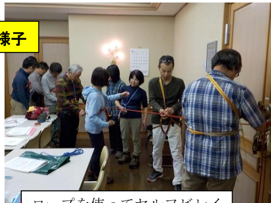
ロープを使ってセルフビレイの仕方を学ぶ