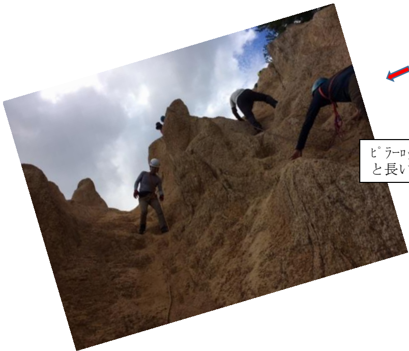
ピラーロックに場所を移動して、岩稜帯での歩行訓練と長い急斜面の登下降を繰り返し行なった。