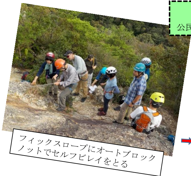
フィックスロープにオートブロックノットでセルフビレイをとる