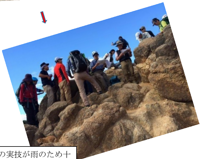
前回の「読図・コンパス」の実技が雨のため十分にできなかったので、今回、風吹き岩に移動して山座同定、現在位置の確認などの実技を追加して行なった。