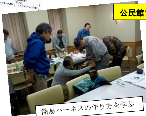
簡易ハーネスの作り方を学ぶ